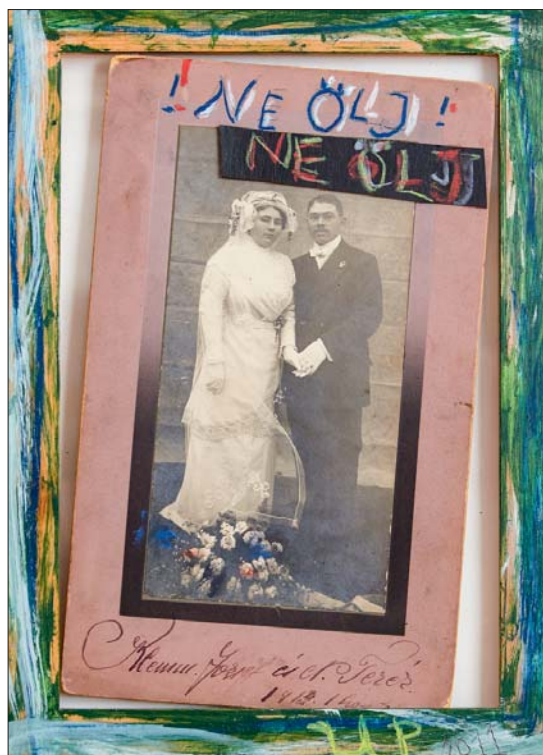
UJHÁZI PÉTER: NE ÖLJ! 2011, AKRIL, KRÉTA, PAPIR, FA, FOTÓ, 33x24 CM