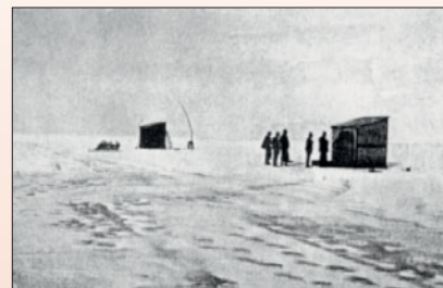
76. ábra. Mérő-állomás a Balaton jégen. A báró Eötvös Lóránd-féle csavaros mérleggel mértük a föld belsejében a sűrűbb és kevésbé sűrű tömegek elhelyezkedését. Balra a lakósátor, jobbra a műszersátor. (Szerző fényképe.)

A műszer leírása nem tartozik ide, csak annyit kell róla elmondanom, hogy körülbelül embermagas rézállvány volt, három lábon s ezt kellett mindig fölállítani a jégen és aztán egy éjjelre egy helyben hagyni, hogy éjjel, nyugodt levegőben a műszert le lehessen olvasni minden ötnegyed órában. Éjjel tehát minden ötnegyed órában fel kellett kelnem, kimenni ahhoz a kis vászonsátorhoz, amelyben a műszer állt s leolvasni a mutató állását, aztán átfordítani a körnek egy ötöd részével s ismét megvárni ötnegyed óra hosszat, amíg a benne levő vízszintes, csavaros inga megáll s újra leolvasni stb. Így tehát az éjjelek meglehetősen nyugtalanul teltek el. Az észlelő szántalpakra állított deszkabódéban lakott.