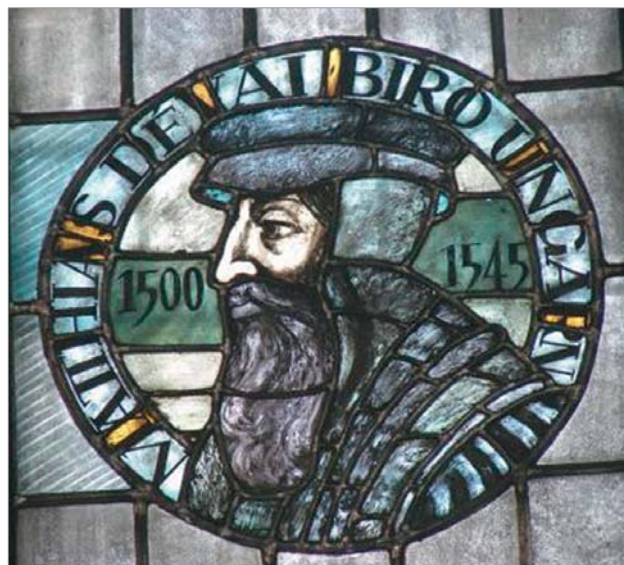
Dévai Bíró Mátyás

A farizeus imádkozni ment a templomba, de imája arról szólt: Gyere Isten, veregesd meg te is a vállamat! Mert