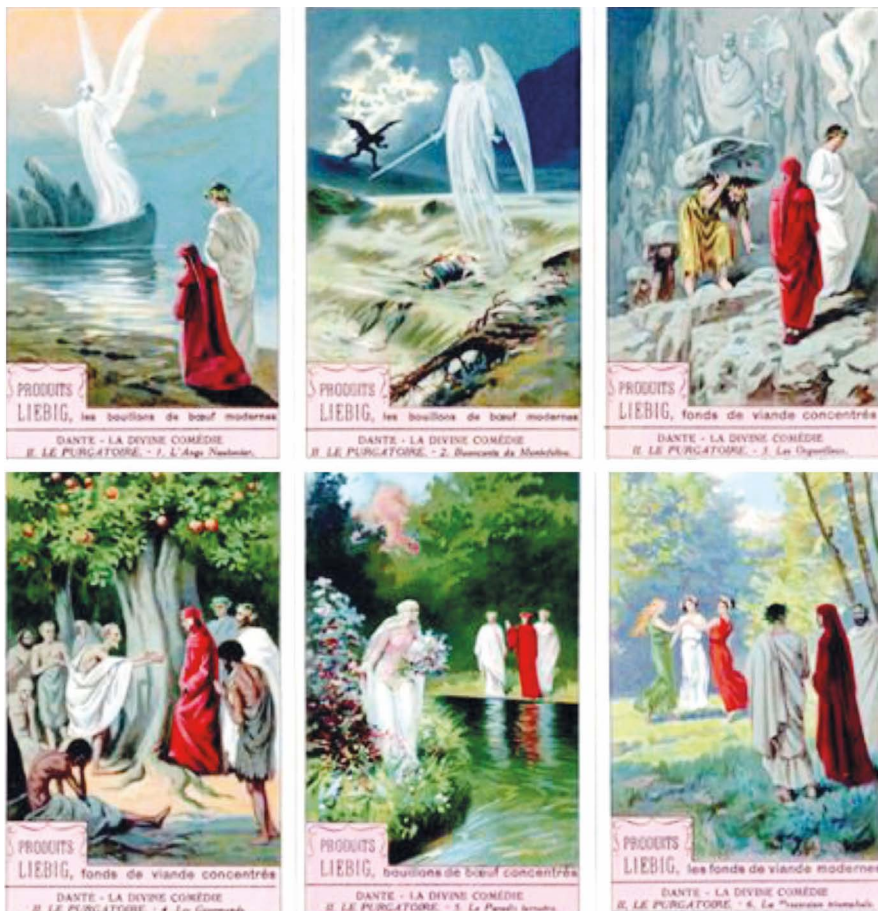
10. kép: Purgatórium.

A Purgatórium az a hely, „ahol kitisztul az emberi szellem s méltóvá lesz, hogy legyen ég lakója”. 32 Michelino Dante festményén a költő jobbával pont a Purgatórium körkörös teraszai felé mutat.