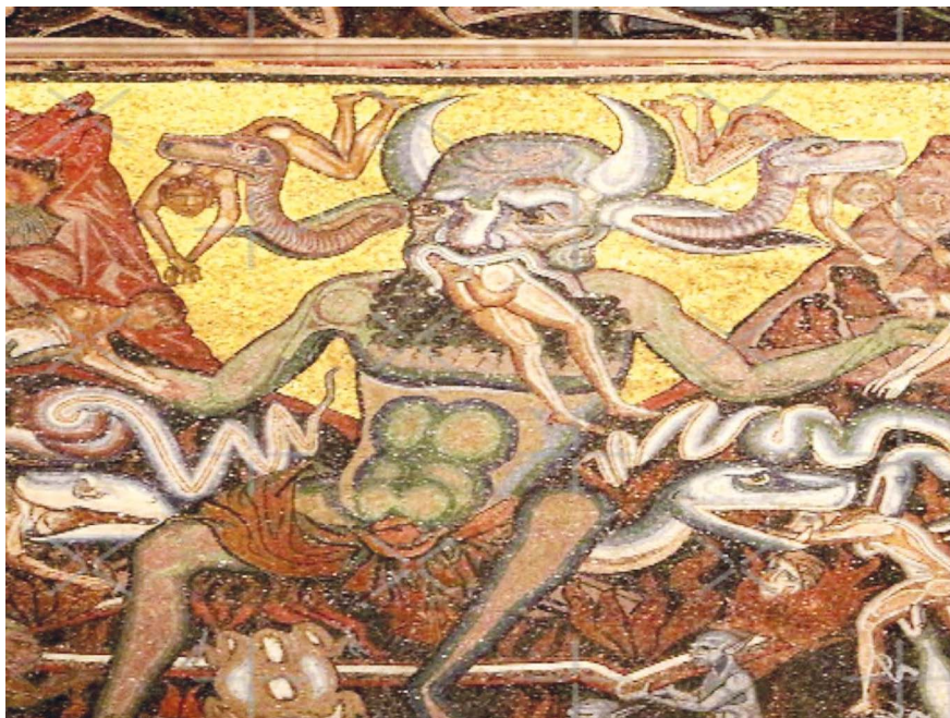
9. kép: Lucifer (Torriti, 1285–1295) (Forrás: https://www.civico20news.it )

„A borzasztó birodalom királya, a jégben állt, kiütve fele mellett. ...s megláttam három arcot, a fején: egyik elöl volt, vérvörös a színe... S mindenik alatt két nagy szárny motollált... S nem tollból vannak ám ezek a szárnyak: ...És úgy zúz egy-egy bűnöst mind a három száján fogával, mint tiló a kendert gyötörve mind, hogy mind egyszerre fájjon. És azt, ki elülső szájába hemperg, fogánál jobban karma tépi, hátán csontig olykor nyúzóván a bűnös embert.” 30