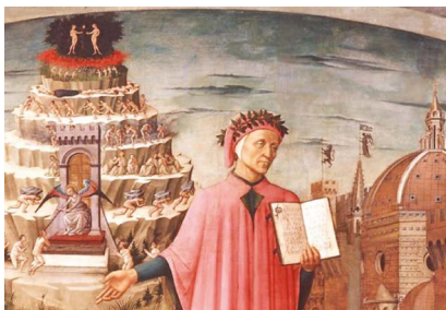
1. kép: Dante portréja (Michelino, 14650)