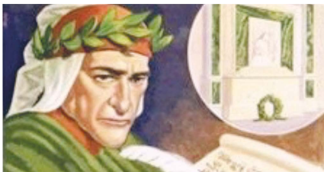
3. kép: Dante képmása és sírhelye.

Botticelli portréja oldalról ábrázolja Dantét, megörökítve a költő igencsak egyedi, karakteres arcvonásait, a Liebig-kártya pedig Dante ábrázolásának ezeket a már jól ismert kliséit utánozza.