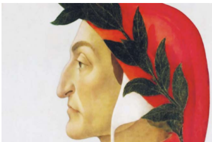
2. kép: Dante portréja (Botticelli, 1495) körül)

Michelino festményén, a firenzei Santa Maria del Fiore-székesegyház falán, Dante piros köpenyben és capottóban, fején babérkoszorúval látható. A kép mértani közepén helyezkedik el, balján a dóm, kezében a Divina Commedia , jobbjaival a Purgatórium körei felé mutat.