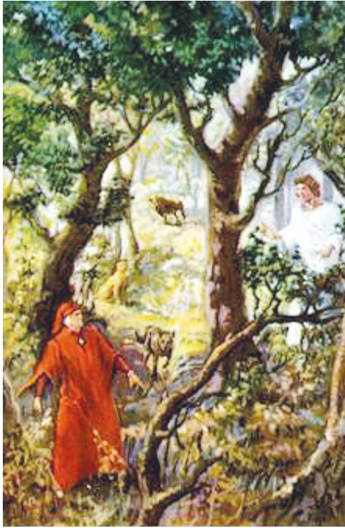
7. kép: Sűrű, sötét erdő.

„...a félelem megint leláncolt, feltűnve egy oroszlán szörnyű képe: mely emelt fővel közeledni látszott s dühös éhséggel zsákmányát kereste, úgy hogy a lég tőle remegni látszott. S egy nőstényfarkas, melynek vézna teste terhesnek tünt föl minden céda vággyal s ki miatt lón már annyi népnek veszte.” 28