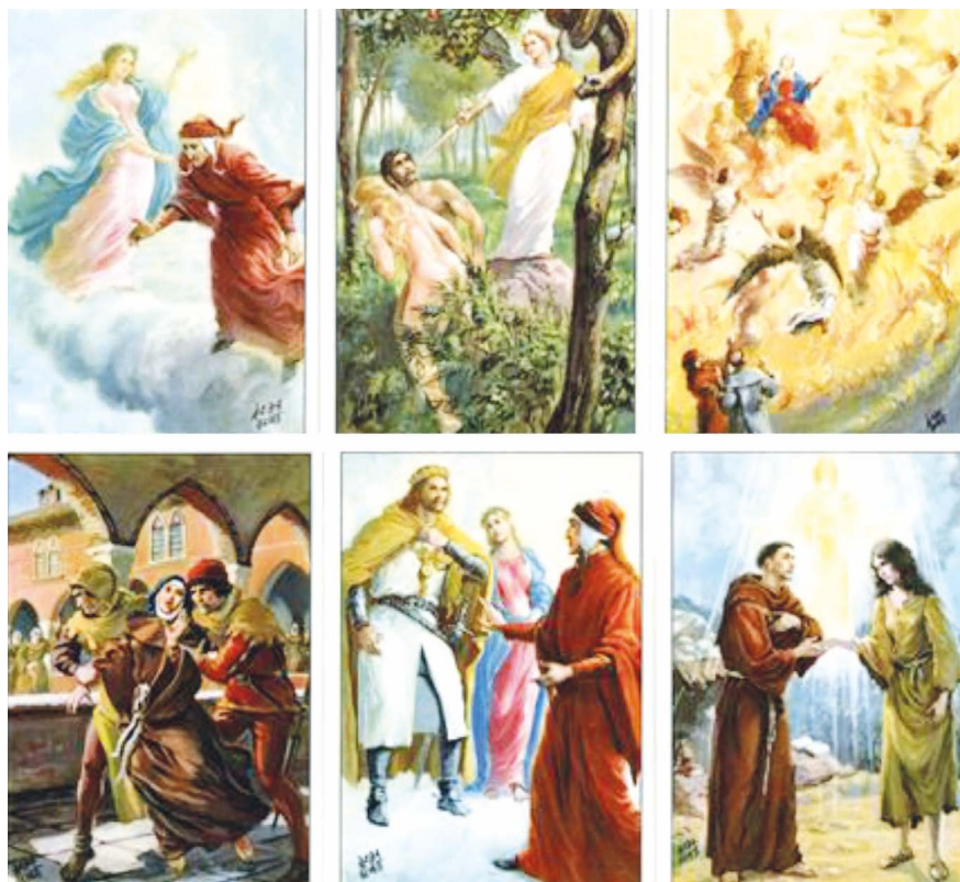
11. kép: Paradicsom.

„De nézd meg jól csak: mint megannyi törpe jön mind a kő alatt görbülve kétrét; már látni: mellüket verik gyötörve. Ó, gőgös keresztények, balga népség, kinek elbízott, nyavalyás elmétek a visszas útban veti reménységét!” 33