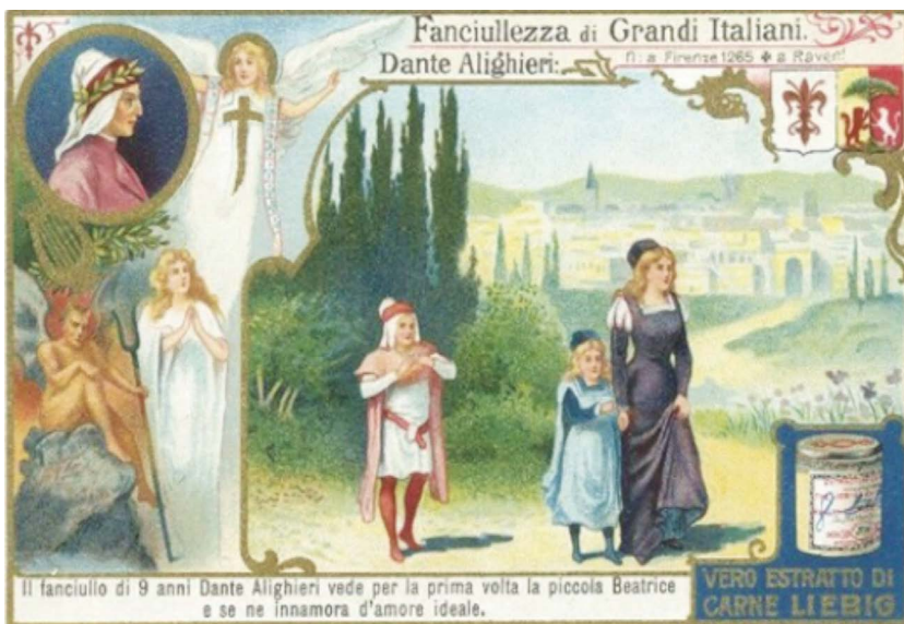
6. kép: Sűrű, sötét erdő.