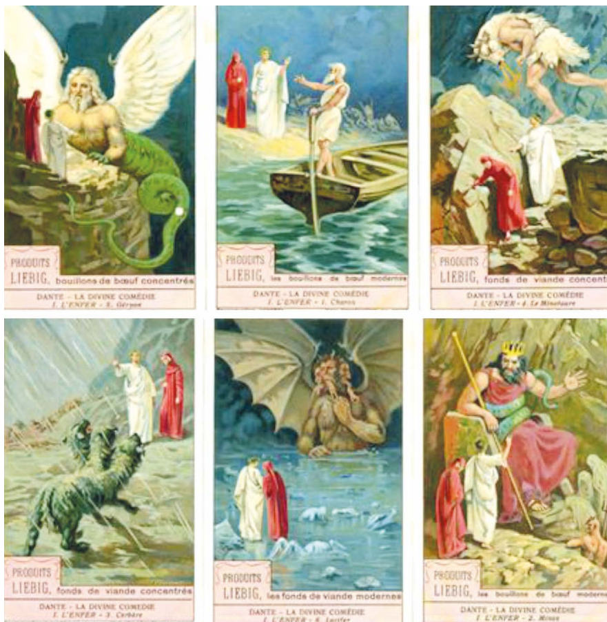
8. kép: A Pokol.