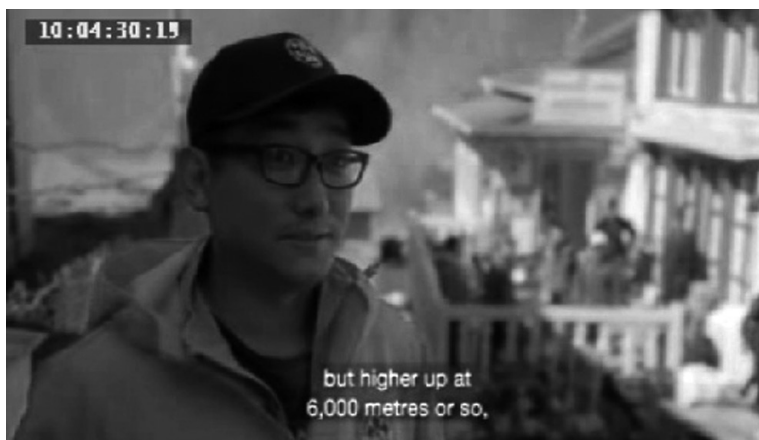
3. ábra: Beszélő fejes jelenetrészlet a Todd Sampson: A tűrés határán című dokumentumfilm-sorozat 4. epizódjából