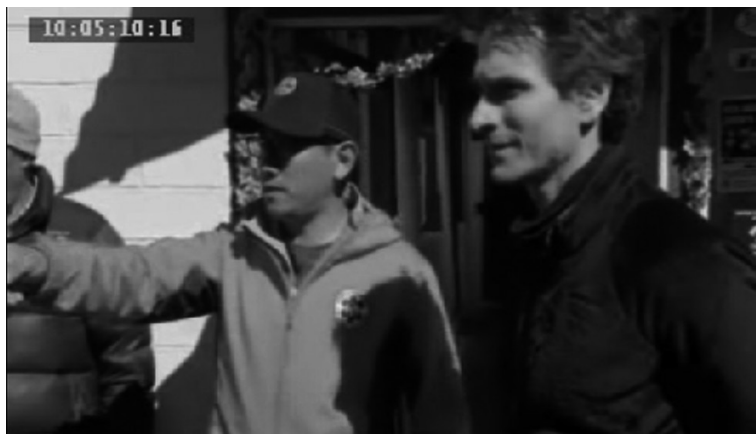
1. ábra: Párbeszédés jelenetrészlet a Todd Sampson: A tűrés határán című dokumentumfilm-sorozat 4. epizódjából