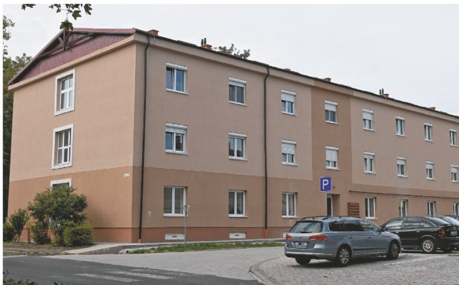
A teljeskörűen felújított társasház