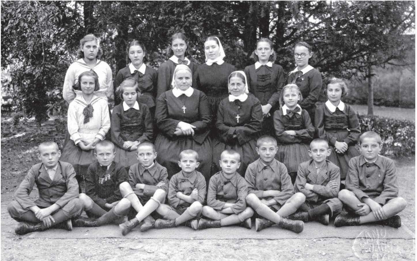
Árva gyermekek, internátusi lakók és diakonisszák a győri szeretetházban