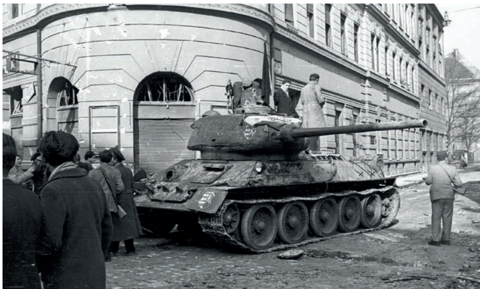
Forradalmi utcakép 1956-ból

A benyomások pozitívak lehetnek, mert mire megérkeztek a külföldiek, az államhatalom már elhatározta, hogy rehabilitálja a püspököt. Így amikor a vendégek tényleg fölhozták az Ordass-ügyet, az ál-