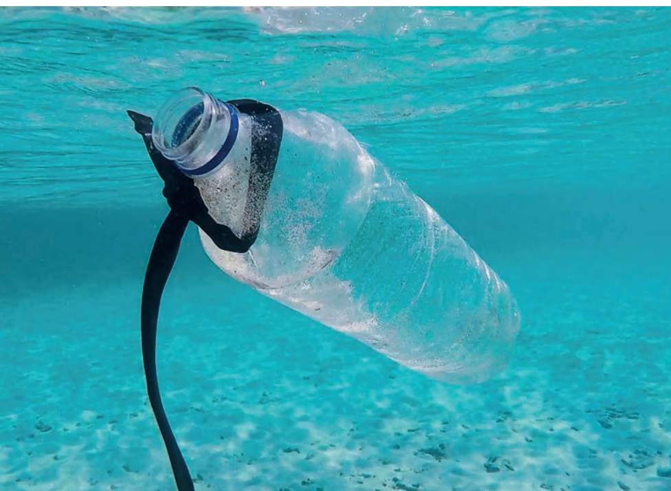
KÉPEINK ILLUSZTRÁCIÓK / FOTÓ: BRIAN YURASITS / UNSPLASH.COM

Az eredeti, teljes írás október 1-jén jelent meg a Kötőszó evangélikus közéleti blogon