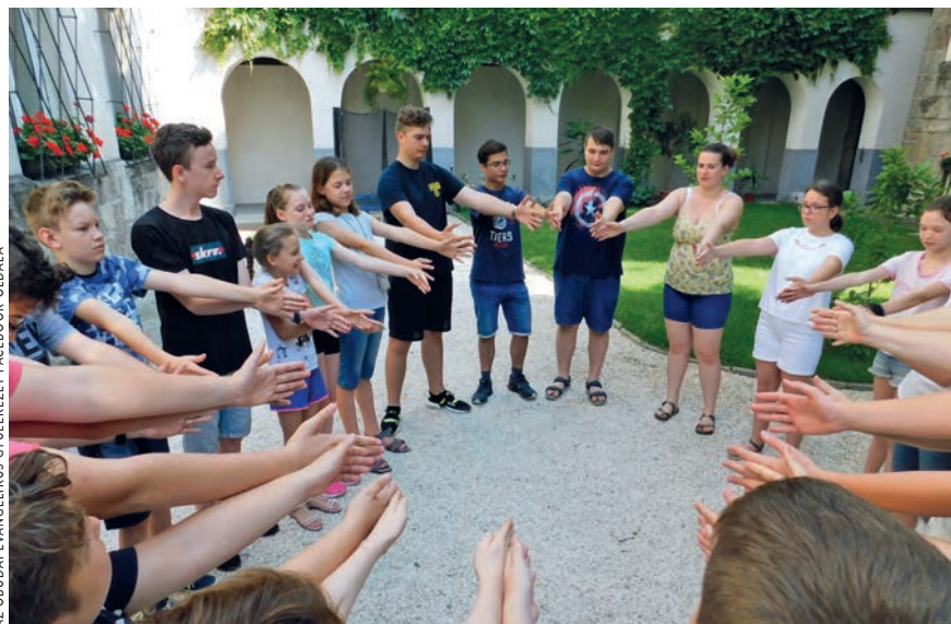
AZ ÓBUDAI EVANGÉLIKUS GYÜLEKEZET FACEBOOK-OLDALA