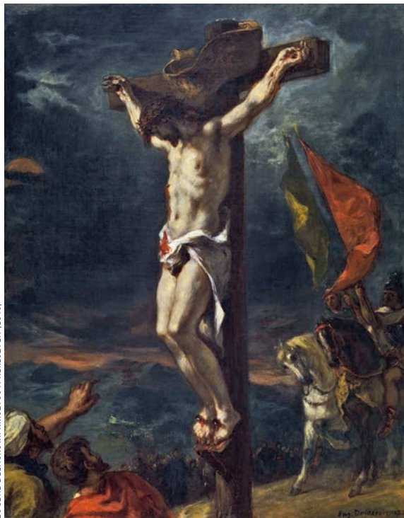
EUGÈNE DELACROIX: KRISZTUS A KERESZTÉN (1846)

Imádkozzunk! Kérünk, Urunk, szabadíts ki minket testi és lelki zsákutcáinkból, tisztíts meg bennünket, és vezess ígéreteidben bízó hitre. Ámen.