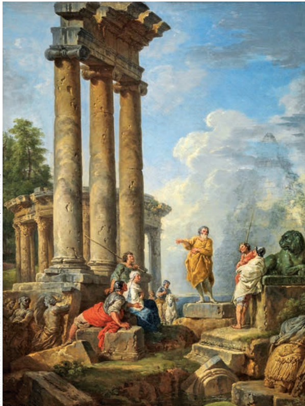
GIOVANNI PAOLO PANINI: SZENT PÁL PRÉDIKÁL A ROMOK KÖZT (1735 KÖRÜL)

Imádkozzunk! Mindenható Istenünk! Hálát adunk megszólító szeretetedért. Megköszönjük azokat az igehirdetőket és bizonyságtételeket, akiket azért indítottál munkára, hogy tiéd legyen a szívünk. Áldott légy, hogy annyi elutasítás és elszalasztott alkalom után is kerestél minket, hogy nem mondtál le rólunk. Add, Urunk, hogy szívünk ellazított, porhanyós és gazdagon tápláló föld lehessen igéd és a körülöttünk élők számára. Tégy minket alkalmassá a gyümölcsstermesre megszentelő Lelked által. Ámen.