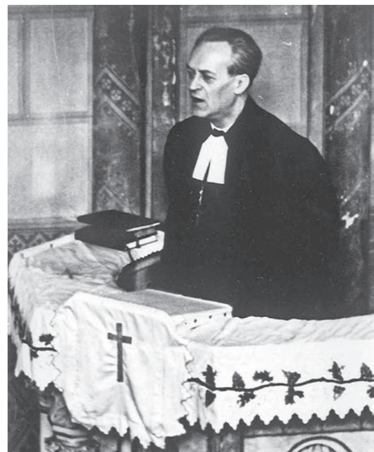
Ordass Lajos püspök a fásori evangélikus templomban

Az egyházunkban bekövetkezett forradalmi változások közvetlen kiváltója az volt, hogy az Egyházak Világtanácsa 1956 nyarán hazánkban, Galyatetőn rendezett konferenciát (ez jórészt a magyar református egyház külpolitikai sikerének