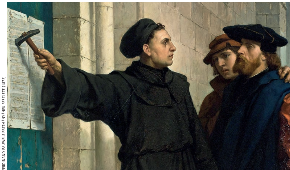
FERDINAND PAUWELS FESTMÉNÉNEK RÉSZLETE (1872)

Az emberek könnyebben fordulnak istenpótlékokhoz, ha azok megnyugtadják a lelküket. A 15. és a 16. század fordulóján környékén felfokozott volt a világvégvárás, félelmet keltett a pestisjárvány és az apokaliptikus asztrológiai jóslatok is. Ehhez társult mindaz, amit az egyháztól a pokollal és a tisztítótűzzel kapcsolatban megtudhattak. A félelem pedig arra ösztönözte az embereket, hogy megtegyék a tőlük telhetőt, vagyis egy-egy búcsúcédula megvásárlásával „biztosítsák” a maguk és szeretteik helyét a mennyországban a világvége bekövetkeztekor. Pedig a félelem rossz tanácsadó: hiszékeny és kiszolgáltatottá tesz. Aki telve van félelemmel, az bármit megtenne azért, hogy félelmének tárgyát elkerülje, és lelkének megnyugvást szerezzen.