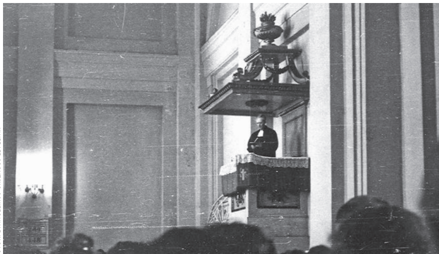
Ordass Lajos püspök a Deák téri evangélikus templomban

A szerző az Eötvös Loránd Tudományegyetem Történelemtudományi Doktori Iskolájának hallgatója