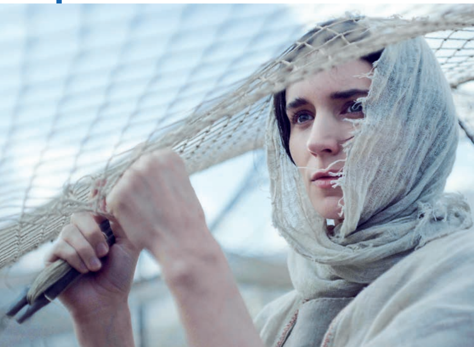
JELENFOTÓ A MÁRIA MAGDOLNA CÍMŰ FILMBŐL

Amagdalai Mária, avagy Mária Magdolna. A Biblia különböző magyar fordításai több alakban említik a szóban forgó Máriát. „Elment a magdalai Mária, és hírül adta a tanítványoknak, hogy látta az Urat...” – olvassuk például János evangéliumában (20,18) a Magyar Bibliatársulat revideált új fordítása (2014) szerint. Más fordításokban a Mária Magdaléna vagy Mária Magdolna nevet találjuk. A Magdaléna jelentése ugyanis nem más, mint „Magdala városából való nő”. A Magdolna pedig a Magdaléna magyar alakváltozata.