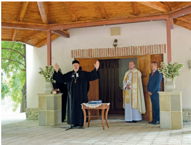
FOTÓ: ADÁMI MÁRIA