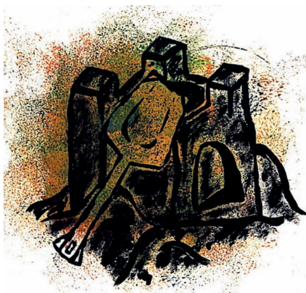
ILLUSZTRÁCIÓK: FÜLLER KAMILLA

Nyári kalandok, tapasztalatok, tennivalók. Építs homokvárat! • Sétálj mezítláb a fűben! • Ázz meg a meleg nyári esőben! • Aludj sátorban! • Építs bunkert a barátaiddal! • Nézz hullócsillagokat! A legjobb erre az augusztus 10–15. közötti időszak; ha felhőtlen az éjszaka, akkor nyolcvan-százhusz hullócsillagot láthatsz óránként. (Természetesen minél kevésbé kivilágított helyről nézed, annál több csillagot vehetsz észre.) • Kóstolj meg fagyiból egy új ízt! • Figyelj egy órán át egy állatot! • Gondozz egy növényt! • Nézz meg jól pillangókat! Némely állatkertben van pillangóház, ott alaposan megfigyelheted őket. (A budapesti állatkertben a nyári szünidőben működik a lepkekert.) • Szagolj meg minél több virágot! • Csinálj naptekót! (A mintát ragaszd le néhány napra szigetelőszalaggal, és tölts időt a szabadban, a többit a nap elvégzi.) • Agyagozz! • Mozogj sokat! Sétálj valakivel egyet esténként, ha teheted! • Tölts időt a barátaiddal! • Tanulj meg elkészíteni egy ételt! • Készíts gyümölcssalátát! • Fagyassz le jégkockának egy-egy szem epret, málnát, szedret! Ezzel hűsítsd az innivalódat.