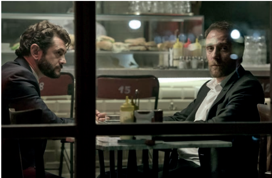
JELENETFOTÓ A HELY CÍMŰ FILMBŐL

A Hely az élet színpada Genovese új filmjében