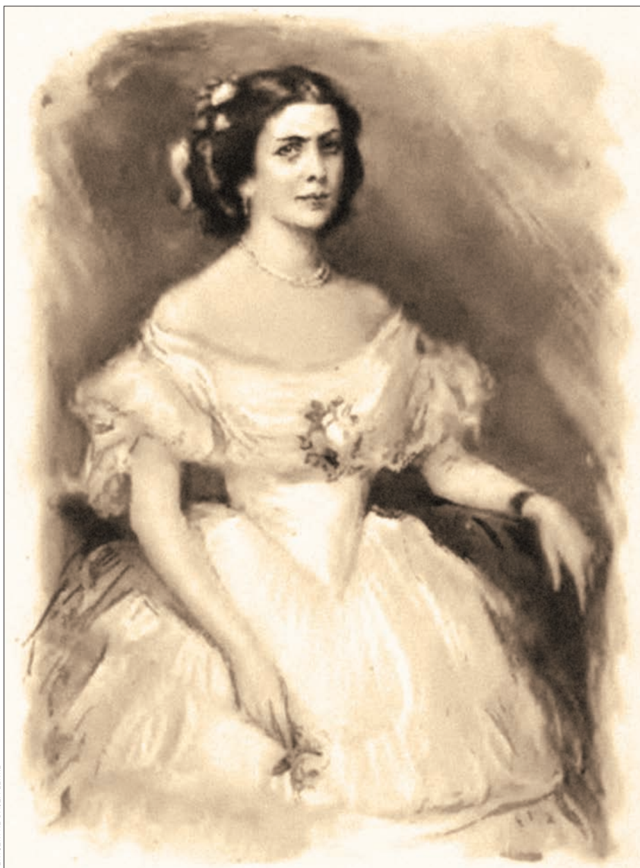
BENICZKYNÉ BAJZA LENKE

Ami a stílusát illeti: inkább modoros volt, mintsem magával ragadó, de a maga korában megtalálta a közönségét. Nem lehet véletlennek nevezni, hogy a Petőfi Társaság az első nőként fogadta tagjainak sorába. Regényeinek címei sokat elárulnak világképéről: A fátyol titkai , A házasság titka , Leányok tükre és egyebek. Számos lap közölte novelláit és tárcáit ( Hölgyfutár , Koszorú , Pesti Hírlap , Pesti Napló stb.), az 1850-es és 1860-as évek fordulóján hente megjelenő Nővilágnak (mondhatni: a korabeli Nők Lapja ) pedig főmunkatársa volt. E lapban – Hetilap a magyar hölgyek számára – rendre beszámolt külföldi divathírekről, hírességekről, ismert és népszerű nőkről, amihez alapul szolgált, hogy külországi újságokból szemezgetett. Ezenkívül számos, a nők számára praktikusnak gondolt háztartási, házassági, gyermeknevelési és egyéb információ is megjelent itt. Regényeire, novelláira azonban a főúri,