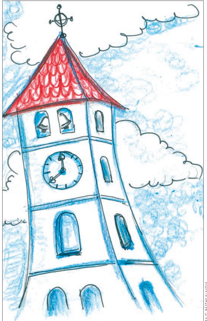
RAJZ: BASTHY KLÁUDIA

De aztán megjavították a kis szerkezetet, visszahozták, és beszerelték újra. Hosszú órákig állították, hogy hibátlanul működjön, s végül egy kis rácsot is felszereltek az ablakra, hogy a galambok ne férjenek hozzá, vagy ne lehessen bármiféle ággal, bottal megpiszkálni.