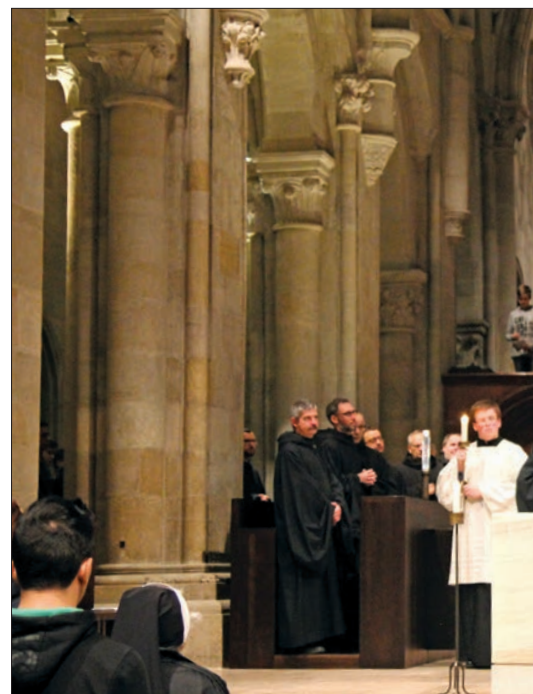
A pannonhalmi bazilikában január 19-én tartott Károly evangélikus lelkész volt