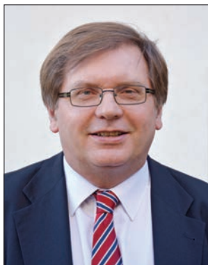
Fabiny Tamás püspök Északi Evangélikus Egyházkerület