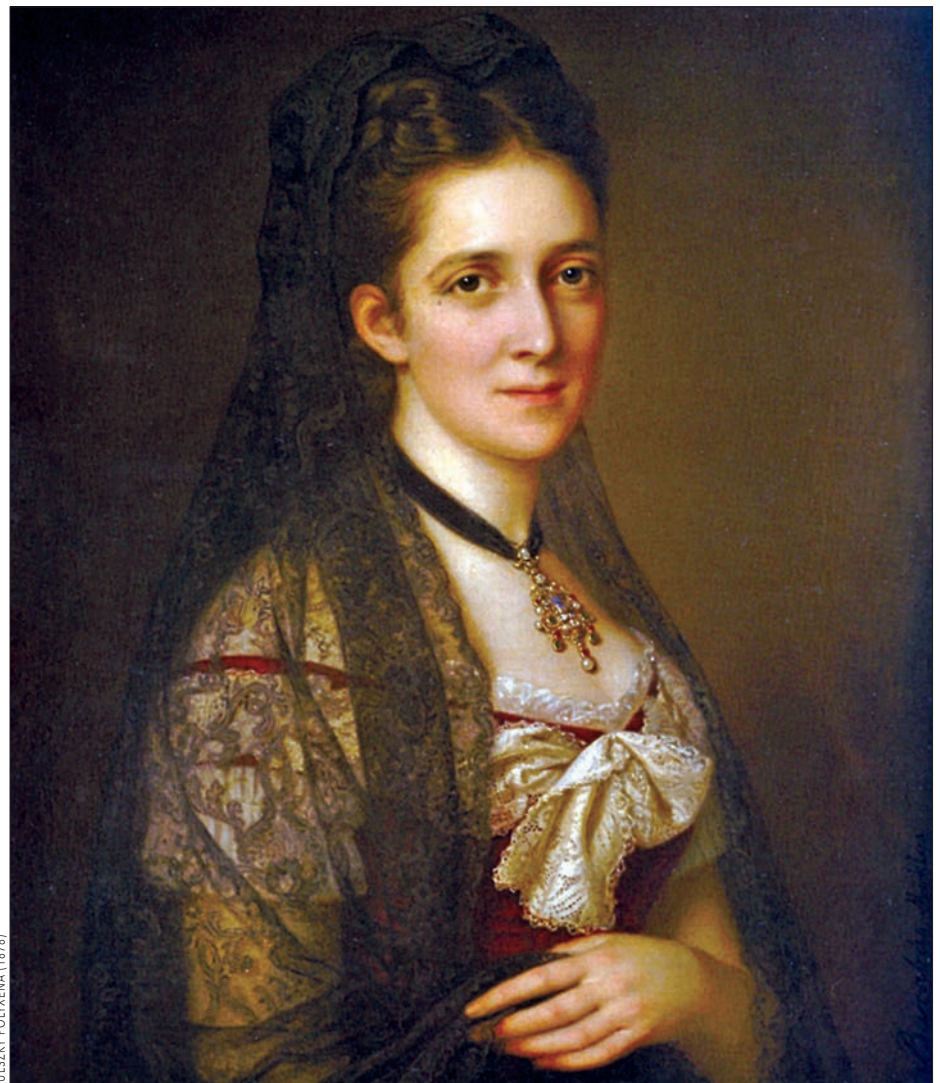
PULSZKY POLYXENA (1878)