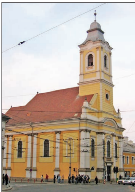
A kolozsvári evangélikus templom

Kiemelt eseménynek számít az ünnepi közgyűlés, a nyár folyamán tartandó jubileumi lelkézszentelés, illetve a lelkészi eskük ünnepélyes megerősítése, szeptemberben pedig Kolozsváron átadják a felújított Protestáns Teológiai Intézet, valamint további öt tanintézet korszerűsített épületét. A kincses városban avatják fel az emlékévé keretében Szász Domokos református püspök szobrát, a Bocskai téri Erdélyi Református Múzeumban pedig a reformációról szóló kiállítást lehet majd megtekinteni. Ezenkívül közös ünnepi zsinatra készül a Romániai Evangélikus-Lutheránus Egyház, valamint a két romá-