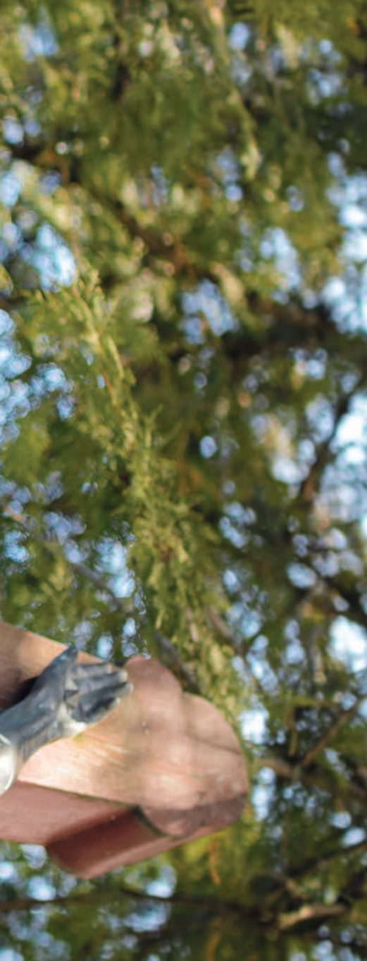
FOTÓ: KISS TAMÁS

út mentén áll a Pihenőkereszt. A folklór részeként az emlékállítás a 19. században teljesedett ki, amikor a hétvégeken virágot helyeztek el az út menti feszületnél, a búcsúk alkalmával pedig lefestették. A falukat járó fotóművész, Móser Zoltán szerint elsősorban a Palócföldön és Göcsejben, Erdélyben pedig a székelyeknél – például Korondon – állították a legtöbb keresztet. Útkeresztzódésekben és a falvak határában. Pléhből, kőből és fából készült a legtöbb Krisztus, amelyet aztán a kommunizmus éveiben eltüntettek, s a földdel tettek egyenlővé. 1989-től, a rendszerváltozást követően kezdték ismét visszaállítani őket.