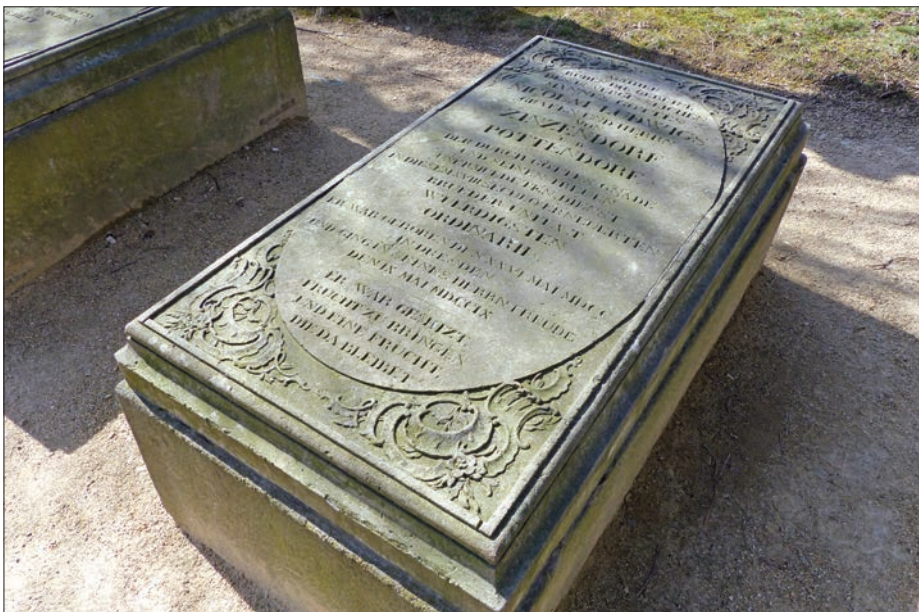
Zinzendorf gróf síremléke a herrnhuti temetőben