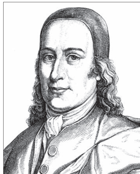
Nikolaus Ludwig Zinzendorf gróf

A hatalmas szervezőmunkával párhuzamosan Zinzendorf folyamatosan képezte magát, elvégezte a teológiát (evangélikus lelkésszé, később pedig püspök-ké is szentelték). De mindeközben 1727.