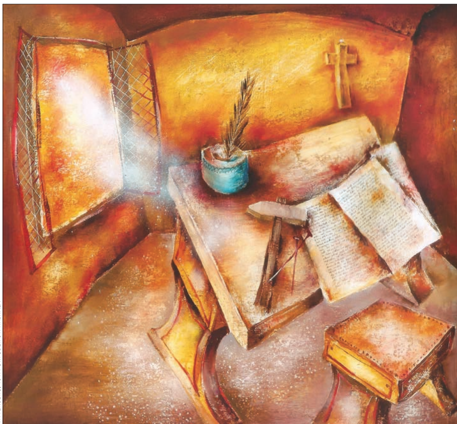
WITTENBERG, 1517. OKTÓBER 31. HAJNALA