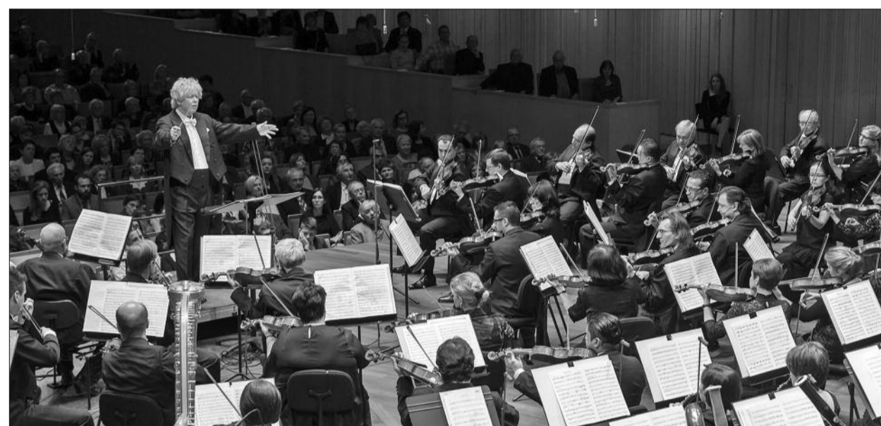
Kocsis Zoltán vezényelte a Nemzeti Filharmonikus Zenekart

Az Evangélikus Élet magazin április 3-i számában Szokolay Sándorról írott riportunkban a zeneszerző egyebek mellett így vallott: „Egyszer azt mondtam, hogy Bach zenéje nekem olyan, mint az imádság. Bach volt és maradt a kedvenc zeneszerzőm.” ■ KÓ ANDRÁS