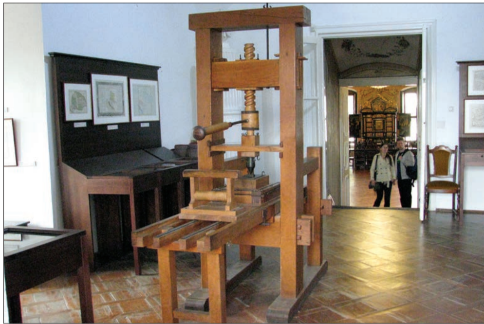
Die rekonstruierte Sylvester-Druckerei im Nádasdy Museum