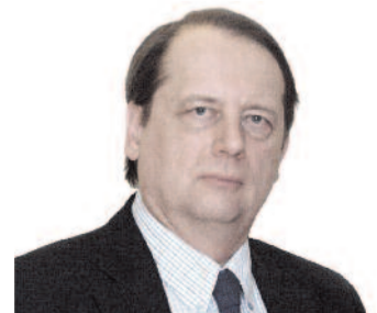
Gáncs Péter püspök Déli Egyházkerület

Ennek szükségessége nem attól függ, hogy van-e rá igény, kereslet, piac. Jeremiás óta tudjuk, tapasztaljuk, hogy Isten élő és ható igéje perzselő tűzzé válik a szívünkben, amelyet nem hallgathatunk el. Pál apostollal együtt valljuk: „Jaj nekem ugyanis, ha nem hirdetem az evangéliumot!” (1Kor 9,16) Ebből a pünkösdi szikrából lobbant lángra a reformáció tüze 1517. október 31-én, és éghet tovább ma is bennünk, általunk és közöttünk.