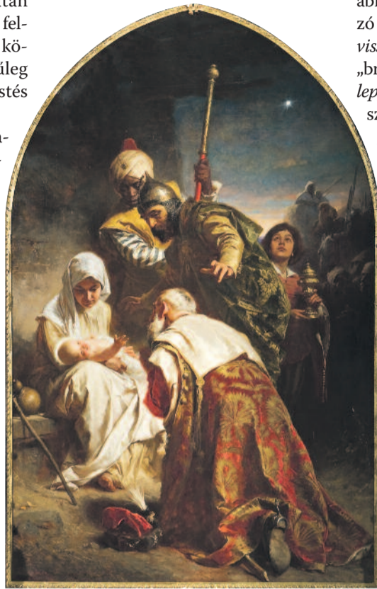
Benczúr Gyula: A napkeleti bölcsek hódolata címmű festménye – Fotó: Horváth Zoltán

Hazafiságát, hazaszeretetét mi sem jellemzi jobban, mint hogy ami-