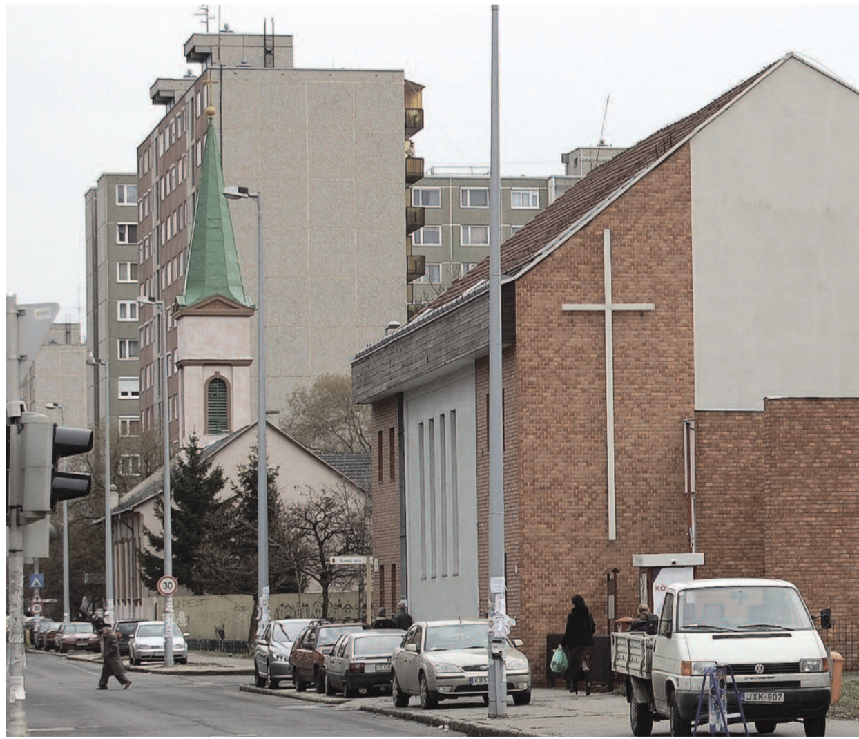
A baptista imaház mögött az újpesti evangélikus templom