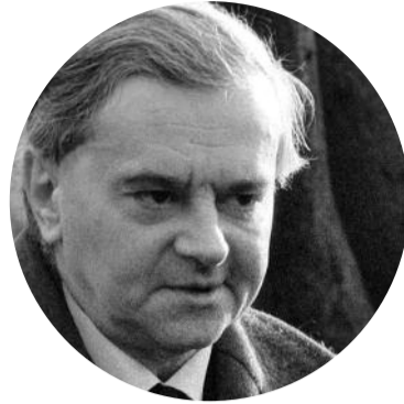
WEÖRES SÁNDOR 100

Az esti műsor Az ég-sapkájú ember címet kapta, utalva a költő versére: „Akinék azt mondják: »rosszkor születél, / kotródj az anyád méhébe vissza«: / e vérzattata kapun nem dönget, / az csak egyszer nyílt, zárva ta-