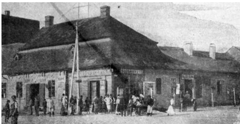
Benczúr Gyula szülőháza Nyíregyházán 1900-ban