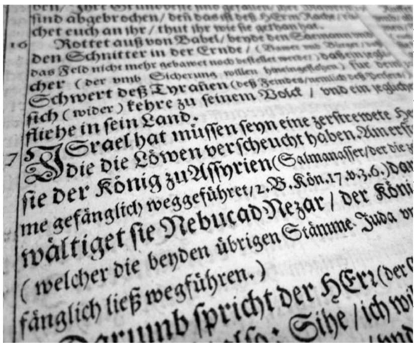
OLDALRESZLET LUTHER BIBLIÁFORRÁSÁNAK 47. SZÁZADI KIADÁSÁBÓL

A szerző egyháztörténész, egyetemi tanár, az Evangélikus Hittudományi Egyetem Egyháztörténeti Tanszékének vezetője