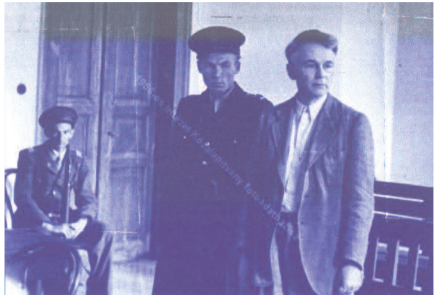
A halálos ítélet felolvasásakor

A kézbesítői feladatot nyugdíjasként is végezte. A városban sokfelé járva, munkája közben a gyülekezetet betegeit is látogatta. Legelső betege egy tőből amputált lábú nő volt a Petőfi Sándor utcában. Azontúl mindenkit,