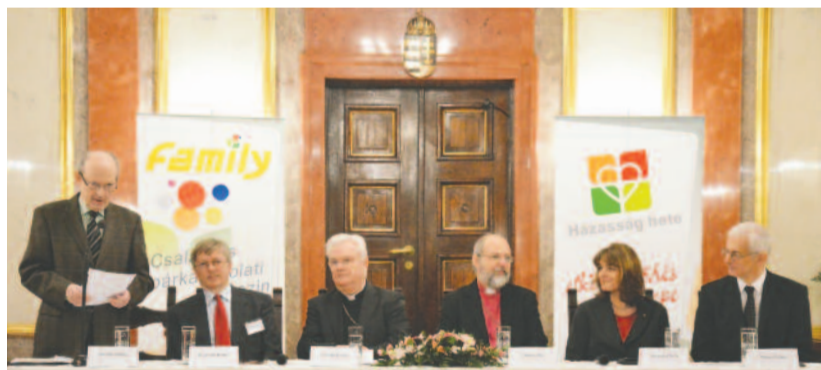
Pillanatfelvétel a házasság hetének sajtótájékoztatójáról

Elhangzott Pécssett a házasság hete egyik rendezvényének keretében a Pécsi gospelkórus koncertjén – két részletben