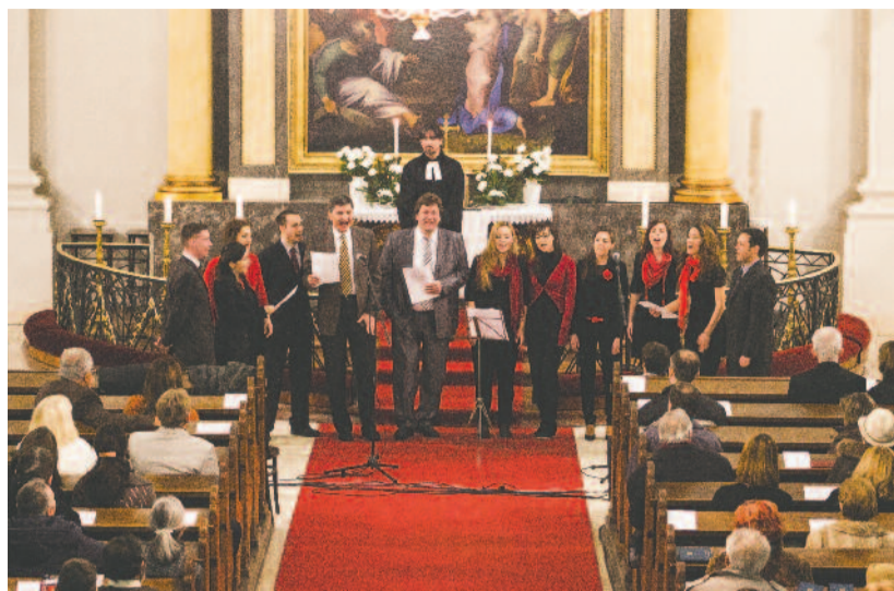
A Boyzless Voice és a High5 közös szolgálata a Deák téri templomban

► Sárospatakon református istentisztelettel kezdődött, az elmúlt vasárnap pedig a budapesti belvárosi katolikus templomban ünnepi szentmisével záródott hivatalosan a házasság hete február 9–16. között tartott programsorozata. A felekezeti szervezőbizottság tagjai még csak most kezdik értékelni az idei esztendő tapasztalatait, gyűjtik össze az ország-szerte tartott rendezvények beszámolóit. Azt azonban már most lezögezték, hogy sokkal nagyobb médiafigyelem övezte az eseményeket, mint az előző hat évben.