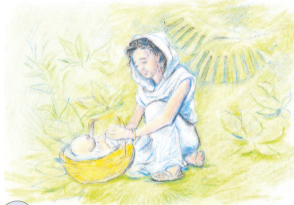
Mózeset az anyukája egy gyékénykosárban elrejtja a sás közé a Nilus partján