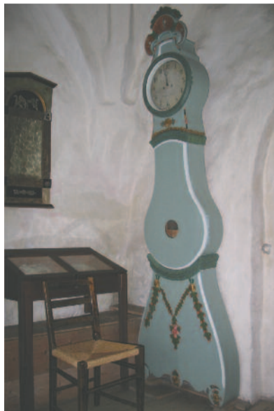
Állóóra Alnö öreg templomában