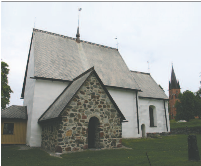
2012-es adjunktusi – azaz beosztott lelkészi – szolgálatom helyszíne Alnö szigetének öreg (1100 körül épült) temploma volt, amelynek belső festése a 14. századból maradt meg. Háttérben az „új templom”.