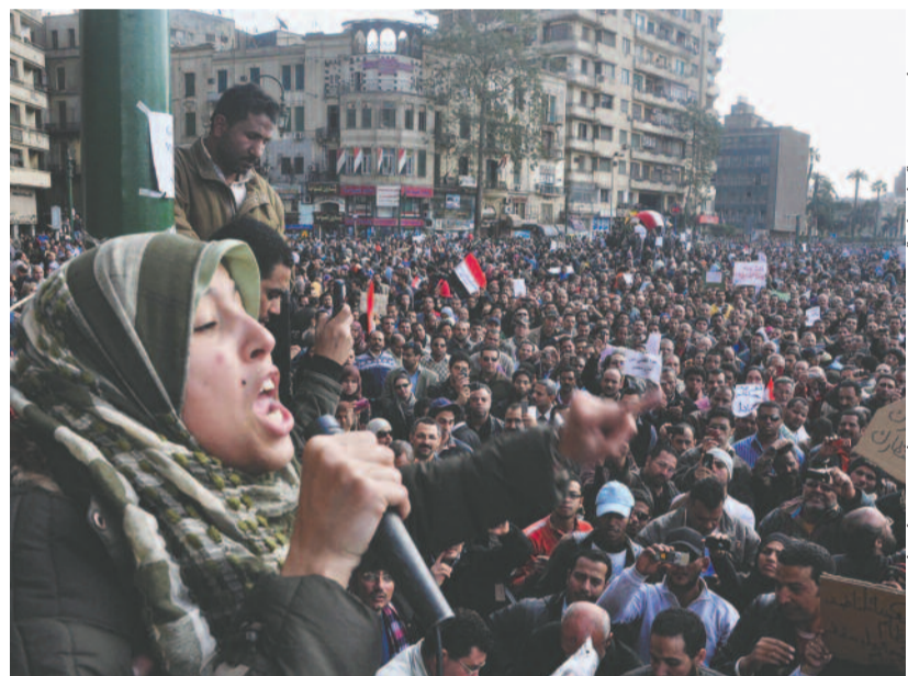
AZ ILLUSZTRÁCIÓK FORRÁSA: AZ IMANAPOT ELŐKÉSZÍTŐ BIZOTTSÁG

szomszédos országokban dolgoznak vendégmunkásként. S bizony a Nílus éltető vizének használata is komoly nehézségekbe ütközik.