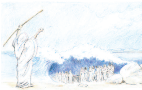
Átkelés száraz lábbal a szétnyílt Vörös-tengeren