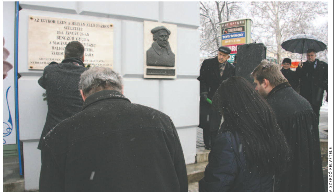
Az emléktábla megkoszorúzása

Benczúr Gyula kiemelkedő munkásságát hosszan lehetne sorolni. A magyar történelmi festészet és portréfestészet kiemelkedő alakjára a fennkölt és a technikai bravúr a legjellemzőbb, illetve stílusában az alázat