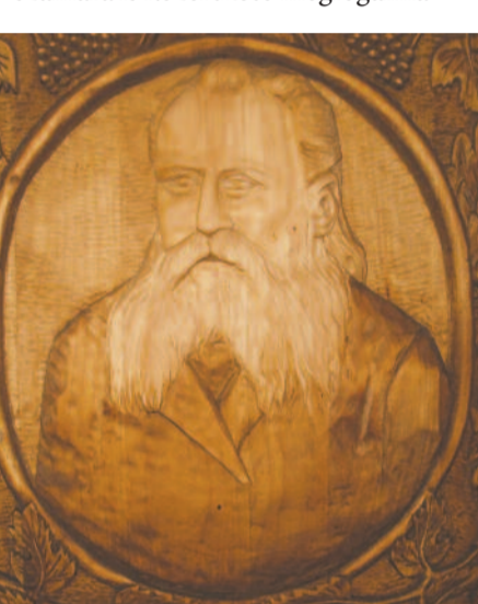
FARAGOTT HERMAN-PORTRÉ (SOMOGYFAJSZ, KUND-KASTÉLY)

Ornitológiai alapműve, A madarak hasznáról és káráról eredetileg 1901-ben látott napvilágot. Tartalmas kötet, a szélesebb olvasóközönség számára is közérthető megfogalmazással, több generációnak is ismerős ábrákkal. A könyv újjászületését a 2012-es esztendő hozta meg. A hamar népszerű vált Nemzeti Könyvtár sorozat keretében került megnyerő külsejű reprintként a könyvesboltok polcaira. Nagyméretű formátuma, kemény kötése és nem utolsósorban a mai gazdasági viszonyok mellett ténylegesen elérhető, 2500 forintos ára igazi könyvcsemegévé tette.