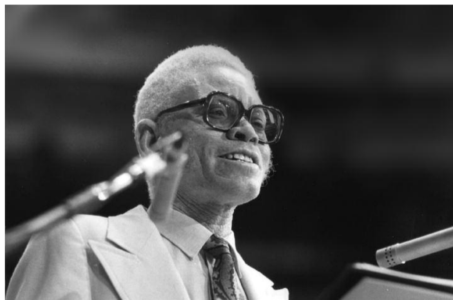
Zephania Kameeta az 1984-es budapesti nagygyűlésen

A függetlenség elérése óta felnőtt fiatal lelkészgenerációnak már más az attitűdje. A vezetőikkel szinte naponta meglátogatjuk egymást. De lassan nyugdíjba vonulunk – nyitott kérdés, hogy az utódaink folytatják-e ezt a kapcsolatot.