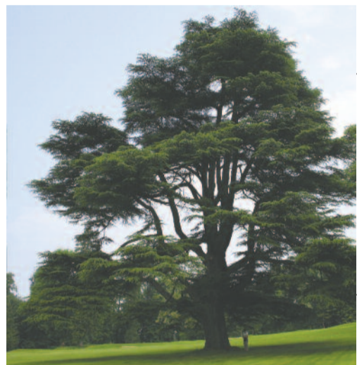
LIBANONI CEDRUS

„Jaj annak, aki a fának mondja: Ébredj! – és a néma kőnek: Kelj föl! Adhat ez útmutatást? Arannyal, ezüsttel van ugyan borítva, de semmilyen lélek nincs benne! Az Úr azonban ott van szent templomában: csendesedjék el előtte az egész föld!”