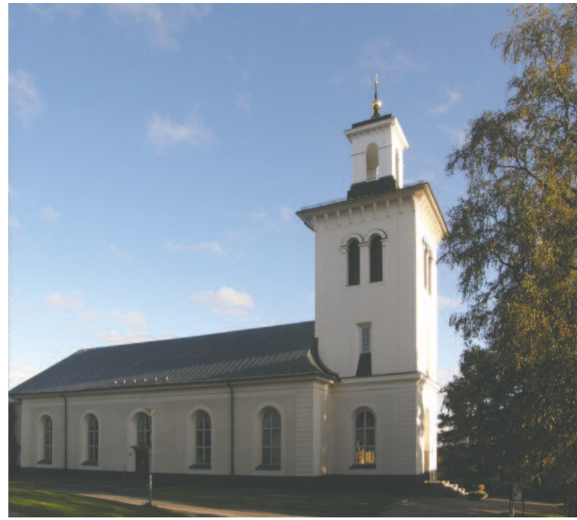
Hässjö – a háromfalvas pastort (egyházközség) legnagyobb temploma

Tynderö templomában tavaly több keresztelóm és esküvóm volt, mint ahány istentisztelet. Sajnos már itt