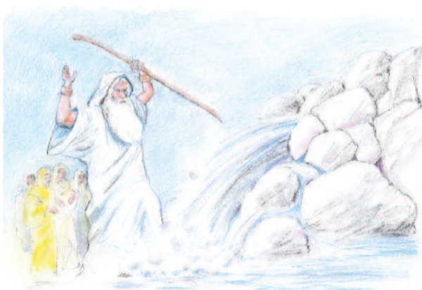
Mózes vizet fakaszt a sziklából

▶ Az alábbi képek egy-egy jelenetet ábrázolnak Mózes életéből. Az események egy kicsit összekeveredtek. Számozzátok be őket időrendben!