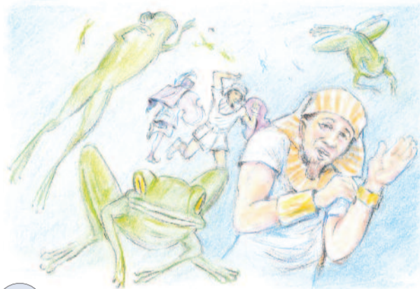
Második csapás: a békák