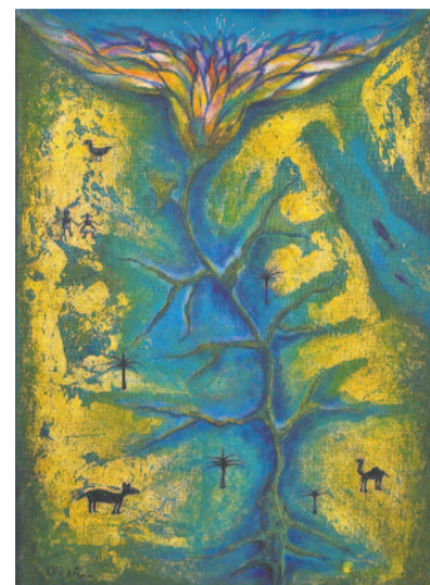
AZ IMANAPOT ELŐKÉSZÍTŐ BIZOTTSÁG FESTMÉNYE

▶ Az idei világimanapot előkészítő cikkekben többet foglalkozunk az istentisztelet liturgiáját összeállító keresztény asszonyok életkörülményeinek feltárásával, mint azzal, hogy országuk földrajzi adottságait, gazdag történelmét bemutassuk. Már csak azért sem törekszünk erre, mert Egyiptom sokak számára ismertebb, mint a tavaly élénk került Franciaország... Bizonyára sokan emlékeznek még iskoláskorukból a történelemlétkönyvük első lapjain eléjük táruló rendkívüli látványra: a bebalzsamozott múmiák fotóira, a fáraókkal együtt eltemetett temérdek kincsre, a Nílus menti öntözéses földművelést szemléltető ábrákra. De a modern Egyiptom, Kairó forgalmas utcái sem ismeretlenek sokak előtt. Szinte minden gyülekezetünkben rábukkanhatunk olyan testvérekre, akik nyári utazásuk célpontjául épp a piramisok földjét választották. Bizony még néhány éve is kedvelt turisztikai célpont volt a Közél-Kelet gazdaságilag legstabilabb országa, ahová a környező arab országokból is szívesen mentek dolgozni.