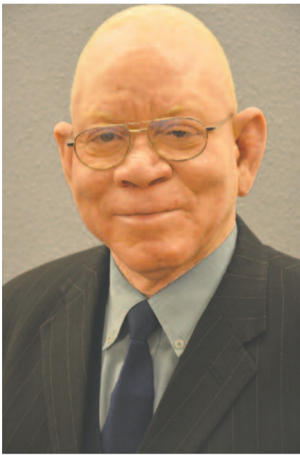
Kameeta püspök a genfi tanácskozás színterében.

A 2017-es nagygyűlést előkészítő bizottság javaslatot tett a nagygyűlés témájára: „Isten kegyelméből szabadon”, az altémák pedig: „A megváltás nem bocsátható áruba – Az ember nem bocsátható áruba – A teremtés nem bocsátható áruba.”