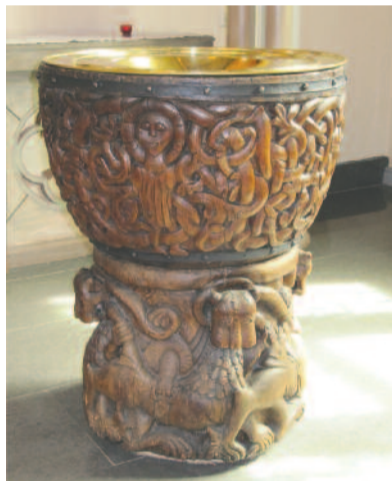
A több mint ezeresztendő dopfund

Åstön szigetének egyik csücskében, Skeppshamn kikötőjében áll az 1768-ban épült halászkápolna, melynek elődjét a gävlei halászok céhe építette még 1567-ben. Itt június elejétől augusztus végéig főleg esküvők, keresztelők és a szigeten gyakori nyári ünnepek alkalmán szolgálunk, valamint az egyetlen téli alkalommal: Szil-