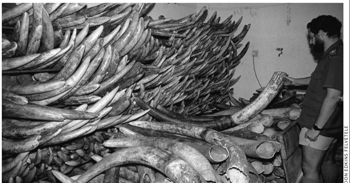
Afrikai elefántagyarok – nem bocsátható áruba?

A világszövetség tanácsstagjaként elsőként értesültem a nagygyűlés meghívásának lehetőségéről. Az otthoniak először azt hitték, tréfálok.