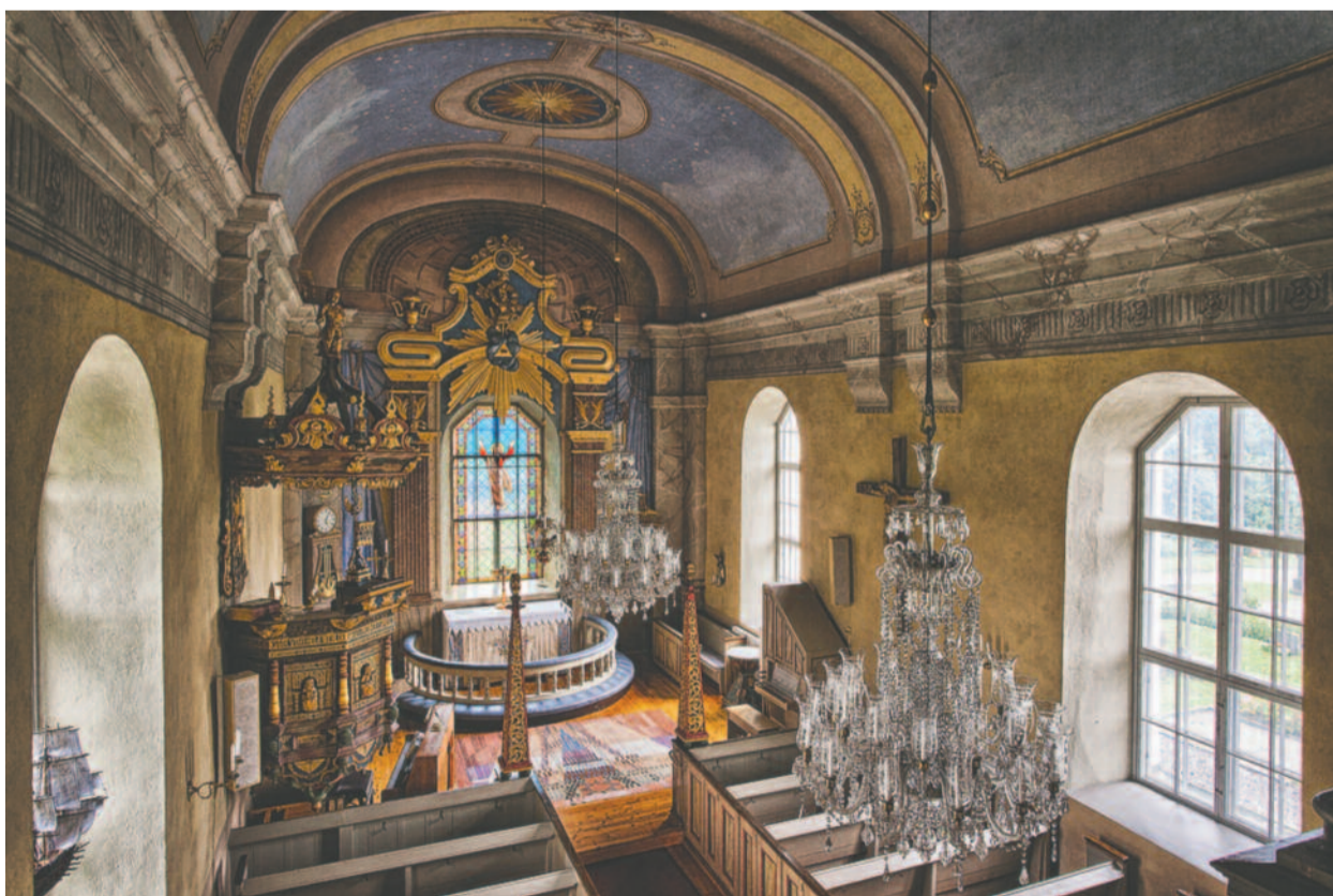
Míves magyar csillárok Tynderö templomában

éreztem, mintha megboldogult Gusztáv Adolf király krisztusi kereszteléként zászlót lengető karjára támaszkodtam volna!