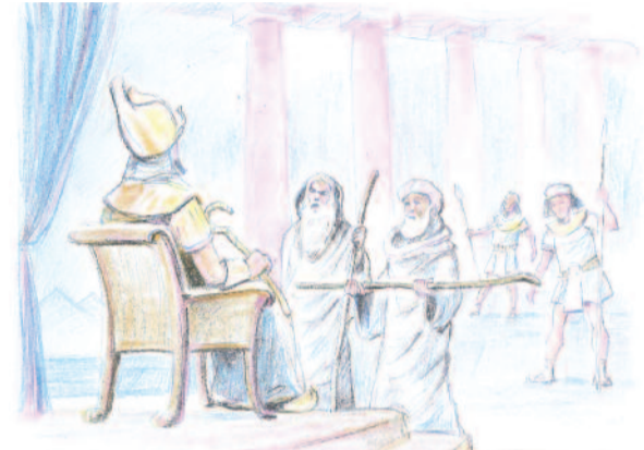
Mózes és Áron a fáraó előtt áll