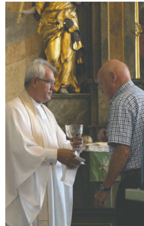
A szerző úrvacsorát oszt Ljustorp templomában

Tynderö egykori népe halászból élt; erre a jogot a királyaitól kapta. E szerencséjüket nyugtázta a helyi halászcéh azzal, hogy egy pompás két-árbcosnak a makettjét ajánlotta föl mint áldozati ajándékot ( Votivskepp ) a gyülekezetnek. Ilyen hajókat gyakran látni a part menti települések kápolnáiban, így Sundsvallban, a belvárosi Gusztáv Adolf-templomban is.