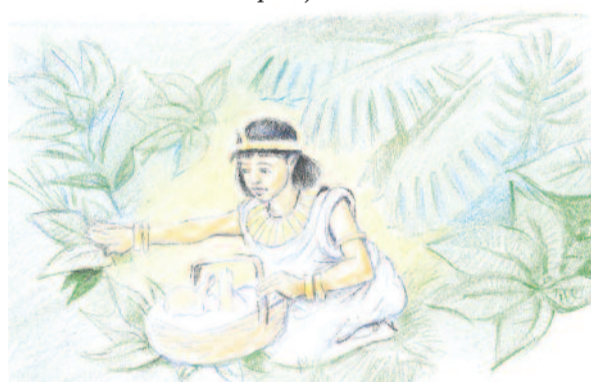
A fáraó lánya megtalálja Mózeset