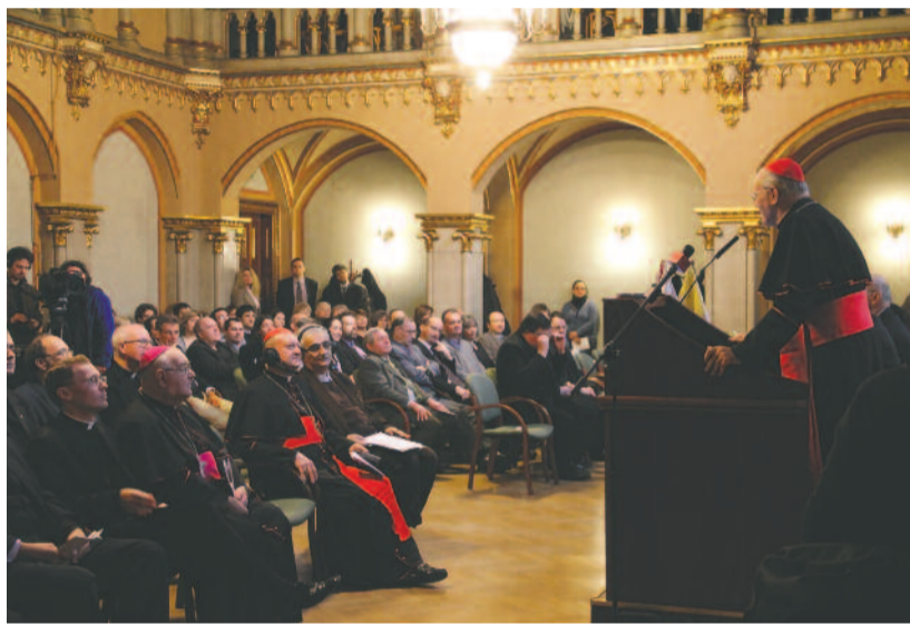
Erdő Péter bíboros köszönti a konferenciát

kénytelenek a következményeket hordozni, mint a gazdagok. „Súlyos következmény az európai fiatalok közötti munkanélküliség; szívemarkolóak az adatok” – állapította meg az előadó.