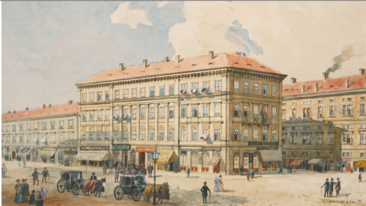
MIRKOVSKY GEZA AKVARELLE

Isten élő Lelke, jöjj! ▶ 2. oldal A koporsótól a bölcsőig ▶ 3. oldal Interjú egy tamil misszionáriussal ▶ 4. oldal Orgonaszentesítés Kővágóórsön ▶ 5. oldal Nagyhét zenéje ▶ 7. oldal A Föld órája – évente hatvan perc? ▶ 15. oldal