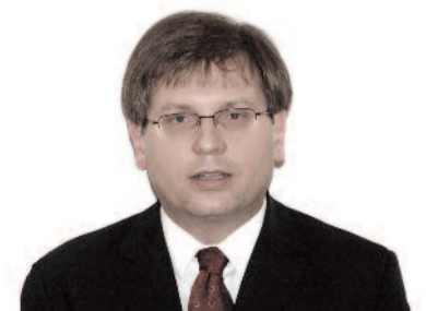
Fabiny Tamás püspök Északi Egyházkerület

Hazaindulás előtt meglátogatom őket barátságosan berendezett rusz- tikus kis házukban. Látszik, hogy Mitja sok mindent saját kezűleg ké- szített. Hamarosan alighanem egy egészen különleges bútort is össze kell állítania: egy bölcsőt. Hiszem, hogy ez jelképerője. Isten nemcsak az ő kis családjukat akarja megáldani, hanem az egész muravidéki evangélikusságot is. Isten, áldd meg a magyart. És a ven- det, szlovént s minden népet.