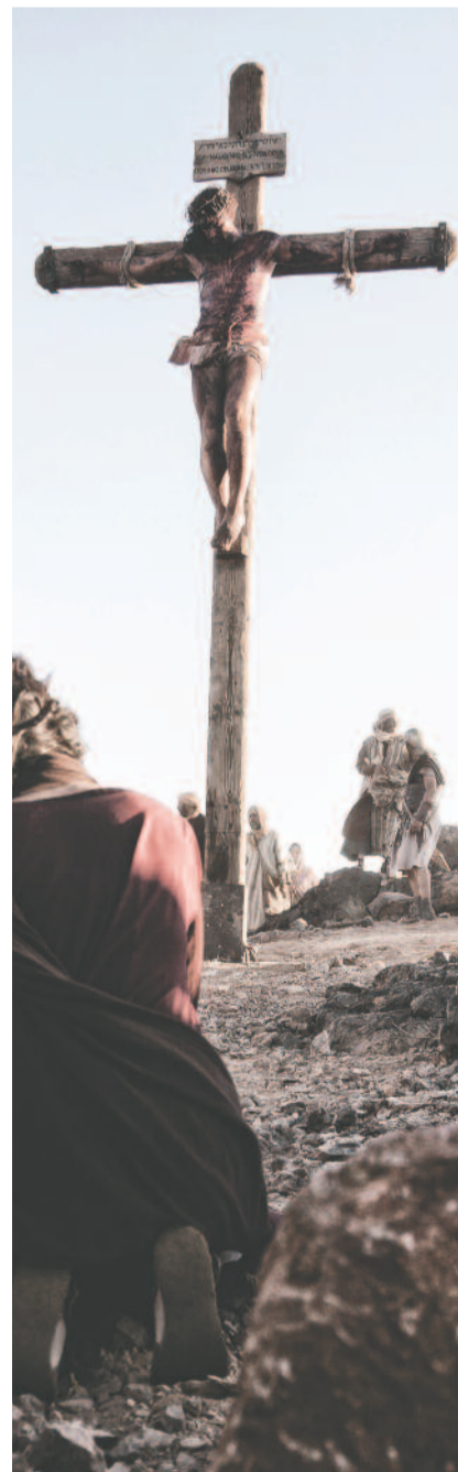
Oldalpárunk illusztrációi a hazánkban április 10-étől látható, Isten Fia című amerikai film jelenetfotóinak felhasználásával készültek.