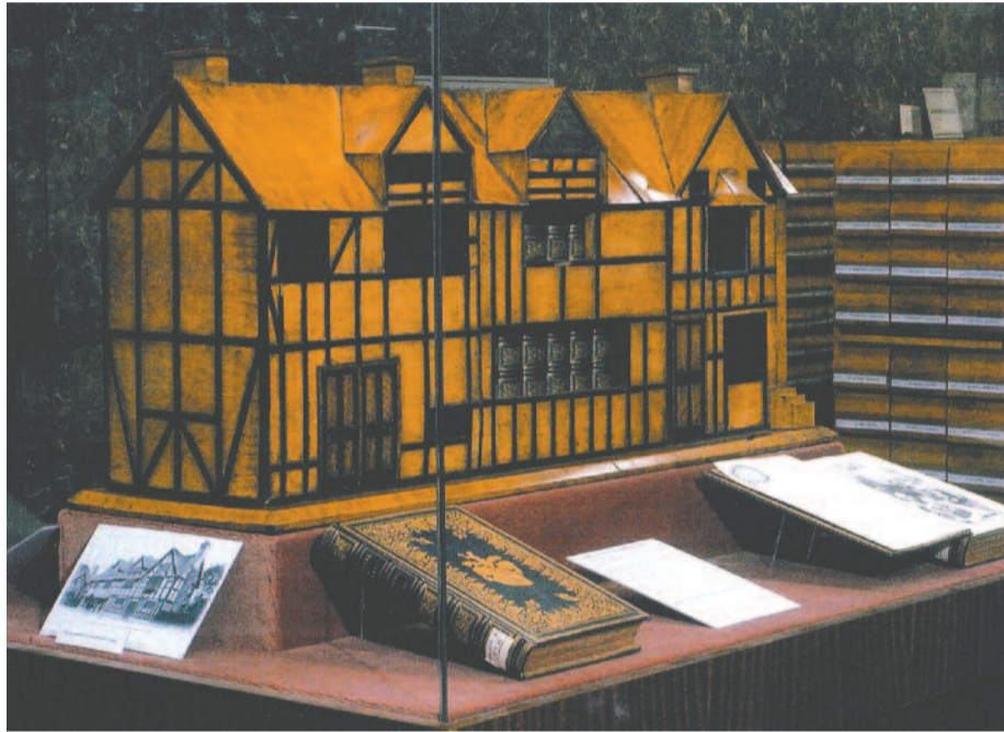
Shakespeare szülőházának makettje, amelyet Kossuthnak ajándékoztak

A pesti Shakespeare-szobor megszületéséhez és „működéséhez” az evangélikus egyház és iskolák jelentősen hozzájárultak. Remélhetően az idén április 23-án, szerda délelőtt