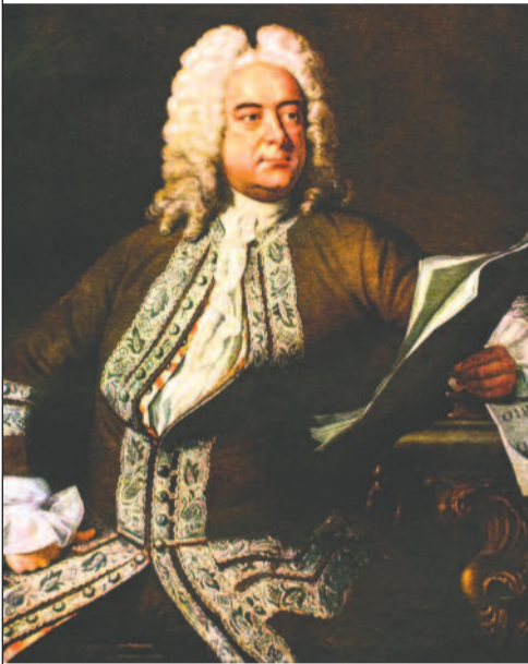
THOMAS HUDSON FESTMÉNYSZE

Händel élete a Saale folyó mellett fekvő Halle városában indult: bár a fiú zenei érdeklődése korán megmutatkozott, borbély-seborvos apja jo-