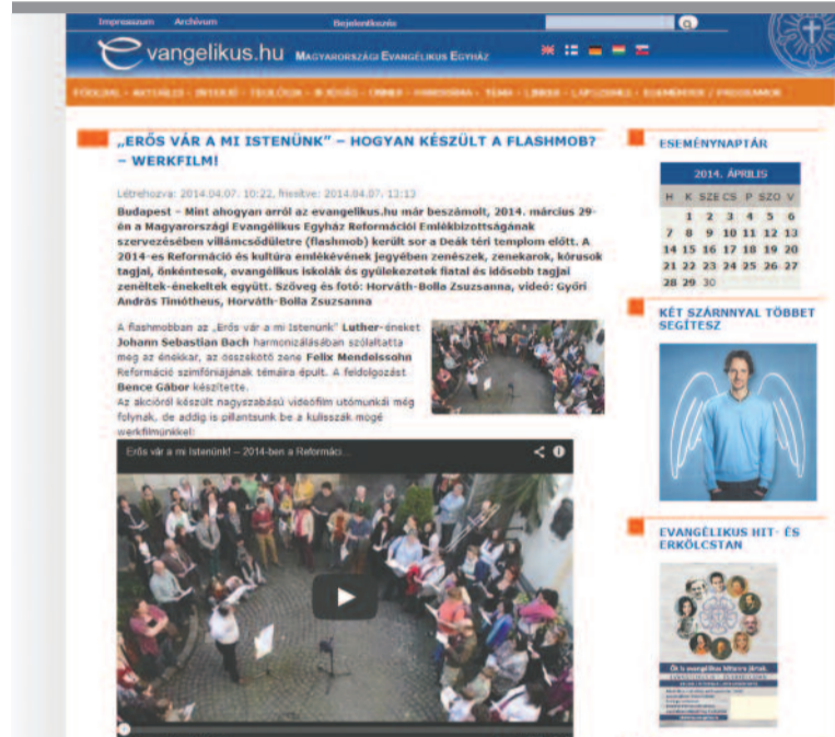
AZ EVANGÉLIKUS.HU KORÁBBI TUDÓSÍTÁSA A FLASHMOBRÓL