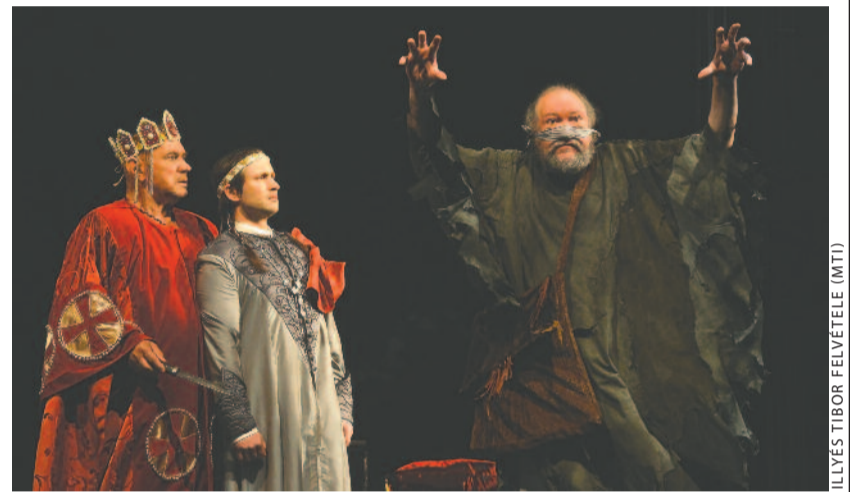
Gyula fejedelem (Koncz Gábor), Vajk-István (Jánosi Dávid) és Bönge (Nagy Zoltán) szuggesztív magyarázat közben

Nyilván a dráma szöveggönyvét követve történik mindez így a színpadon, mégsem vehetők komolyan a gyilkosságok (sem). Géza fejedelem például nem tudja nem megdicsérni