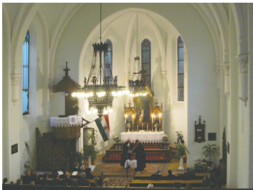
Koncert az evangélikus templomban