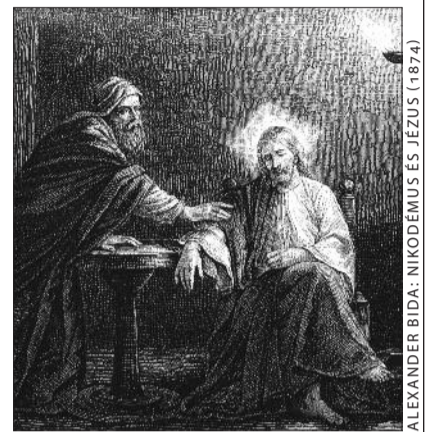
ALEXANDER BIDA: NIKODÉMUS ÉS JÉZUS (1874)

A beszélgetés résztvevői saját foglalkozásukkal kapcsolatban fejtették ki, hogy számukra az miért valóságos hivatás, miért nem, „csak” munkavégzés. Hegedűs Attila rávilágított arra, hogy a hivatás szóban benne van az