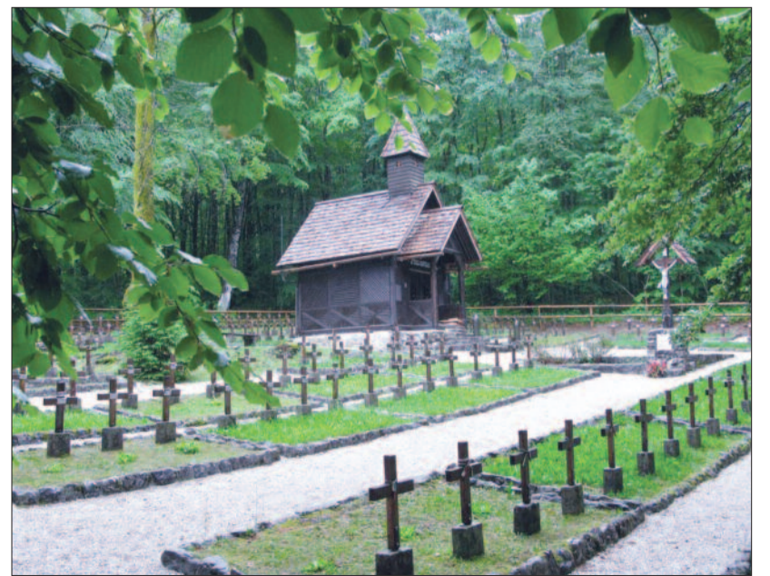
Az isonzói csata áldozatainak hősök temetője Szlovéniában (Ukanc)

Elhangzik augusztus 3-án a Kossuth rádió Vasárnapi újság című műsorának Lélektől lélekig rovatában.