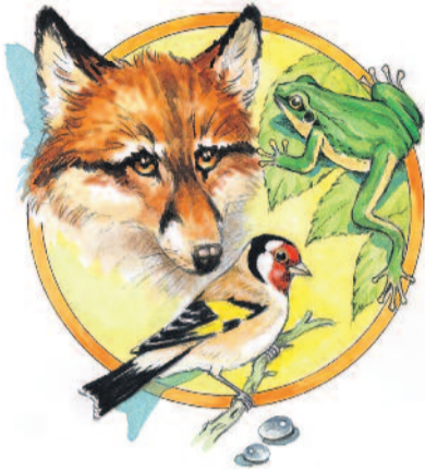
MESÉLNEK AZ ÁLLATOK

A megtermékenyített nőstények áttelelnek, majd tavasszal ők kezdik el építeni a fészket tágas faodúokban,