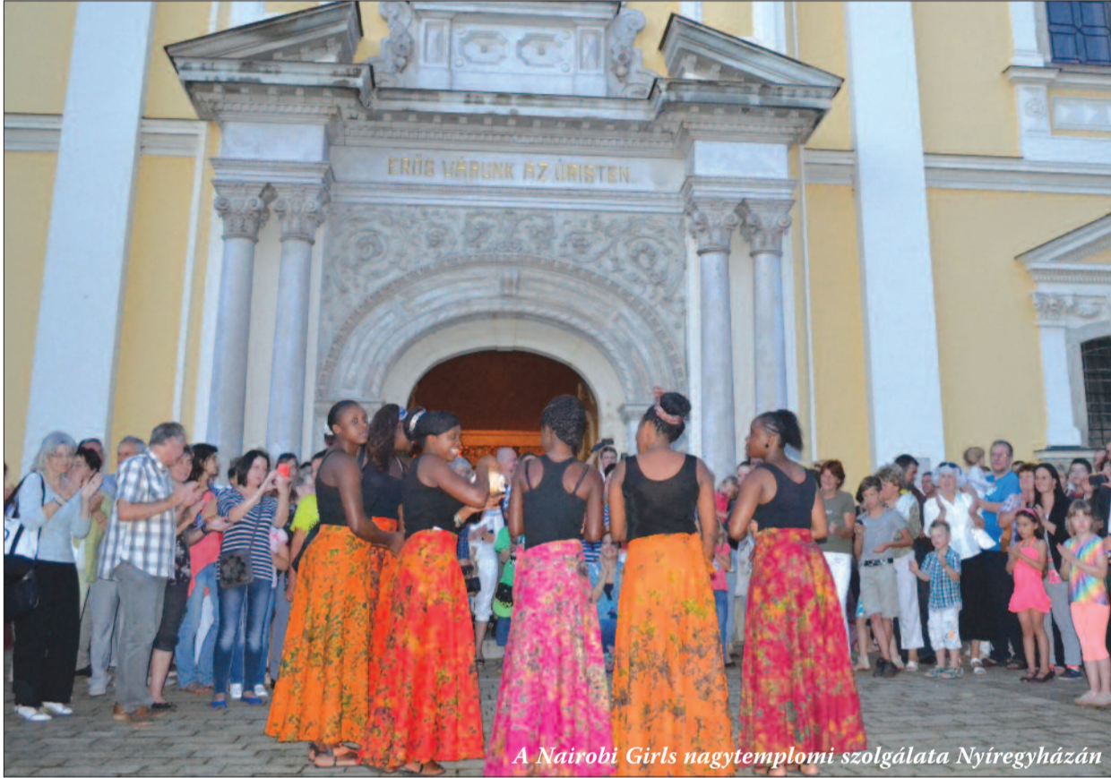
A Nairobi Girls nagytemplomi szolgálata Nyíregyházán