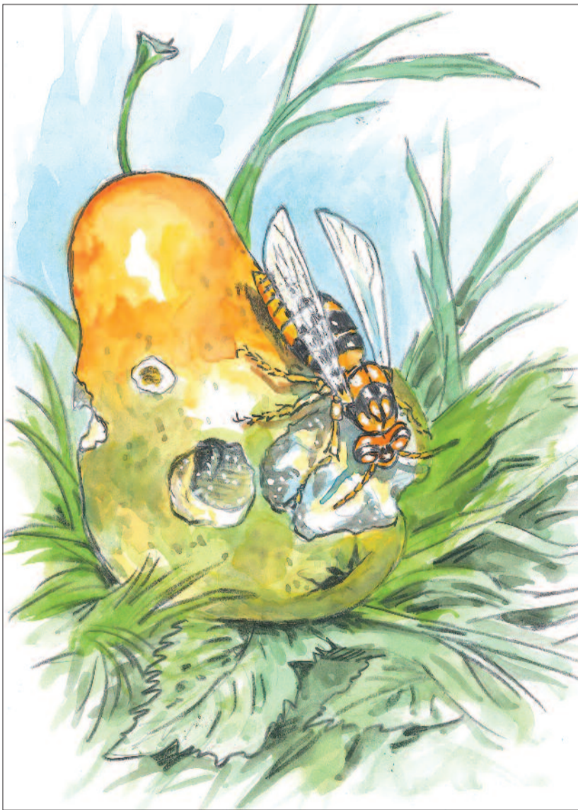
RAJZ: BUDAI TIBOR

padlásokon. Az elkészült fészkek sejtjeibe rakják a petéket. Az ezekből körülbelül tíz nap alatt kikelő lárvákat kezdetben gyomorvadászokkal, majd pókokkal, rovarokkal etetik. Aztán ahogy erősödik a család, a fészkek építésének és a lárvák gondozásának a munkáját a dolgozók veszik át.