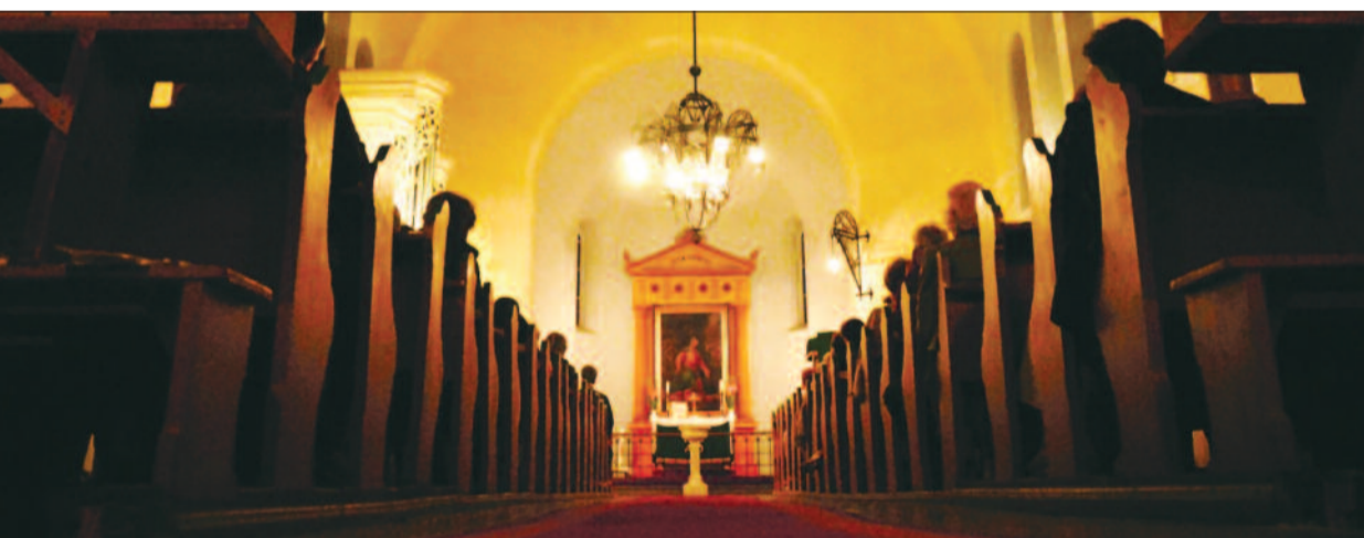
CEGLÉDI TEMPLOMBELSO

A tárlat öt könnyen fölállítható tablóból áll, melyek oktatási célra is használhatók történelem-, magyar-, osztályfőnöki, illetve egyéb, akár fakultációs, felső tagozatos és gimnáziumi órákon. A tanároknak segédanyagként szolgál a Megkésétt iskolai találkozó című CD-ROM, amely egy óbudai izraelita iskola történetét dolgozza fel. (Gombocz Eszter: Megkésétt iskolai találkozó / Späties Klassentreffen. Az Óbudai Izraelita Elemi Iskola története 1920-tól 1944-ig . Holokauszt Közalapítvány, Goethe Intézet, 2010.) A kiállításához feladatgyűjtemény is készül (a 14 és 18 év közötti korosztály számára), amely az órai munkát segíti majd az interaktív módszerek alkalmazásával.