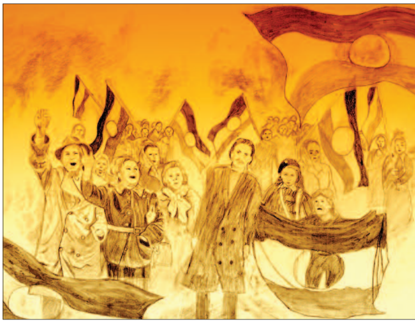
KUN ÉVA (EVANGÉLIKUS) GRAFIKUSMŰVESZ RAJZA

In memoriam 1956. Tízéves fiúcska voltam, mégis éreztem és értettem 56 gyönyörű forradalmát. Perzselő lángja, hunyó parazsa egész életemben melengtetett. Ma is emlékszem arra az elmondhatatlan boldogságra, amely az embereket ölelte, és eltüntette a félelmet.