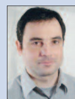
Evangelikus istentisztelet a Kossuth rádióban

1886-ban az egyházközség két tantermes iskolát épített, ahogy az iskola faláról az 1960-as években kibontott, de megmentett és a gyülekezeti terem előterének falába beépített tábla hirdeti: „A kispécsi és kajári evang. egyesült gyülekezet népiszkolája, 1886.” Az intézményt 1948-ban államosították, majd miután az iskola egésze Kajárra költözött, a régi