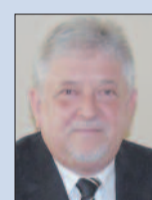
Evangelikus istentisztelet a Magyar Televízióban

1911-ben merész elhatározással az egyházközség bérház építésébe kezdett. Felmérték, hogy a gyülekezet életben maradásához biztosítani kell a gazdasági feltételeket, s megépítet-