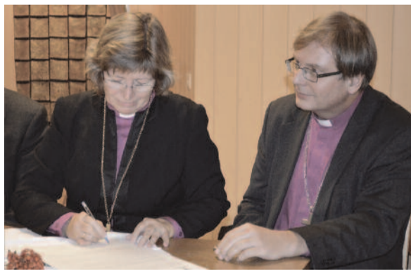
Aláírjuk az újabb öt évre szóló együttműködési szerződést

esztendővel ezelőtt partot értek az első keresztény misszionáriusok.