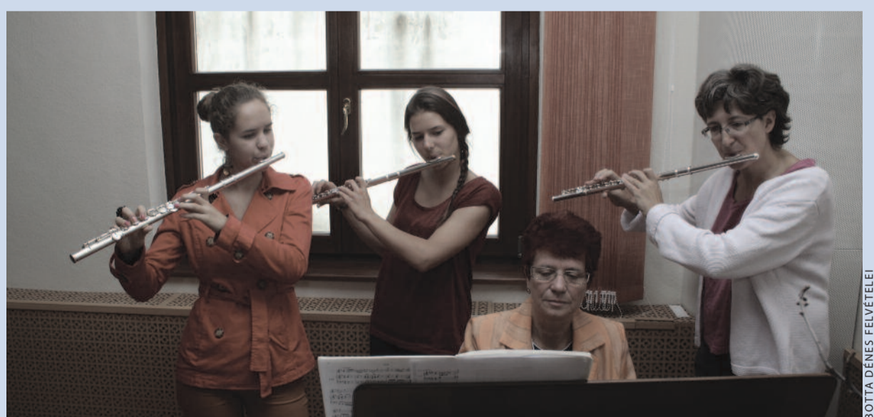
A komolyzenei szekcióban jobb szélén e sorok írója

„Klassz hely lehet az az Orosháza!” – mondták otthon a gyermekeim, mikor végre hazaértem vasárnap este. Péntek reggel láttam őket legutóbb, az otthoni hétfőre egész jól lezajlott anyai ellátásom nélkül – persze túl gyakran ne csináljak ilyet, hogy lecserélem őket tíz fasori gyerekekre. Kicsit sértő rájuk nézve, hogy öhlyezettük inkább amazokat kísérgetem a szállásról ki-be, amazokat hallgattam a nap végén, amazokkal fedeztem fel a nekünk távoli tájat. Kicsit bántó, de végül jól jártak, mehetnek máskor is! Menjek, és legközelebb is hozzak egy nagy, kerek, cifra fonású és főleg finom kalácsot! Honnan a kalács? Ahonnan az összes többi, szívét melengető jó élmény: az orosházai kedves vendégsze-