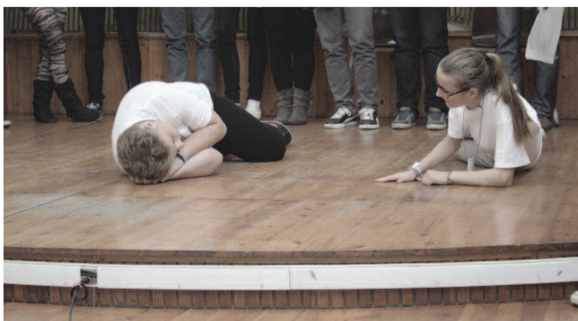
A pszichodrámacsoport egyik akciója

► Az idei EGOT-ról (evangelikus gimnáziumok országos találkozója) tudósítani „lerágott csont”, hisz a résztvevők egy része maga is azon fáradozott, hogy a szeptember 28-án – a háromnapos találkozó második napján – kézzel, lábbal, ecsettel, objektívvá vagy szubjektíven alkotó csoportok jellegzetes, jeles pillanatait megörökítse. A helyszínen, az orosházi Székács József Evangélikus Óvoda, Általános Iskola és Gimnáziumban buzgó alkalmi tudósítók és fotóriporterek jártak terepről terepre, teremről teremre. Ha az oroscafe.hu oldalon folyamatosan megjelenő rövidebb lélegzetű bejegyzések helyesírás hibáitól elvonatkoztatunk, bizakodón azt mondhatjuk: bizonyára lesz utánpótlása a helyilapunkat készítő csapatnak is!