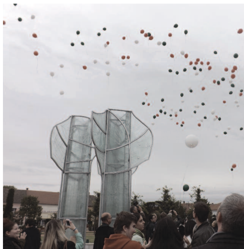
A főtéren léggömberegetéssel búcsúztak a 2013-as EGOT-tól

A „béke követői” is megtették a magukét a találkozón. Az EGOT megnyitóján Gáncs Péter elnök-püspök tartott áhítatot az ideai tanév igéje (1Jn 4,8) alapján: „... mert Isten szeretet.” A főnévből elvéve és hozzáadva is cselekvő ige lesz: Isten szeretett és szeret. Szeretete körbeölel bennünket. Az EGOT vendégeit arra buzdította a püspök: éljék át a csodát, és kapcsolódjanak be Isten szeretetének éltető vérkeringésébe!