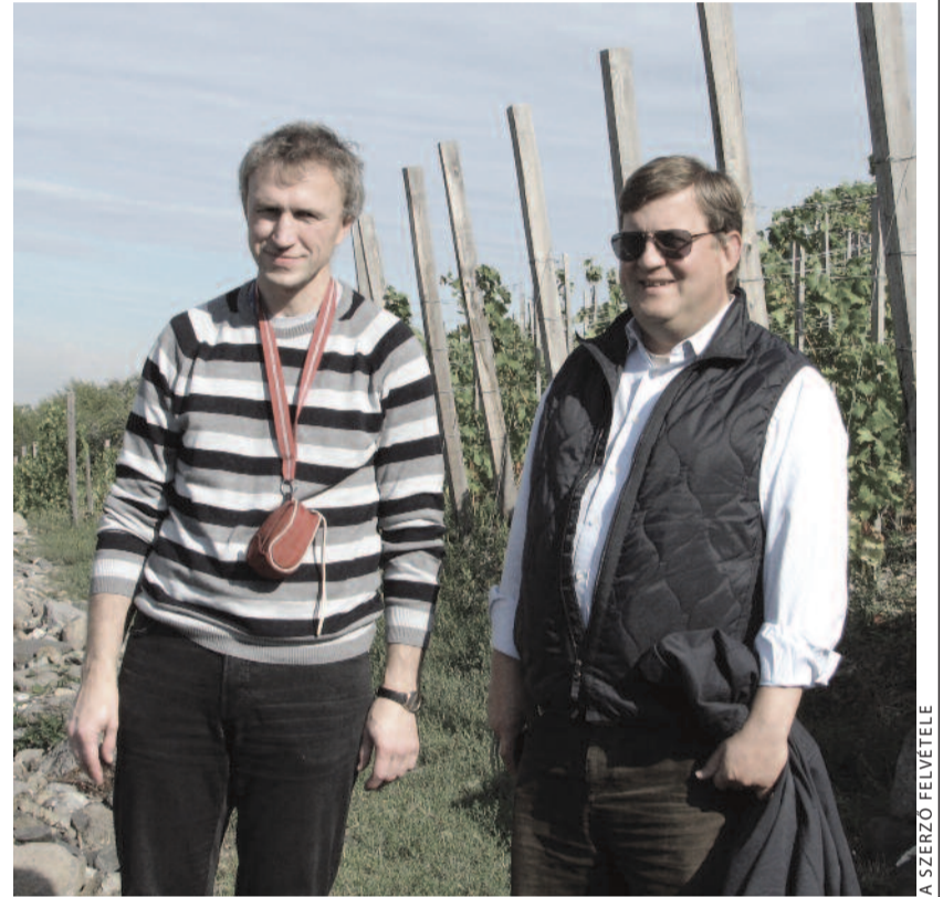
Észt lelkész vendégünk és a felügyelő (szemüvegen)

A templomi beszélgetés közben elkészült az ebéd is, melyet a gyülekezet együtt maradva fogyasztott el a fölállított sátor alatt.