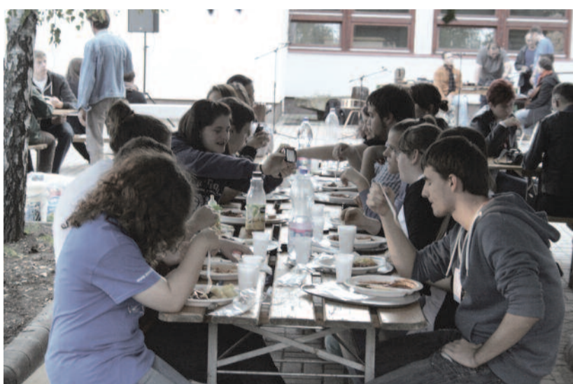
Elöl pörköltözés, hátul jobbra a Szélrózsa Band pakol