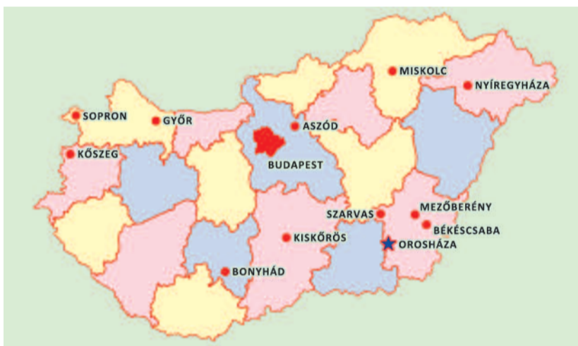
A Szélrózsa minden irányából, tizenhat evangélikus gimnáziumból érkeztek az EGOT-ra Aszód, Békéscsaba, Bonyhád, Budapest, Győr, Kiskőrös, Kőszeg, Mezőberény, Miskolc, Nyíregyháza, Orosháza, Sopron, Szarvas diákjai