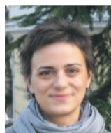
Evangélikus istentisztelet a Magyar Rádióban

Hittanoktatás és konfirmációra való felkészítés egyaránt folyik gyülekezetünkben, kisiskolás kortól egészen gimnáziumig. Heti rendszerességgel tartunk bibliaórákat, melyeken különböző korcsoportok vesznek részt. Szerdán az idősebbek, míg hétfőn az egyetemisták és a fiatal felnőttek jönnek össze. Kedden-