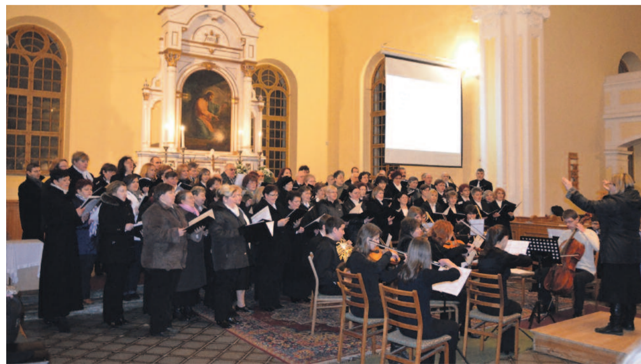
Ökumenikus ének- és zenekar a békéscsabai Kistemplomban