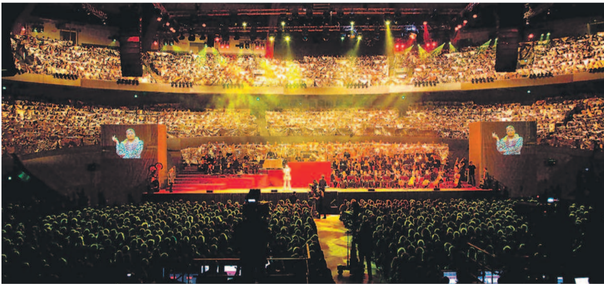
„Kicsit nagyon megtelt a mannheimi sportszarnok temploma”