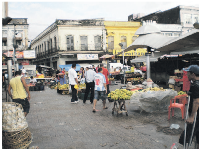
Piactér, Belem, az Amazonas torkolatánál

De nem pusztán pszichológiai-mentális módszerről van szó – imádság is kell hozzá, amelyhez hetven-négy mozgékony, utazó imacsapatuk, illetve ezerkétszáz egyházi kötődésű házi imacsoporthoz van. A transzformációs szolgálatot a huszonkétezeröt száz tagú Nemzeti Pásztori Társaság is teljes mellszélességgel támogatja. A rendőrségi állományban bekö-