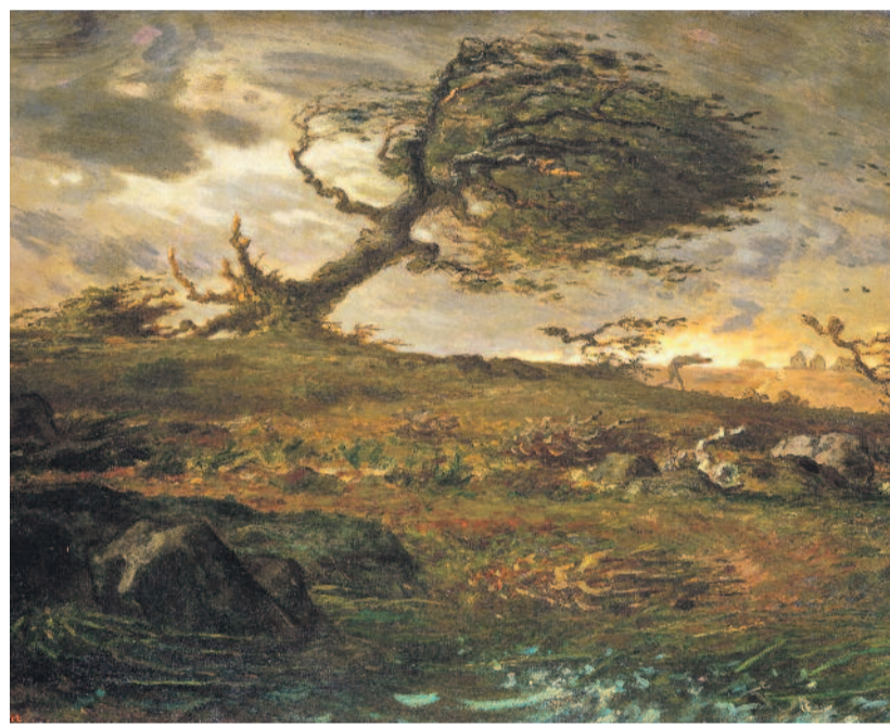
JEAN-FRANÇOIS MILLET: ORKÁN

Most nem morgott. Szó nélkül letette a szerszámot, illedelmesen