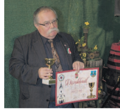
A díjátadó szerző az oklevéllel...

A kiskőrösi evangélikusok több mint tíz éve aktívan támogatják a városban élő vincelléreket: szövetkezetet alapítottak, az Iniciatíva Egyesület segítségével képzéseket szerveztek... Nemrégiben pedig díjat adtak át, ezzel is ösztönözve a termelőket minőségi bor készítésére. A különdíj neve: Az év úrvacsorai bora .