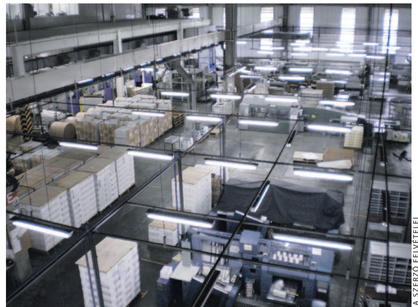
Bibliák Dél-Amerikának – a Brazil Bibliatársulat nyomdája

A szerző református lelkész, a Magyar Bibliatársulat főtíkára