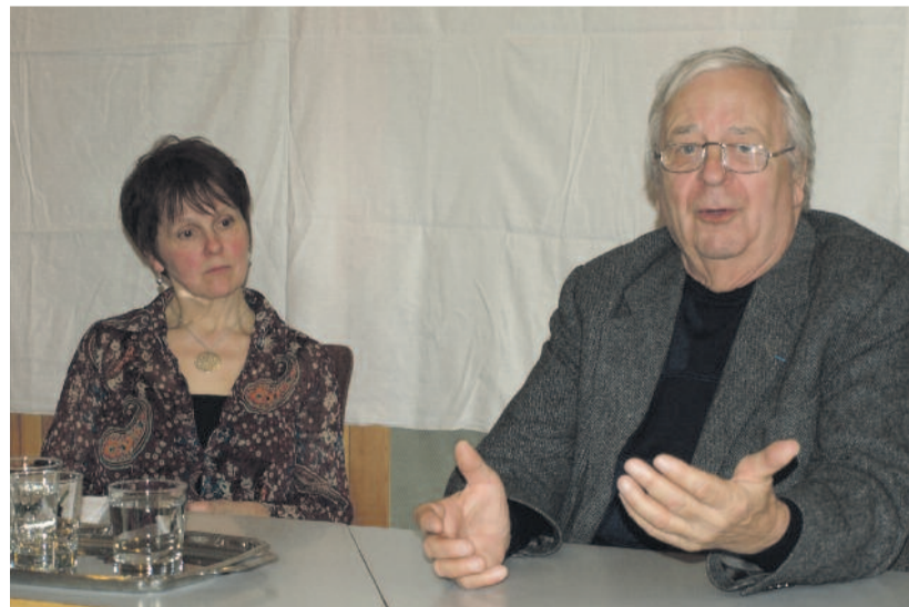
A szerző beszélgetőtársával

– Az ötvenes évek légköre nem nehezítette meg nagyon az ott folyó munkát?