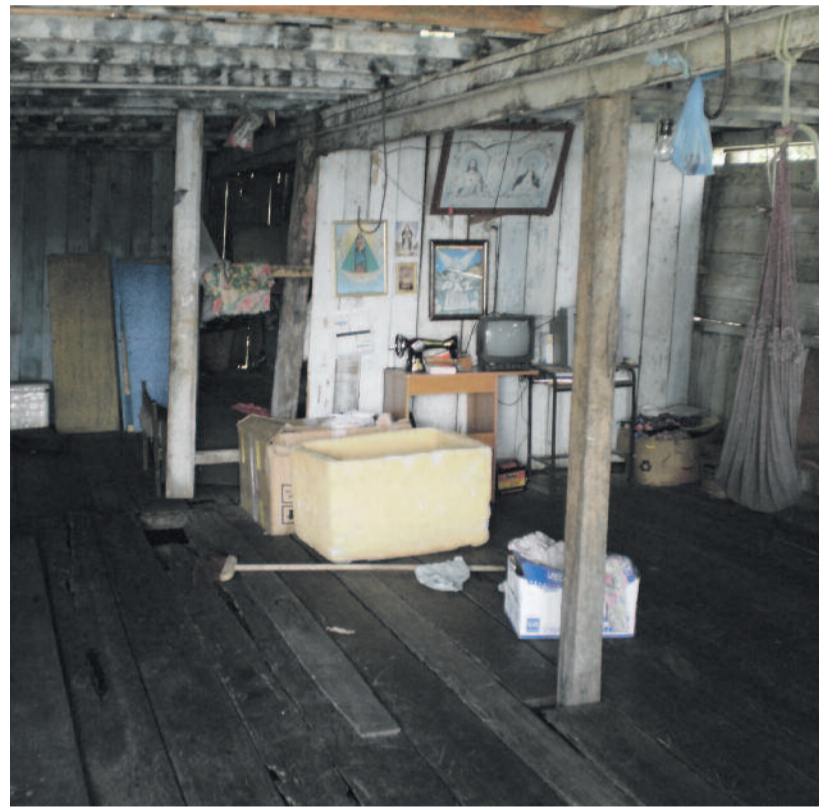
Nappali szoba egy indián asszony kunyhójában

önkéntes orvosokat, nővéreket, ügyvédeket, tanítókat visznek magukkal a civilizációtól elzárt indián településekre. Gyakran állami alkalmazottak is velük utaznak, ők veszik számba az egyébként „láthatatlan” lakosságot, személyi okmányokat készítve a számukra és felvilágosítva őket állampolgári jogaikról. A bibliatársulat és az állam együttműködésének kézzelfogható jelei a víztisztító berendezések és az alapvető könyvekkel felszerelt isko-