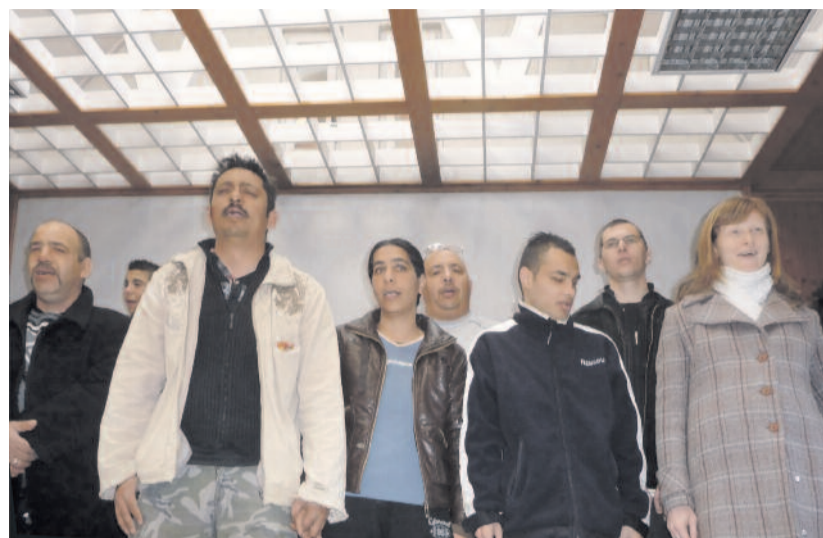
Bizonyságtévkék a Görögországi Külterületi Cigány Misszióból

Ha már tudatosan nem tudtuk összeszervezni a Filadelfia Evangélikus Egyházközség és a Budaörsi Evangélikus Egyházközség hétvégéjét, a mi mennyei Atyánk egy adminisztrációs hibát engedett meg, hogy ez mégis létrejöjjön. Egymástól függetlenül, teljesen eltérő célcsoporttal és célkitűzéssel szerveztünk programot a március 9–11-i hétvégéire. A budaörsiek munkamegbeszélést készülték tartani (30-40 fő), a Filadelfia pedig gyülekezetépítő családos hétvégét (80 fő). A nagy felismerés együtt gondolkodásra biztatott, és ahol csak lehetett, találkoztunk a két programot. Hétvégénknek a Párbeszéd Istennel – A kijelentést váró egyház címet adtuk.