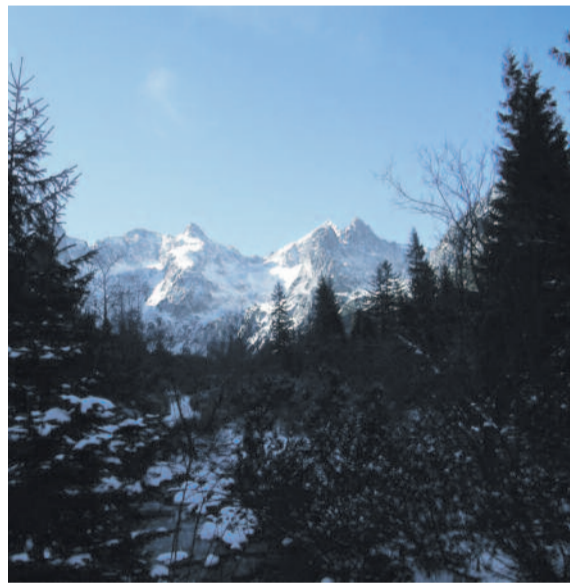
A Weber-csúcs a Fehér-tótól

Most, amikor Nagypámról szóló felolvasómat befejezem, nagy szomorúság fog el engem. Mivel visszatekintve ama örömteljes 1935-ös nyárra arra kell mélységes bánattal gondolnom, hogy Nagypám