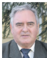
Evangélikus istentisztelet a Magyar Rádióban

templomot és iskolát építettek... 1747-ben a pozsonyi helytartótanács meghagyta Békés megyének, hogy miután az orosháziak felsőbb engedély nélkül építettek templomot, azt bontassák le, a lelkészt üzzék el. Az ügyet csak a (katolikus) Harruckern Ferenc mentette meg... A mai kőtemplomot 1786-ban építették, II. József türelmi rendelete alapján. Erről tanúskodik a templom keleti ajtaja feletti felirat is. (A templom a mai napig a város egyetlen műemlék épülete.)”