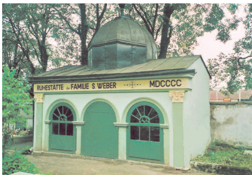
A Weber család sírboltja Szepesbélán