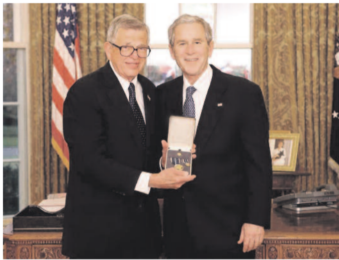
Colson George W. Bush amerikai elnökkel

Találón nevezte őt F. A. Ravi Kumar Zacharias indiai születésű, kanadai protestáns apológéta, hitvédő „korunk prófétájának”, akinek megrendítő megtérése a Watergate-ügy után csak a páli megtérés „világfordulatához” hasonlítható. „Hátározottsága, amellyel világosan és mély értelműen volt képes hirdetni az evangéliumot, magasra emelt fákllya volt korunkban, amelyet leginkább az iránytűvesztés vagy irány-