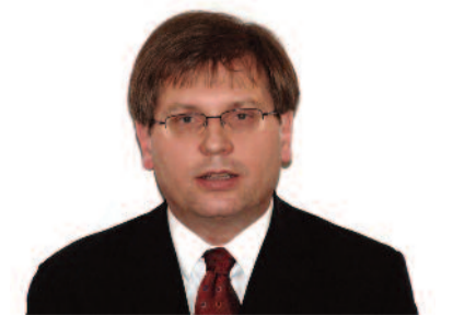
Fabiny Tamás püspök Északi Egyházkerület