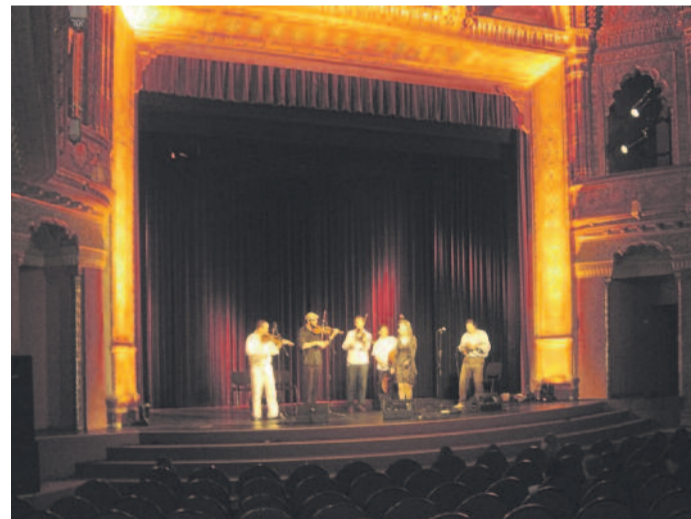
A „fellegajtó-nyitogató” Buda Folk Band

Akadnak azonban olyanok, akik miérteikre soha nem kaptak magya-