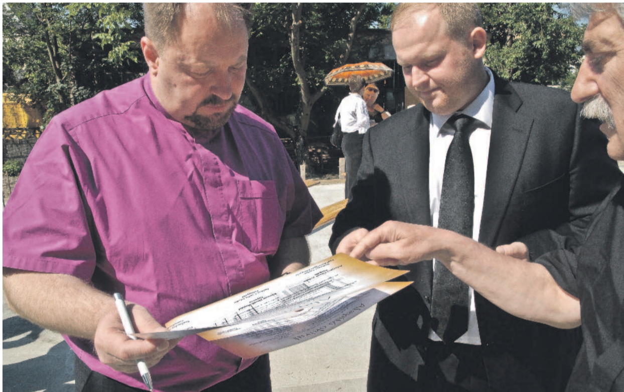
Püspöki alaprajzszemle – Evangelikus templom épül Besztercén...

A másokért élő egyház ► 2. oldal 200 éve választották püspökké Kis Jánost ► 4. oldal Isten szeretetének szolgálatában ► 5. oldal Czigány Györggyel – Weöres Sándorról ► 7. oldal Egyházjog Luther hazájában ► 8. oldal Evangelikus hölgyválasz a „múzeumészakán” ► 10. oldal