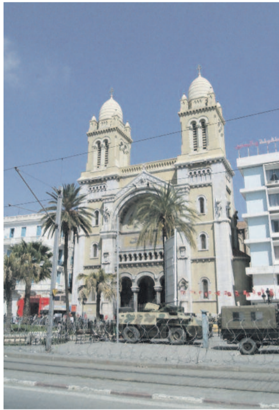
A tuniszi Szent Vince-katedrális

– A keresztény egyházakkal nagyon jó a viszonyunk. A mindegyikünket érintő kérdésekben gyakran cserélünk véleményt, s az egyeztetések nyomán alakítjuk ki közös álláspontunkat. Konferenciák alkalmával felkerjük egymás vezetőit előadások tartására. A néhány ezer tagot számláló zsidó közösséggel is példás az összhang, a tuniszi rabbival nagyon jól megértjük egymást. Sajnálatos számunkra is, hogy a forradalom után zsidó testvéreink száma tovább csökkent. Mint már említettem, Tunéziában az iszlám igen toleráns. Az iszlám hitűekkel is számos eszmecserét, dialógust folytattunk. A tunéziai átlagpolgár igen művelt, s e párbeszédben az értelmiségnek vezető szerep jut.