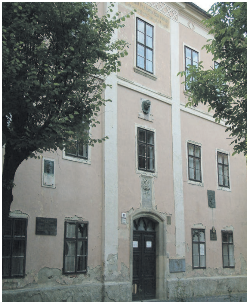
A késmárki liceum régi épületének bejárati része

Johann Genersich igen termékeny szerző volt, művei kora német szellemi életének alapos ismeretében alkotta. Legeredetibb művei az ifjúság nevelésével, szellemi és erkölcsi nemesítésével foglalkozó didaktikai művek, melyek a felvilágosodásból kihajtó pedagógiai-antropológiai irány-