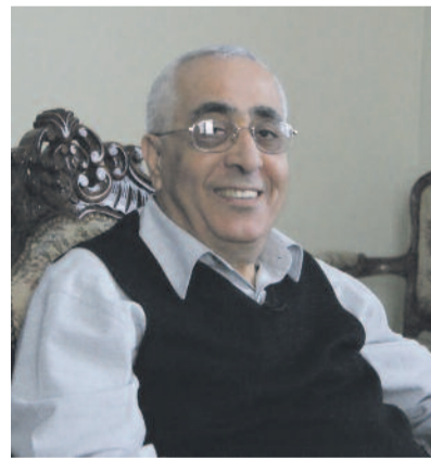
Maroun Lahham érsek

– A fiatalok legnagyobb része afrikai egyetemista, akik tunéziai egyetemeken tanulnak. Legtöbbjük dinamikus, befogadó ember. Az életöröm jellemzi őket, erről Ön is megbizonyosodhat a vasárnapi miséinken. Könnyen beilleszkedtek az egyház, a plébániák életébe, kórusokban, karitatív munkában szolgálnak a közösséget. De nem tekinthetünk el attól, hogy a keresztények java része