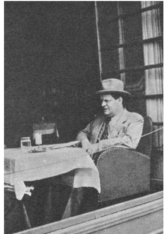
A Parisetto kávéház asztalánál...

Nyomasztotta a kizökkent idő, a reménytelenség élménye: „itt vagyok az Elhagyatottság Harmincadik / Szélességi, a Szégyen / Századik Hosszúsági / s a fogatösszeszorító Dac / Végső Magassági Fokán, valahol messze vidéken / És kíváncsi vagyok, lehet-e még jutni előbbre.” Bántotta az önkínzó magány, az