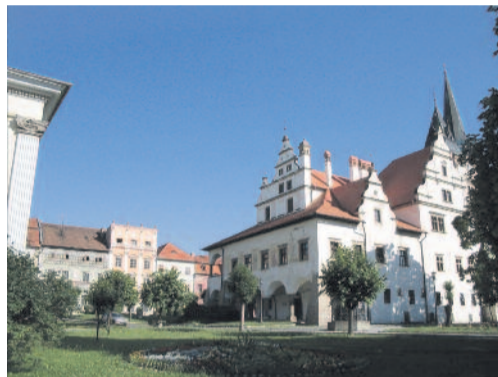
A négyszintes Spillenberg-ház a löcsei városháza mögött

A kolostor átadására nem került sor, ezért a hatalom arroganciája ér-