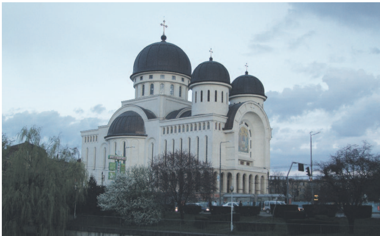
Az aradi ortodox katedrális

Kérdésünkre hozzáfűzte, különösebb botrány nem kísérte az építkezéseket, hiszen az önkormányzat általában gond nélkül hagyta jóvá a templomok építési engedélyt, illetve bocsátotta az ortodox egyház rendelkezésére a kért telkeket, így az-