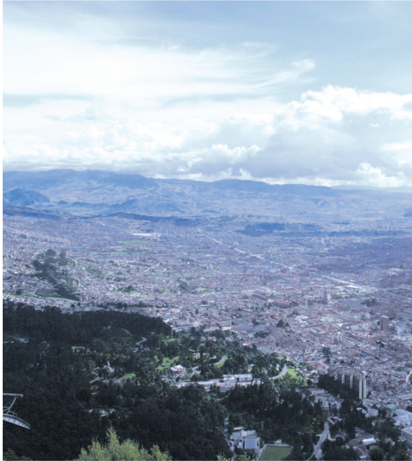
A kétezer-hétszáz méter magasan fekvő, nyolcmillió lélekszámú főváros, Bogotá

Tanácskozásunk helyszíne a katolikus egyház konferencia-központja. Köszönhetően a zárt és őrséggel védett területnek itt biztonságban vagyunk, de elég a szobánk ablakán kitekinteni, hogy szembesüljünk a mindennapok realitásával. Mellettünk ugyanis egy hatalmas női bör-