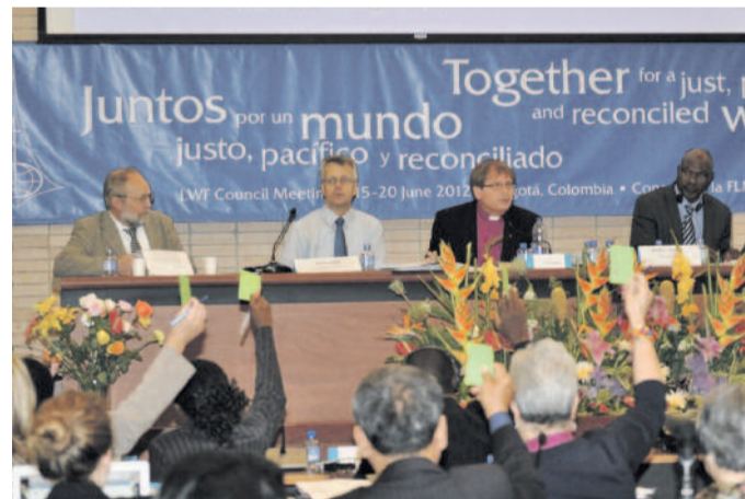
Szavazás a plenáris ülésen

Június 17-én, vasárnap a tanács tagjai Bogotá különböző evangélikus gyülekezeteit látogatják meg. Az a meg-