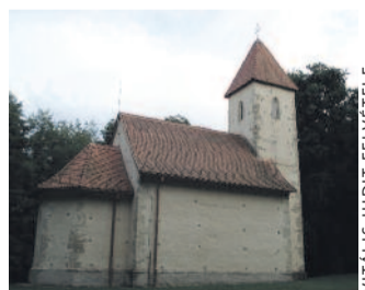
A veleméri Szentháromság-templom

Közvetlenül a szlovén határ mellett található Szalafő-Pityerszer, amely az Őrség legrégibb települése. A falu mára már lényegében néhány házból álló skanzennek tekinthető, ahol egy fél napot eltöltve megismerheted az őrségi szerek kincseit.