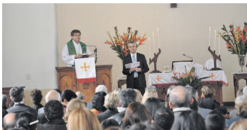
Istentisztelet a Redentor-templomban

nyolra. Az úrvacsorát megelőzően meg kell áldanom a nagyszámú gyereksereget. Amint karomat felemelem, ők is magasra tartják kis kezü-