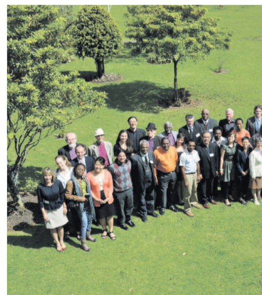
Az LVSZ tanácsa és a szakértők

tiszteltetés ér, hogy a város legnagyobb evangélikus gyülekezetében hirdethetjük igét. Amíg gyülekezünk, az egyik jelenlevő Puskás Öcsiről kérdez, egy fiatal pedig Rubik-kockával a kezében érkezik a templomba.