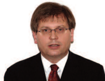
Fabiny Tamás püspök Északi Egyházkerület