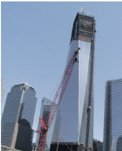
Épül a Freedom Tower

Az emlékparkba a női konferencia résztvevőit is elvitték. S bár a kapuban hatalmas táblán figyelmeztették a tu-