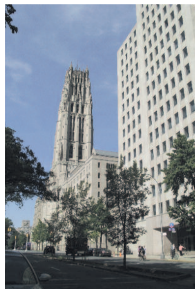
Az Interchurch Center épülete

Ma már a világnapi mozgalom lelkes munkatársa, sőt éppen ezen a New York-i gyűlésen bízták meg a