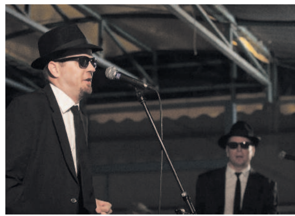
Blues B. R. Others