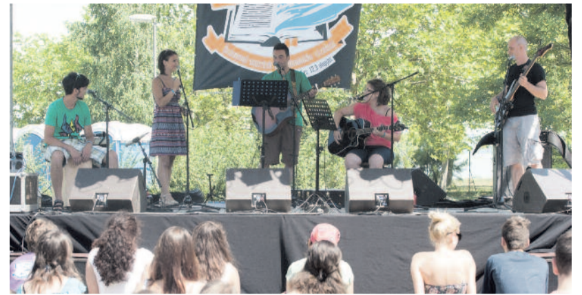
HMIK Band – A Hétfalusi Magyar Ifjúsági Klub együttese Erdélyből

Vegyük csak példaként a kőszegi ifisek alkotta Echo zenekart! Tizenhat dalt tartalmazó, idén júniusban készült CD-jük repertoárjának jó része úgynevezett „feketelistás” (értsd: az elmúlt két évtizedben „untig énekelt”) ifjúsági énekből áll. Kitűnő zenei érzékkel hozzájuk nyúlva azonban, íme, sikerült rehabilitálniuk többek között a Róla beszél fű , virág és a Boldog mosoly az arcomon kezdetű, persze