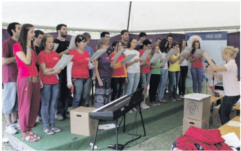
A szombati koncert

tunk azokra is, akik kevesebb zenei előképzettséggel bírnak. Nekik viszonylag egyszerűbb dolgokat állítottunk össze. A zenei csokorból azután kiválasztottuk, hogy mely darabok hangozzanak el a záró istentiszteleten. A próbákon ezekre fókuszáltunk.