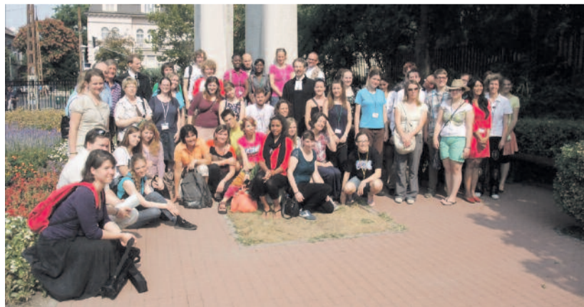
Protestáns fiatalok a fasori evangélikus templom melletti Reformációi emlékparkban

Egy mexikói fiú bátyja bandahörvű áldozata lett. Gyilkosaival később szintén egy drogbanda végzett, s a fiú családja megelégedettséget érzett a „bűnhődés” láttán, ám ő maga tudta, hogy az erőszakra nem lehet gyűlölettel válaszolni, és ezt el is mondta egy családi találkozón.