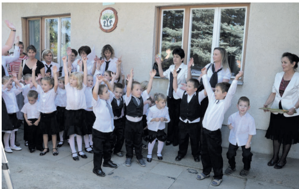
Évnyitó a lajoskomáromi Kerekérdő Evangélikus Óvodában