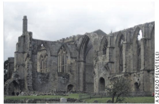
A Bolton-kolostor romjai

A konferenciáról angol nyelvű videók is készültek, melyek – és más információk a társaságról – megtalálhatók az ALS honlapján: http://www.anglican-lutheran-society.org .