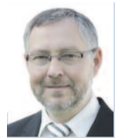
Evangelikus istentisztelet az M1-en