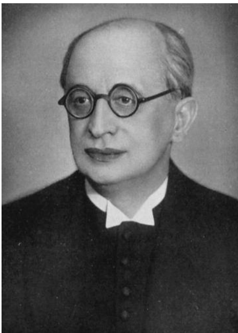
Dr. Ravasz László (1882–1975)

megfordultam. Később a filmgyárban kaptam feladatokat, majd a televízióban dolgoztam. Itt fordulóponthoz