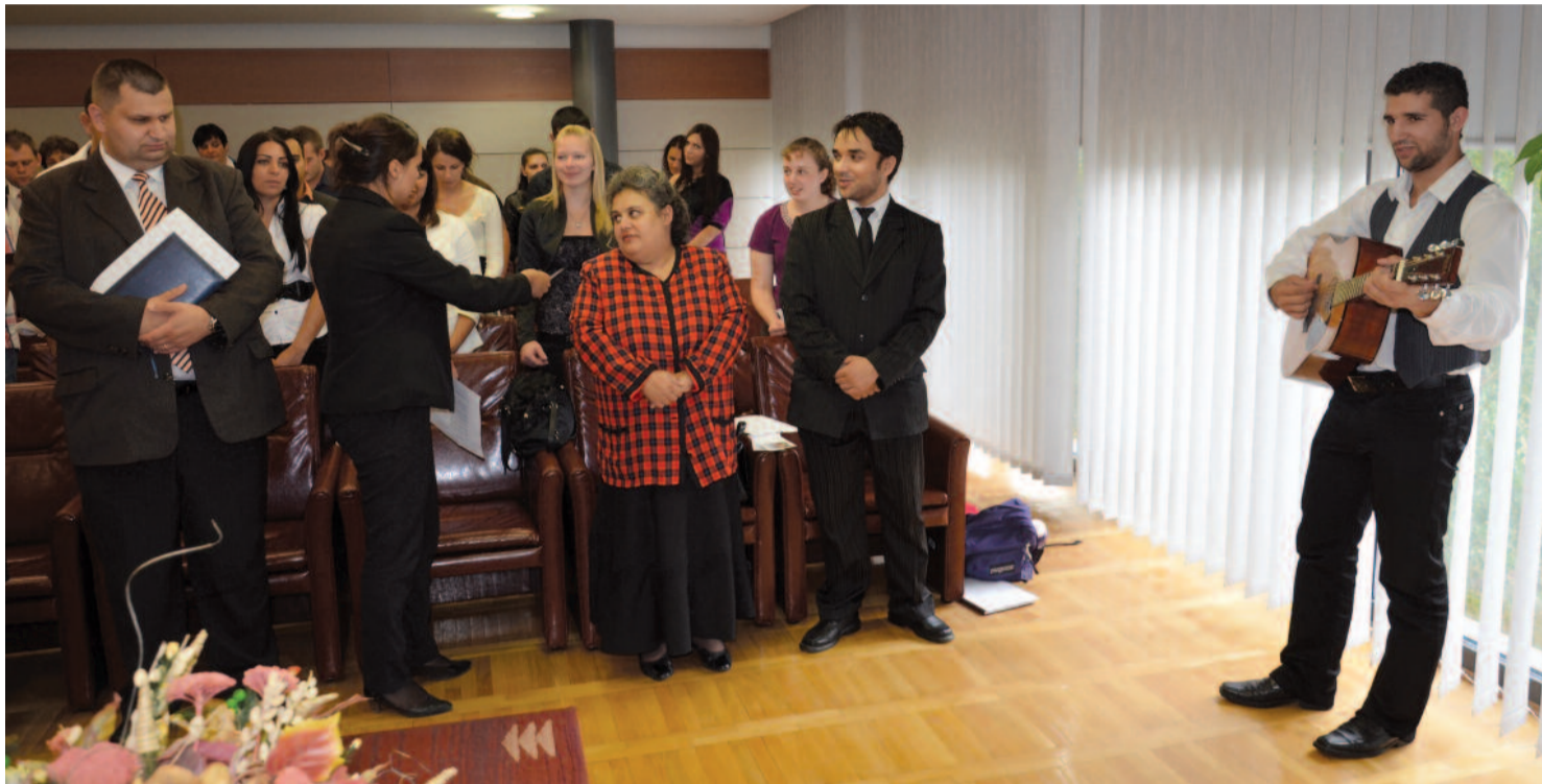
Tánévnyitó a nyíregyházi Evangélikus Roma Szakkollégiumban

Az egyház egységének vasárnapja ▶ 2. oldal „Egyházunk jövője az iskolapadokban van!” ▶ 7. oldal Konfirmáció és evangélikus nevelés ▶ 8–9. oldal Interjú dr. Ravasz László unokaöccsével ▶ 10. oldal Jerikó rózsája ▶ 11. oldal Szelíd vadak ▶ 15. oldal