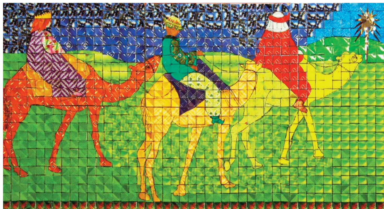
Serfőző Helén teafiltertásakból készült képe a Betlehemi jászol című városligeti kiállításon