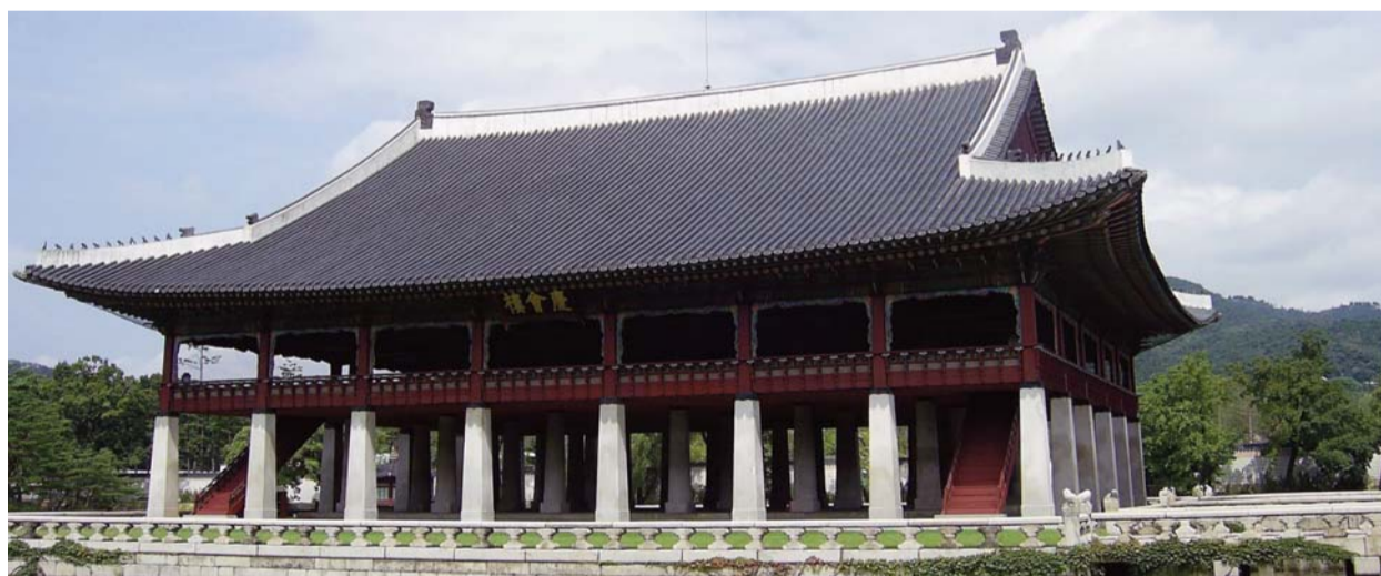
Korea hagyományos építészeti stílusát őrző szöuli kastély

Átgondolva tanítási különbségeinket és elkülönültségünk botrányos történelmét – sőt néha még a keresztények közötti gyűlöletet is – imádkozunk, hogy Isten, aki Lelkét leheli a száraz csontokra, és aki kezében formálja egységünket különbözőségeink közepette, életet és megbékélést lehessen kiszáradt életünkbe és megosztottságunkra ma is.