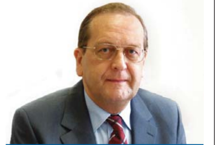
Ittész János püspök Nyugati (Dunántúli) Egyházkerület

És bármennyire nehéznek, olykor meg szinte lehetetlennek tűnik is, keresnünk kell a csendes percek, a lélek csendjét, amikor meghallhatjuk Jézus Urunk halk szavát. Mert csak ő kész és képes legyőzni az ellenséget, a mindnyájunkat elnyelni akaró ordító oroszánt (1Pt 5,8).