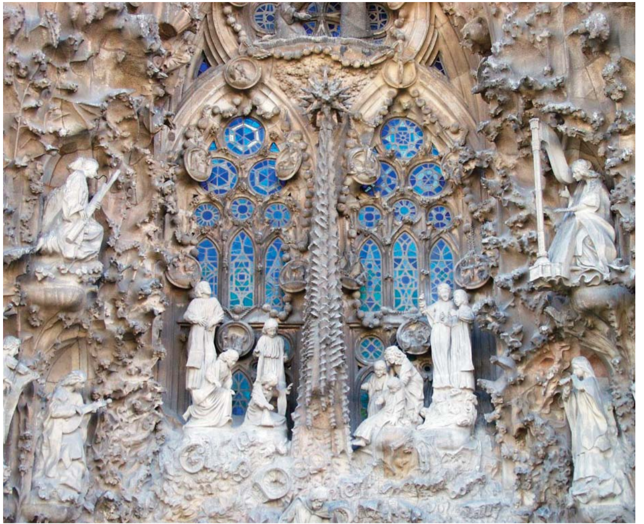
Az Antoni Gaudí által tervezett barcelonai Sagrada Família-bazilika részlete