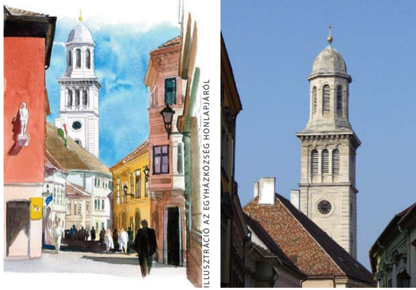
ILLUSZTRÁCIÓ AZ EGYHÁZKÖZSÉG HONLAPJÁRÓL