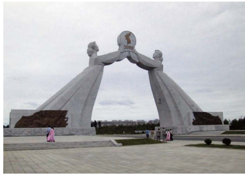
Az újraegyesítés phenjani emlékműve (Észak-Korea)

A keresztényeknek türelmesen kell imádkozniuk, amíg az „új ég és új föld” el nem érkezik, és akkor így teljesül a próféta jövendölése: „Az én népem lesznek, én pedig Istenük leszek.” (Ez 37,23)