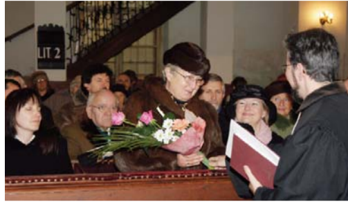
Lapunkban ritkán megörökített pillanat: a gyülekezet virágcsokkal köszönti az egyházkerület püspökének feleségét

ténetét, felhívva a figyelmet az akkori hívek adományszókedvére, illetve a munkálatok mai szemmel nézve is döbbenetes gyorsaságára.