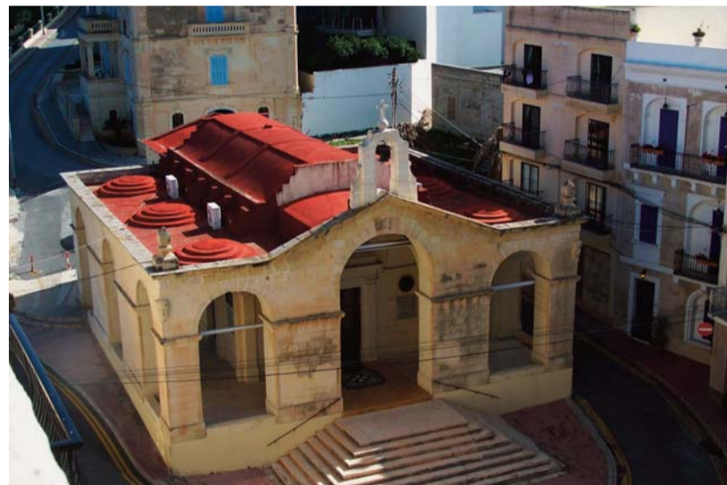
A Szent Pál örömtüze templom – a névadó öböl partján

Máltát egykor valószínűleg földnyelv kötötte össze a tőle ma már mintegy kilencvenhárom kilométernyire „eltávolodott” Szicíliával. A sziget legelső (Kr. e. 5200-ból feltárt) tár-