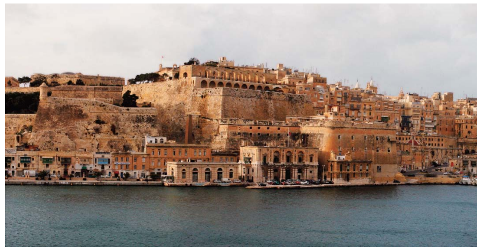
Védett öblök a tagolt tengerparton – Valletta látképe Sliemából

Három hónap múlva azután elindultunk egy alexandriai hajón, amely