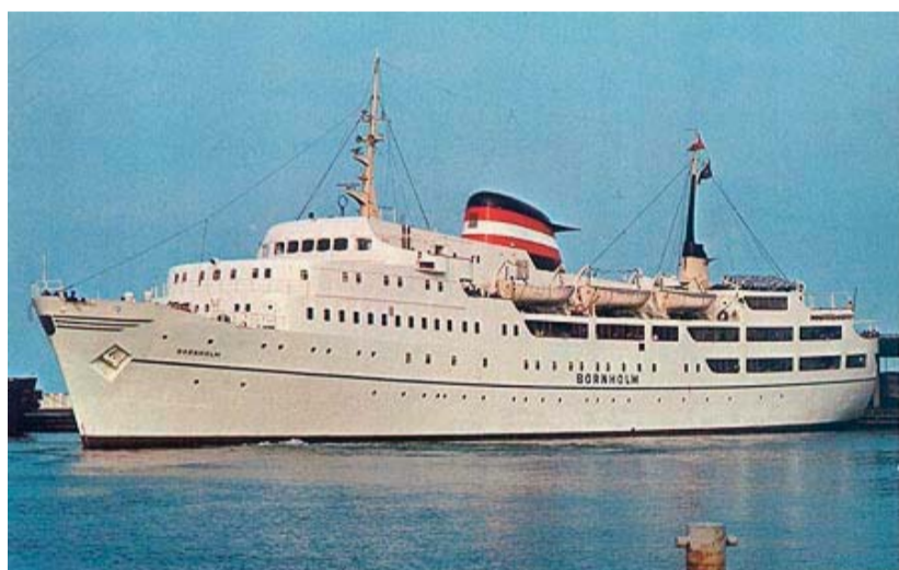
A semleges vizeken „szolgált” hajó – a Bornholm

Ezek a témák mind az egyházak közötti egységet munkálták a megosztott világban. S azzal, hogy a különböző felekezetek spirituális egységére hívták fel a figyelmet, az Európát megosztó tényezőket csökkenteni igyekeztek, az európai összetartozást pedig minden tekintetben konkrétan kívánták szolgálni.