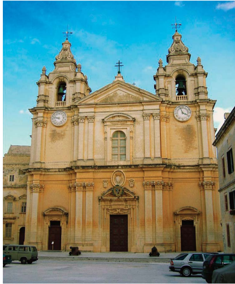
A mdinai Szent Pál-katedrális

biekben Athén püspökeként országnak elé vetett – Publiust hivatalosan mindaddig nem emelte a szentek sorába, a máltaiak Pál apostollal és Szent Ágotával egyetemben (róla később) a szigetország védőszentjeként tisztelik.