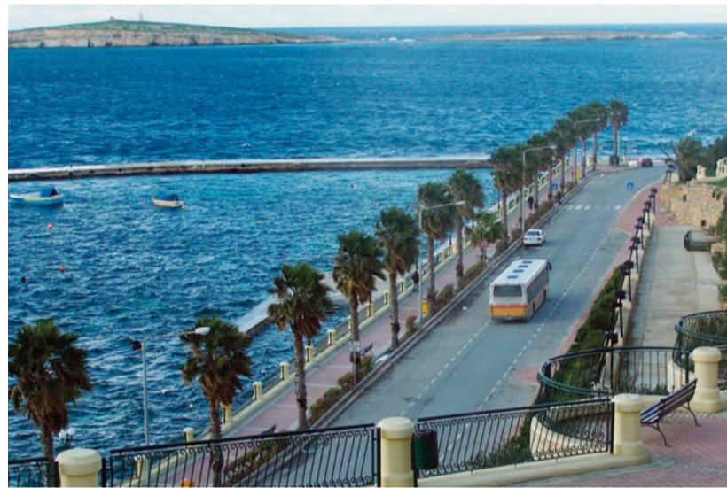
A máltai Szent Pál-öböl. A kép bal felső részén látható földnyelv a ma már szintén az apostol nevét viselő Selmunett-sziget, ahol Pálék hajótörést szenvedtek. Ezt hirdeti a sziget tetején álló emlékmű is.

A Földközi-tenger szívében – mintegy háromszáz kilométerre Észak-Afrika partjaitól – az említett két benépesített sziget és néhány vízfelszín fölé domborodó sziklaszirt alkotja a máltai archipelagust. Némi jóindulattal a Málta és Gozo közé ékelődött Comino mészkőtömbje is lakott szigetnek tekinthető, hiszen az egykor főként csempészek rejtékhelyéül szolgált, két és félszer másfél kilométeres kopár földterületen az áprilistól októberig üzemelő – s akár félezer vendéget is elszállásolni képes – hotelet a téli hónapokban is vigyázza egy családnyi állandó lakos. A régmúltból azonban mindössze két, emberi kéz alkotta építmény árváldok a szigeten: a jelenlegi formájában 1618-