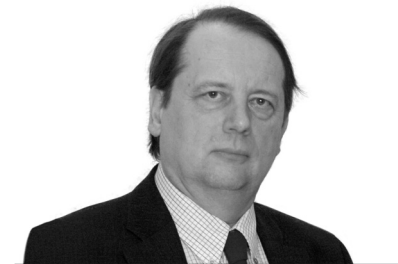
Gáncs Péter püspök Déli Egyházkerület

Ez a Lélek, az erő, a szeretet és józan-ság Lelke, az Atya és a Fiú Lelke, az egység és szabadság Lelke segítsen, vezessen minket tovább – hétről a nyolcra!