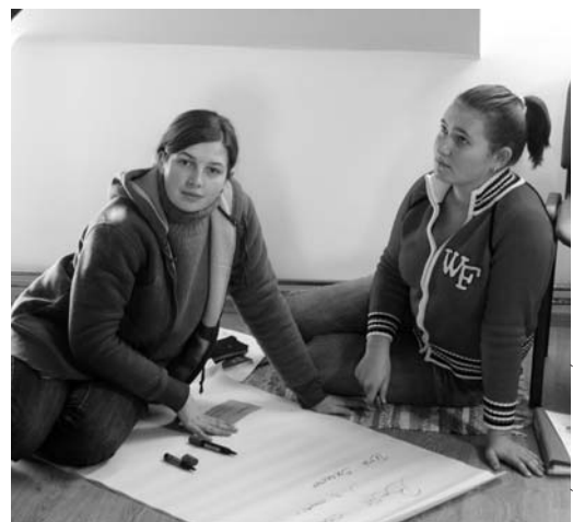
Pillanatkép az egyik csoportfoglalkozásról

A búcsú így hangzott: „Jó volt egy kis darab Magyarország, gyertek máskor