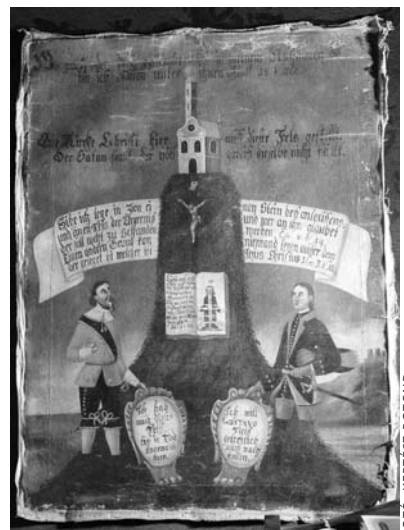
Kép az Evangélikus Országos Múzeumból: templomalapítást megőrkítő olajfestmény. Valószínűleg 17. századi német munka. Restaurálása 600 ezer forintba kerül.

Az egyházi gyűjtemények támogatásának csökkenése oly mérvű, hogy fölmerült a gyanú: lassan eltűnik ez a költséghely. Az előzményekre most nem térek vissza, csupán az 500 millióról 325 millióra történő csökkentésről szölok. Miután a tervezett összeg nyilvánosságra került, az Egyházi Könyvtárak Egyesülése – mint független szakmai szervezet – élénk levelezésbe kezdett; állami részről pedig olyan megnyilvánulás hangzott el, hogy a gyűjtemények nevesített céltámogatásként ugyan kevesebb pénzt kaptak, de egészében véve az egyházak állami támogatása