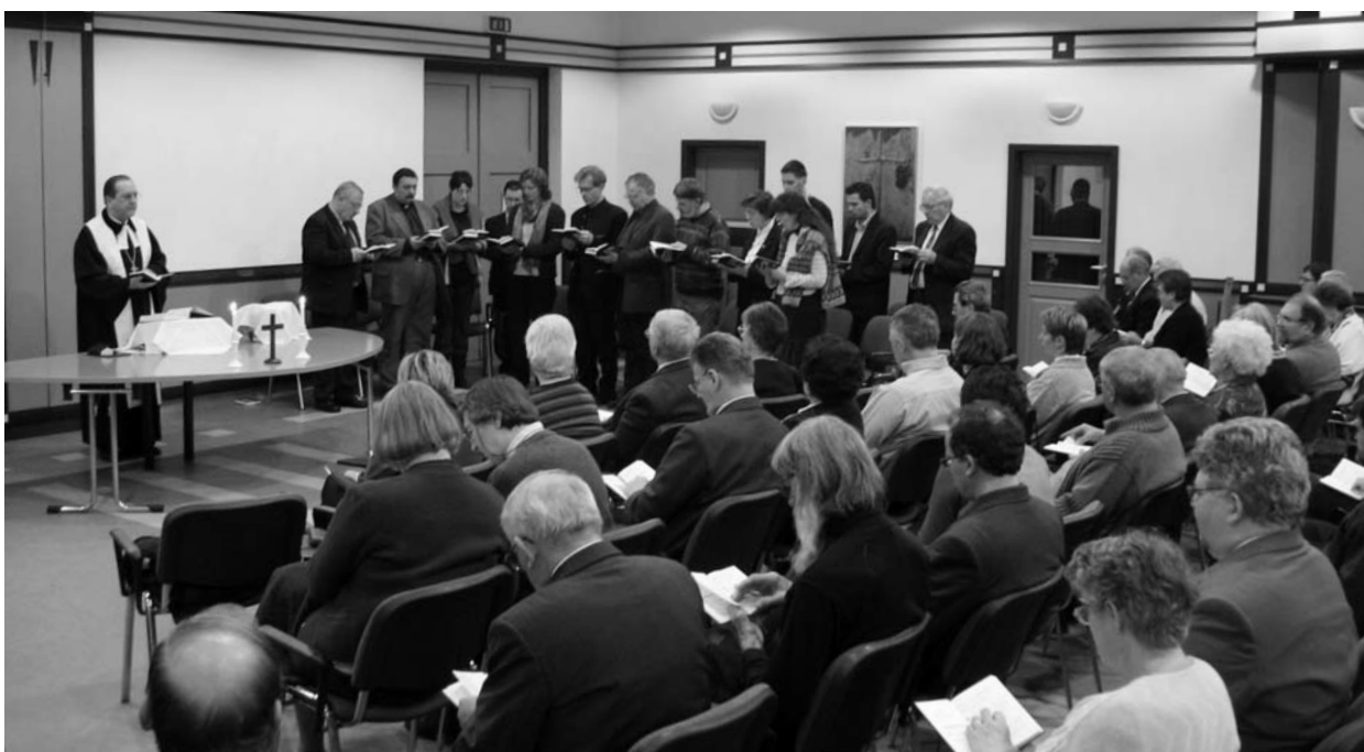
A záró úrvacsorai istentiszteleten a résztvevőkből az alkalomra alakult liturgiai kórus szolgált

Ildikónak erre az alkalomra írt házassági áldása sokunknak erőt adhat: „Áldd meg, Uram, Q-t és Z-t, akik a házasság szent, szerelmes szövetségében áldozatot is vállalva élnek. Áldd meg, Uram, testüket, lelküket, gondolataikat, hogy ezután is csak egymáshoz ragaszkodjanak. Tedd erőssé a kezüket, amellyel egymás kezét fogják, tedd gyöngéddé a szívüket, amelyben egymást hordozzák, tedd egyenessé a gondolataikat és tetteiket, amelyekkel egymást gyarapítják. Vezesd őket, Uram, hogy mindig az általad kijelölt úton járjanak. Bátorítsd őket, Uram, hogy hozzád és egymáshoz mindhalálig hűségesek maradjanak, s majdan elnyerhessék tőled az élet koronáját. Ámen.”