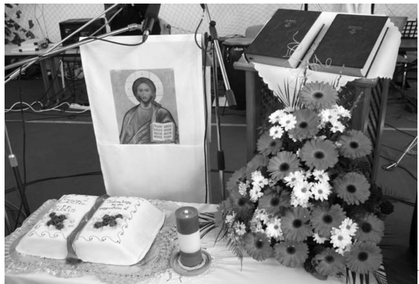
A penci ökumenikus bibliaiálkozó oltára