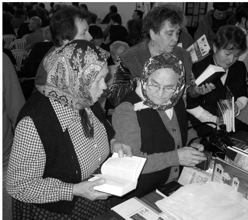
A nap során az evangélikus Luther Kiadó és a Szent Jeromos Katolikus Bibliatársulat is árusította kiadványait – a Biblia volt a legkelendőbb portéka