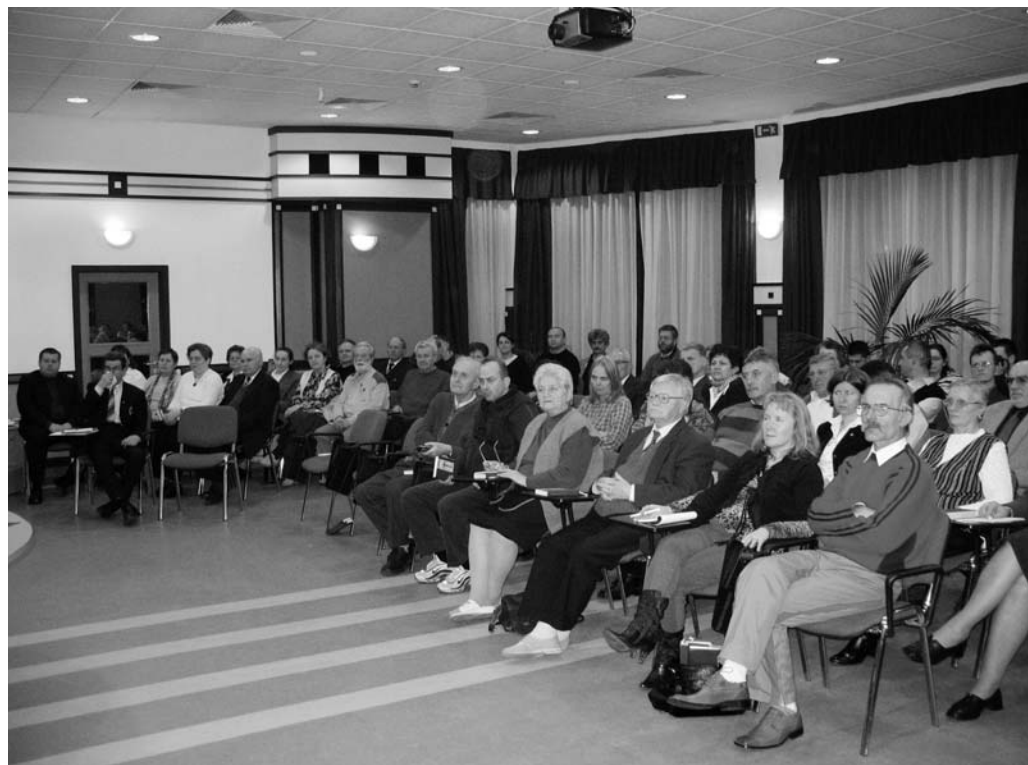
A konferencia résztvevőinek egy csoportja

Ha úgy találtuk, hogy az egyetemes papságról szólva Luther megnyírbálja az egyház hivatalos szolgálatát végző papok/lelkészek privilégiumait, és a másokért való áldozathozatalát, az imádságban való közbenjárást és a testvéri vigasztalást a világi hívők hatáskörébe utalja, akkor azt is meg kell látnunk, hogy ez csak az érem egyik oldala. Az egyház néha papnak, néha lelkésznek, máskor prédikátornak mondott hivatalos szolgálattevőitől csak az Isten népének képviselőitében Isten felé irányuló közvetítő szerepüket vitatja el mint fölöslegeseket. Ezzel szemben Luther még a római egyháznál is markánsabban hangsúlyozta a hivatalos szolgálattevőknek Istentől az Isten népe, a gyülekezet felé irányuló közvetítő szerepét.