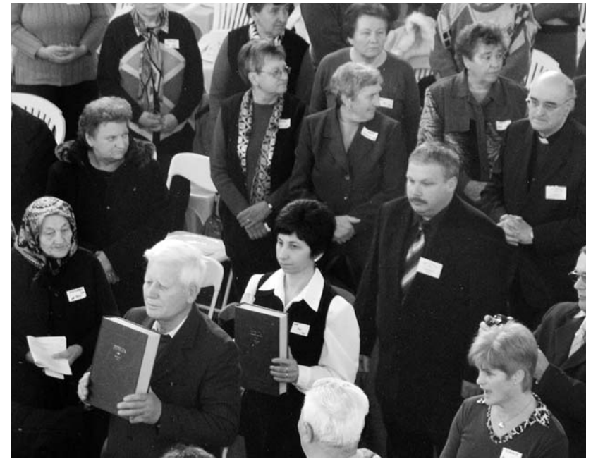
A találkozó az 1590-ben nyomtatott vizsolyi Biblia hasonmás kiadásának az oltára helyezésével kezdődött