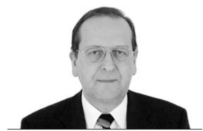
Ittész János püspök Nyugati (Dunántúli) Egyházkerület

Így mélyül el és nyer új távlatokat testvéregyházi kapcsolatunk, és így telik meg naponta élő tartalommal gyülekezeteink, intézményeink és egész egyházunk életében. Ez teszi most lehetővé számunkra, hogy az ez évi böjti áldozati akció gyümölcséeként győri és szombathelyi iskoláinkban támogatást adhassunk a szegény családok gyermekeinek. Köszönjük bajor testvéreink áldozatkész, támogató szeretetét, és Isten áldását kérjük testvéregyházunk életére, szolgálatára.