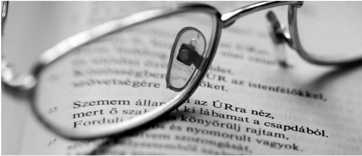
„Szemem állandóan az Úrra néz.” (Zsolt 25,15) – Oculi vasárnapja