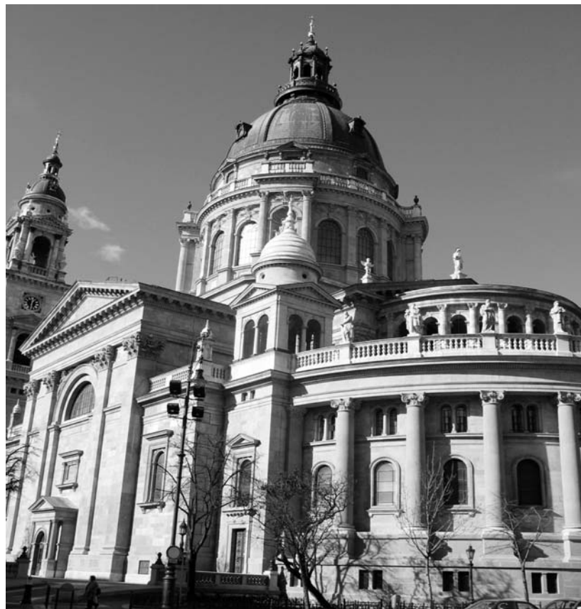
A bazilika épülete a Bajcsy-Zsilinszky útról

A szakértők természetesen próbálták kivizsgálni a tragédia okát, és több dolgra tudtak következtetni. A tervekben szereplő számítási hibák mellett a taka-