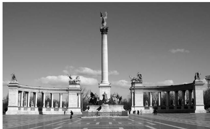
A millenniumi emlékmű két oszlopcarnokában jelenleg álló szobrok: Szent István, Szent László, Könyves Kálmán, II. András, IV. Béla, Károly Róbert, Nagy Lajos, Hunyadi János, Mátyás, Bocskai István, Bethlen Gábor, Thököly Imre, II. Rákóczi Ferenc, Kossuth Lajos.

hogy összemérhessék tudásukat, és a bírálóbizottság által legjobbnak ítélt terv valósuljon meg. Am ezúttal nem hirdettek pályázatot. A tervek elkészítésére az Országgyűlés felhatalmazása alapján és a háborgó pályatársak tiltakozása ellenére Schikedanz Albert építész és Zala György szobrászművészt bízta meg hivatalosan Wekerle Sándor miniszterelnök. Az 1895 tavaszán megkötött szerződés öt évet kötött ki a munkák elvégzésére; ekkor még senki sem gondolta volna, hogy az avatással mégis 1929-ig kell várni.