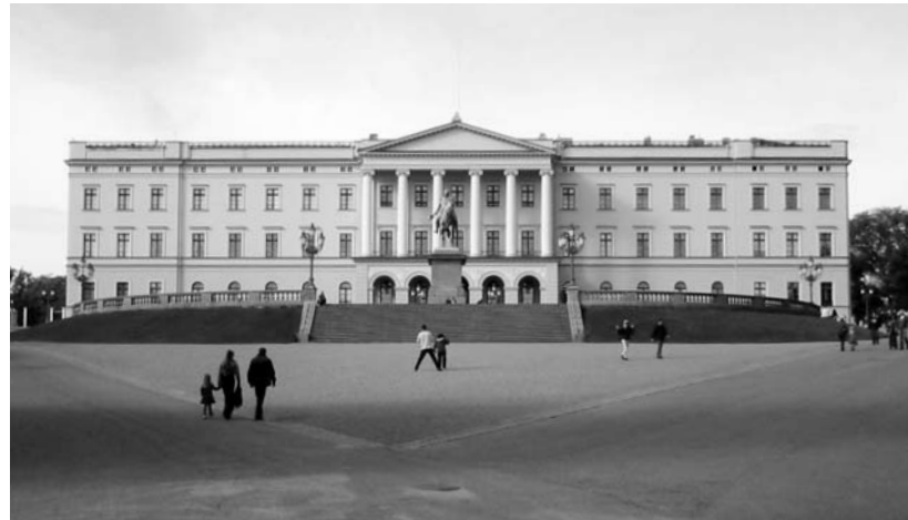
A norvég királyi palota

Hamiskás mosollyal az arcán megy tovább. Egy új kirakat szolidabb árut ígér. Spanyol Dutti. Kézzel kivarrt fazon a férföltönyön, kézzel felvarrott zsebek, karcsúsított modellek. Üres az üzlet, vevőköre szűk, szombat dél és kettő között van csak némi forgalom. Az anyagok elsősztályúak, az árak nem kevésbé. Pedig ma már ilyen nemes anyagokból sem egy életre szánnak öltönyt. Di-