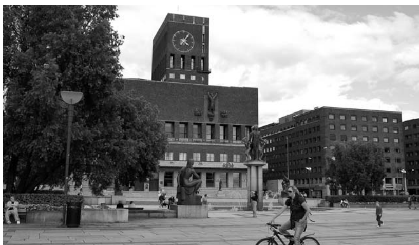
A városháza épülete

Sétál az ember tovább, s naná, hogy megáll a Nemzeti Színház hirdetőményei előtt. A páratlan években nincs nemzetközi Ibsen-, de van kortársdrama-fesztivál s általában Oscar Wilde-, Holberg-, Karen