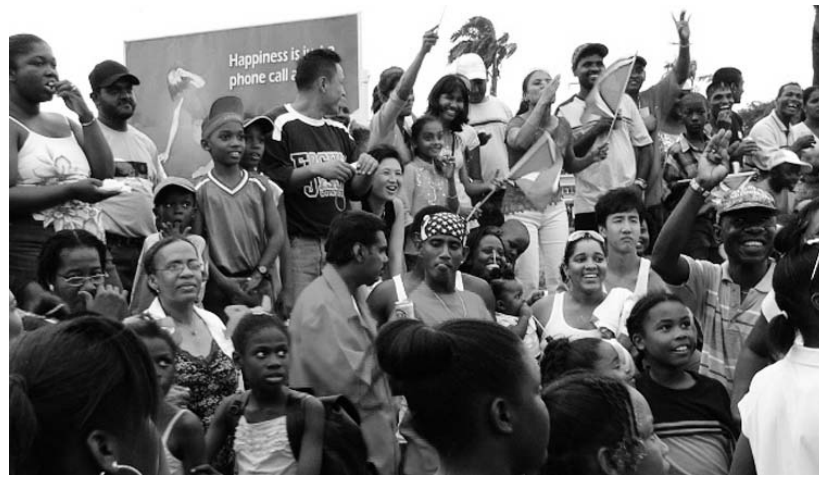
Karneváli hangulat a Mashramani ünnepen