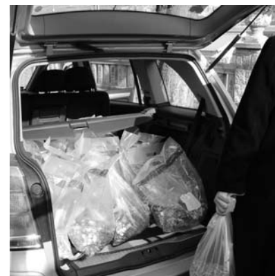
Aprókkal teli egyenztárcák a csomagtartóban

Tekintettel arra, hogy az MEE több gyülekezetéből és intézményéből jelezték: folytatnák a gyűjtést, március 31-ig meghosszabbítják az akciót. Kérnek mindenkit, hogy a még összegyűlt aprókat a hónap végéig juttassák el az Északi