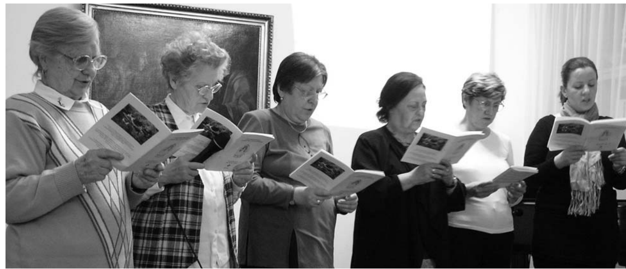
Református felolvasók a Deák téri evangélikus imateremben