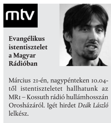
Evangélikus istentisztelet a Magyar Rádióban

2008. január 1-jén kezdte meg szolgálatát az állami normatívával működő Györy Vilmos Evangélikus Szeretetszolgálat, amely a házi segítségnyújtáson és a naponkénti klubalkalmakon túl lelkiileg is erősíti a gyülekezet idős tagjait. Hetente kétszer tartja közösségformáló alkalmait a Fénysugár Nyugdíjas-egyesület; rendszeresen végeznek gyülekezeti látogatást – a lelkes munkáját segítő – a diakóniai csoport aktív tagjai is. Vannak reggeli áhítatok, esti istentiszteletek, korcsoportok szerinti bibliaórák (nyugdíjas, presbiteri, felnőtt fiataloknak szóló és ifjúsági), ifjúsági istentiszteletek színes liturgiával. Vasárnaponként három istentisztelet van a nagytemplomban és három a leánygyülekezetekben. Az anyaggyülekezetben a vasárnap esti istentiszteleten már az új agenda szerint zajlik a liturgia.