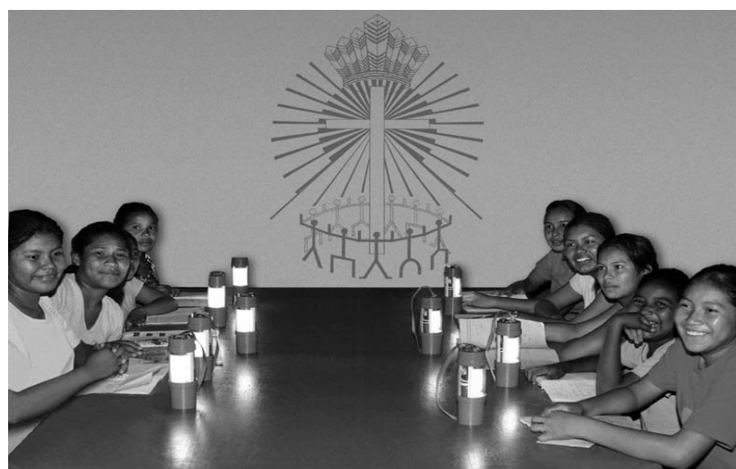
Guyanai diáklányok maguk készítette szolárlámpáscskáik mellett értelmezik az imanap logóját

A főváros keresztény közösségeiben szinte az egész hét az imanap jegyében telt. A számos helyszín közül ismerjünk most meg hármát, amelyeken más és más gondolat ragadhatta meg a jelen-