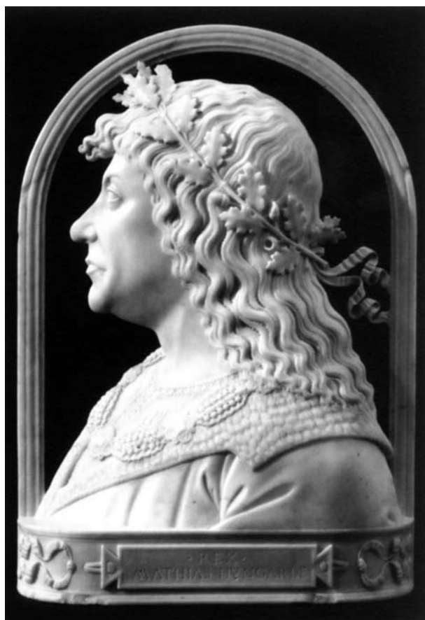
Mátyás király képmása – ismeretlen olasz szobrász alkotása (1480–90)

apjáról, aki a nándorfehérvári diadal előtt így biztatta katonáit: „Vagy megszabadítjuk Európát a törökök erőszakos uralmától, vagy elesvén Krisztusért, elnyerjük a mártírok koronáját!... Védjétek meg Krisztust!” Ezt a szemléletet hozta a szülői házból.