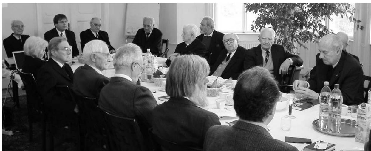
Az egyházkerületi nyugdíjaslelkész-találkozó résztvevőinek egy csoportja

Nem volt kevésbé kockázatos a lelkési szolgálat a városokban sem. Ma már tudjuk, mekkora hálózat figyelte minden lépésünket és prédikációinkat. Akkor csak sejtettük. A hivatalos, kötelező világnézet árnyékában egyedül az egyházak szólhattak másként, gondolkozhattak másként az evangélium alapján. Bár a hatalom ezt is szeretete volna „ár-