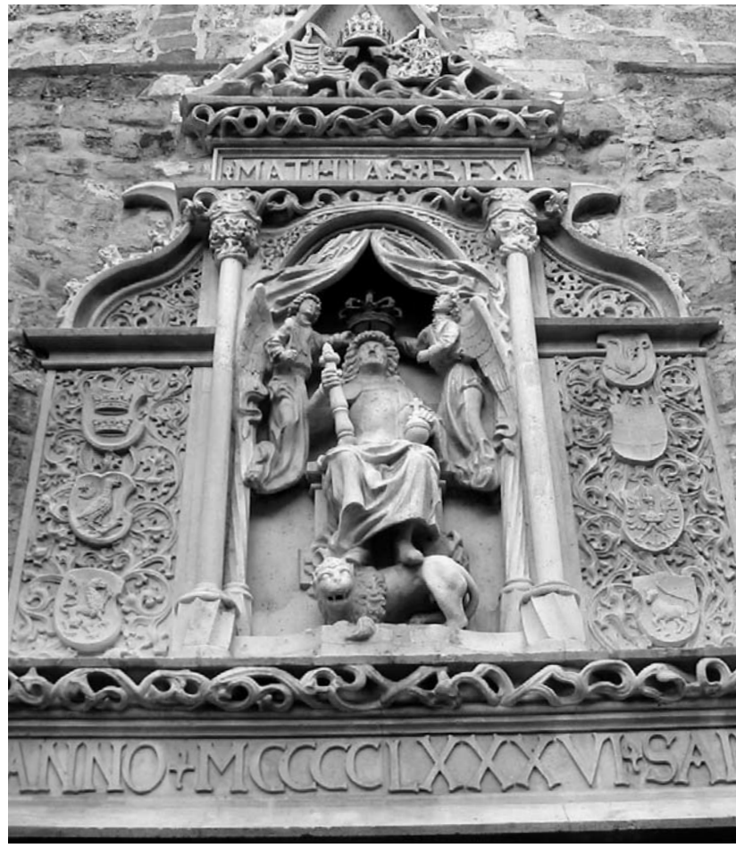
Mátyás emlékműve a budai Várban