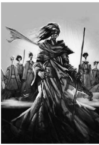
Jézus és tanítványai Siku képregényében