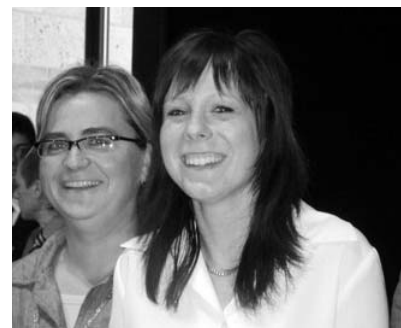
Az első mosolya

A döntőbe jutott tizenkét tanuló közül egy diák egyéb elfoglaltsága miatt nem tudott részt venni a megmérettetésen. Jól-lehet a versenyzők között a fiúk voltak