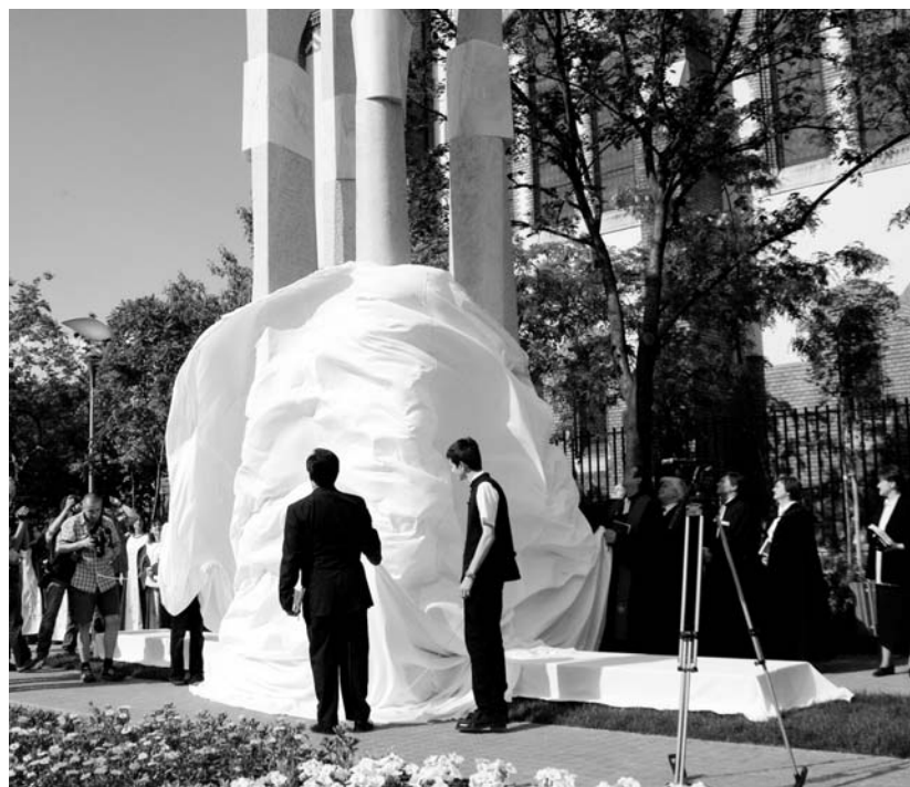
A protestáns egyházak képviselői leleplezik a reformációi emlékművet

intelem és egy zsoltárvers segítségével fogalmazta meg. A szobor talapzatán is olvasható a páli ige: „Az igaz ember hitből él”, s az istenkeresés során bontakozik ki számára a keresztény élet titka: a világ egyetlen és végső, isteni erőforrásából táplálkozva juthat – a zsoltáros szavaival – erőről erőre, hogy képes legyen a szelidség, az alázat, az irgalom és a szeretet krisztusi példáját embertársai elé lüktetni. Mindez csakis hitből fakadhat, és a reformáció legnagyobb felismerése éppen ez: hit nélkül nincsen igazi élet.