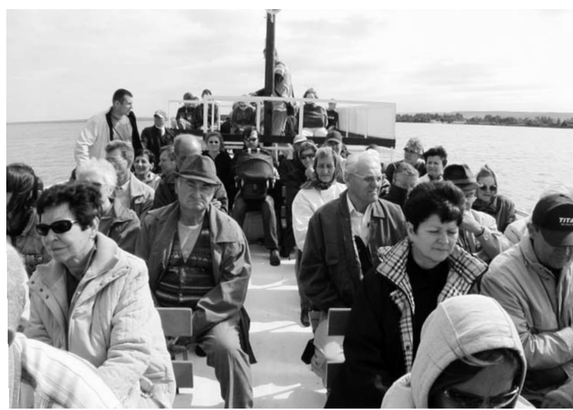
A Fertő tavon „határt sértve”

Az elszállásolás családoknál történt; a programokon vendéglátók és látogatók együtt vettek részt. A megérkezés után „láblógatós” pihenőnap következett, amelyen a vendéglátó családok fakultatív programokat szerveztek a kilencszáz kilométert hátuk mögött tudó fáradt testvéreknek. Másnap tartalmas, sok látványt kínáló kirándulás várt a két gyülekezet tagjaira. Kőszeg volt az első célállomás, ahol a Jurisics-várat, illetve az evangélikus templomot is felkeresték, majd rövid sétát tettek a városban. Ezután a közelmúltban megnyitott, Bechtold István madártani kutatóról elnevezett természetvédelmi látogatóközpont nézték meg, ahol hét kiállítóegységben interaktív formában ismerhették meg a Kőszegi-hegység állat- és növényvilágát. Felmentek még a Szent Vid-kápolnához,