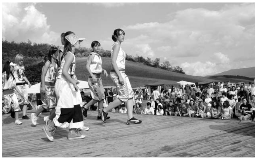
A világbajnokságra készülő Def Jam Dance School táncsoport a szűpataki színpad deszkáin