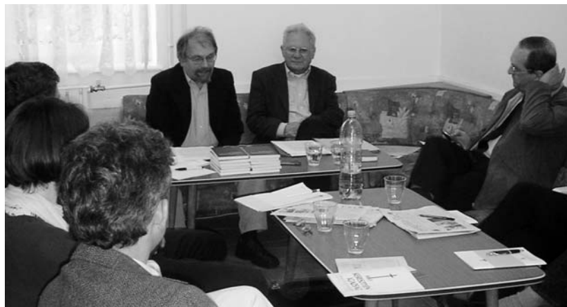
A piliscsabai konferencia résztvevői között

Tekintettel kell lenni arra, hogy a helyzet ma egészen más, mint egykor volt. A jelenlegi egyházi vezetéssel való kapcsolatunk példának okáért jó és rendezett. Én a magam részéről a megoldást a KÉMELM-nek a külföldön élő magyar evangélikus lelkészek frateritásával való átalakulásában látom. Az ehhez való csatlakozás szándékát mindenki egy meghatározott összeg önkéntes befizetésével jelezhetné. Ily módon szervezeti hierarchia nélkül, baráti közösségként lehetnének a Magyar Evangélikus Konferencia (Maek) tagjai. Ezen belül bizonyára könnyebben meg fogjuk találni a megfelelő lehetőségeket arra, hogy – például konferenciákon való