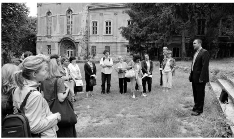
A helyi lelkész az aszódi kastély kertjében köszönti a kirándulókat