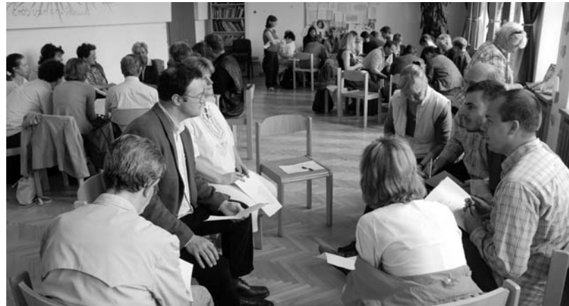
Hajótöröttek a tízfős „mentőcsónakokban”

ötvenkét településről járnak be – oktatnak-nevelnek a gimnáziumban; az intézmény személyi állománya (a tanstület és az egyéb munkakörökben dolgozók összesen) hetvennyolc fő. A tanárok hatvan százaléka, a gyerekek egyharmada evangélikus. Az iskolai munkát jól felszerelt szaktantermek – számítógépterem, kémiai és nyelvi labor – és korszerű eszközök – például digitális tábla – segítik. A gimnázium egyúttal kistérségi oktatási központ, kiemelt je-