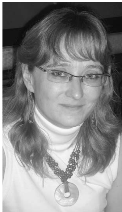
A SZERZŐ FELVÉTELE