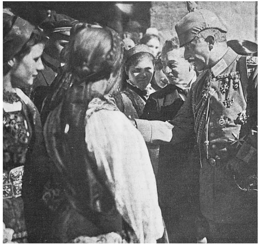
A német császár csángó magyar leányokkal beszélget