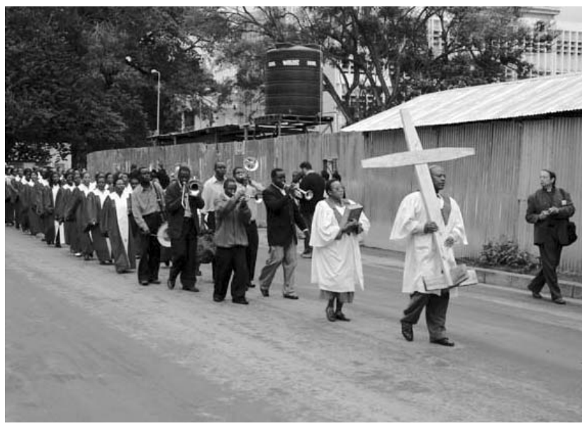
Az LVSZ tanácsülésének nyitó istentiszteletére vonulva Arushában

Az arushai nemzetközi kongresszusi centrum ad otthont az LVSZ tanácsülésének. A konferencia mottója egyaránt utal a földrajzi és a globális kontextusra: „A Kilimandzsáró olvadó hóspájkája – a szenvedő teremtettség tanúságtétele”.