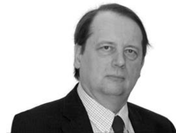
Gáncis Péter püspök Déli Egyházkerület

Mindig rohanó, gyakran befelé forduló európaiak számára megkapó az itteni nyitott barátsága, vendégszeretete. Afrikai testvéreink egy szellemes mondatban így summázzák a köztünk lévő mentalitásbeli különbség lényegét: „Nektek órátok van, nekünk pedig időnk.” És tegyük hozzá: szívük is van, nem is akármilyen!