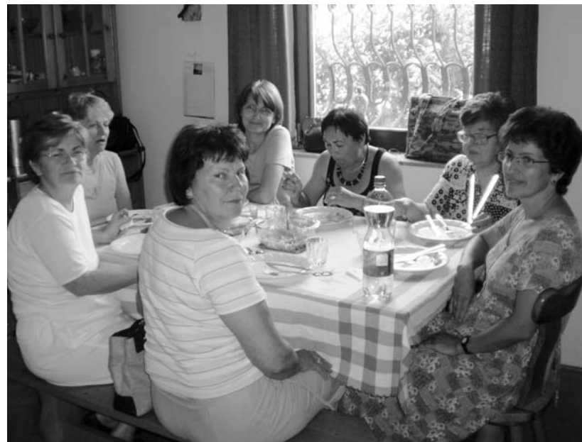
A kórházi ágy helyett közös asztal mellett

vel tudnák közösségünket megajándékozni, szombat délután, amikor elbúcsúztak egymástól, és „csapra verték a hordót”, a mennyei nedű ízével a szájukban mehettek haza Csobánkáról, hogy folytassák azt a nehéz, lelket megterhelő munkát, amelyet a betegek között végeznek a hétköznapi életben.