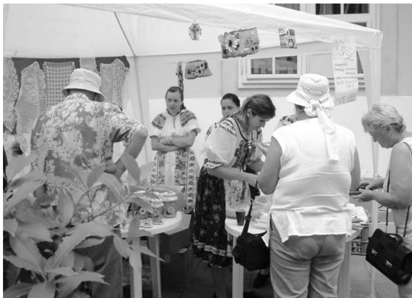
A Lelki lehetőségek piaca

A délutáni és esti programkínálat – bibliai elmélkedések, előadások, műhelymunkák, neves zenészek koncertjei, énekkarok és zenei együttesek fellépései, ifjúsági programok – már a bőség zavarát zúdította a résztvevőkre. Délről négy óráig nagyon sok helyszín közül lehetett választani: az előadások, fórumok, tematikus szekcióbeszélgetések, a gyermek- és ifjúsági programok is ekkor kezdődtek, valamint továbbra is válogathattak az érdeklődők a Lelki lehetőségek piacának kínálatából a város különböző pontjain.