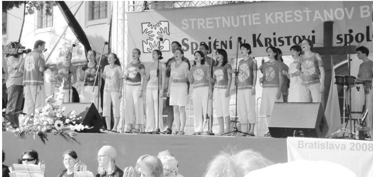
A pécsi gospelkórus a találkozói szombati főrendezvényén a pozsonyi főtéren

A konferenciáról tudósítunk a 4. oldalon