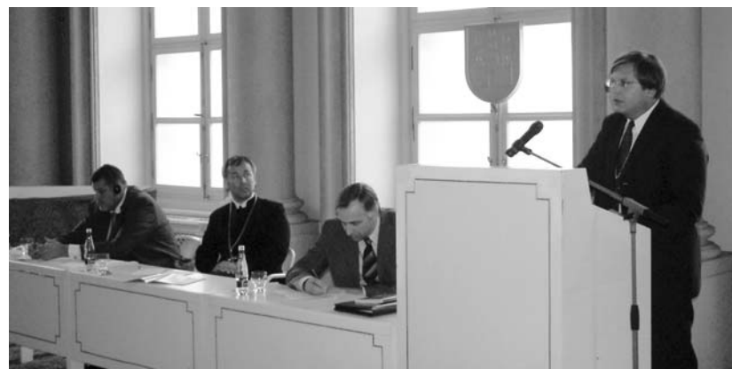
Ján Kubiš szlovák külügyminiszter, Miloš Klátik egyetemes püspök, Ján Figel, az Európai Unió szlovák kulturális biztosa és Fabiny Tamás püspök

és zsidó kultúrával egyaránt büszkélkedő Pozsonynál nem is lehetnénk jobb helyen. Hangsúlyoztam, hogy a reformáció szemléletében alapvető fontosságú az anyanyelven megszólaló istentisztelet és liturgia, ezért szorgalmazzuk azt, hogy a szlovákiai magyaroknak legyen lehetőségük az istentiszteleteket magyar nyelven hallgatni.