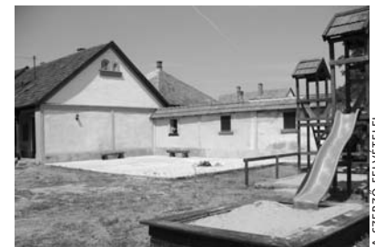
...most vár áll ott

És hogy ne kelljen szakmunkákra költeni, minden feladatot a gyülekezet tagjai, valamint az ország távoli pontjairól érkező testvérek – saját szabadságukat feláldozva – végeztek el. „Isten országát építjük” – mondták.