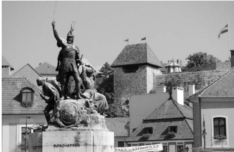
Dobó István szobra Eger főterén

Később azonban a kriptá oldalában fedeztek egy elfalazott részt, amely egy férfi és egy nő hamvait őrizte. A régészek