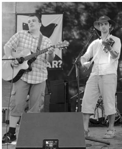
Az ír zenét játszó Shamrock két tagja