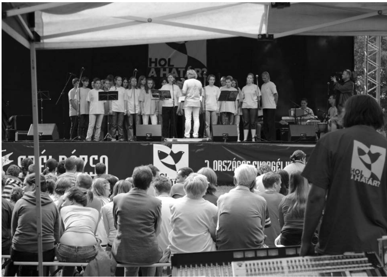
Izsjóp-koncert – néhány perc múltán sokunknak rosszul esett, hogy rosszkor esett...