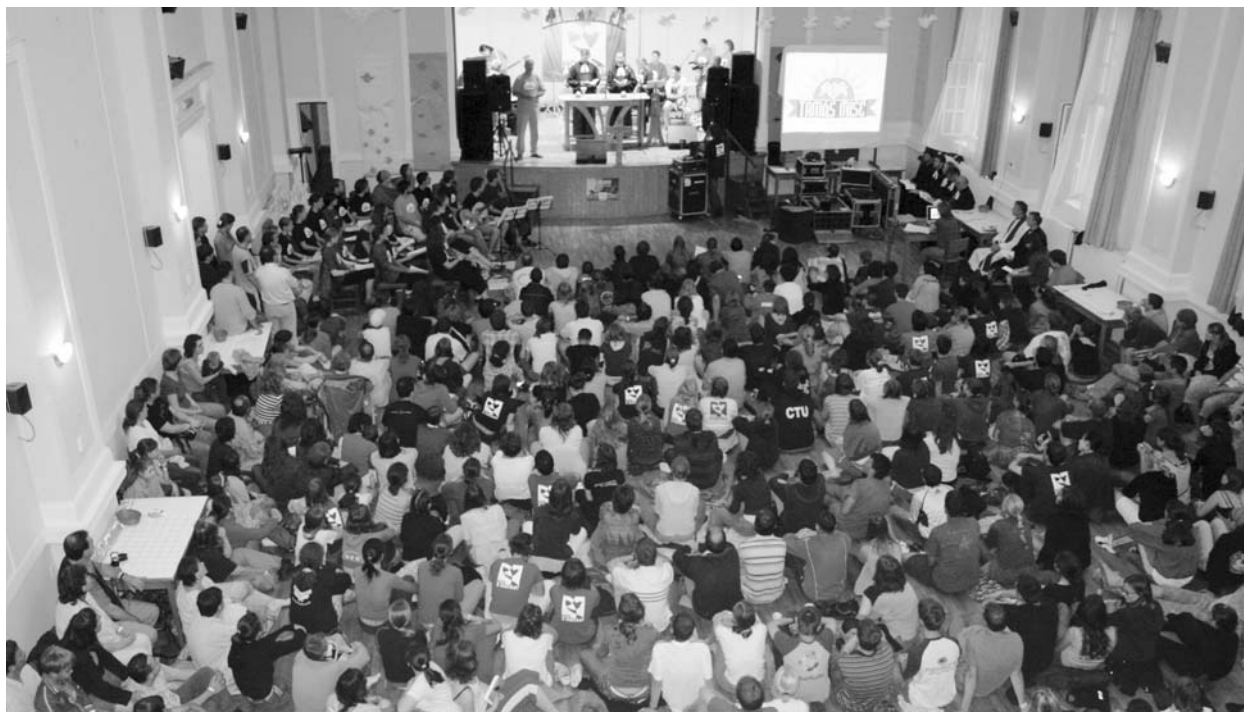
Tamás-mise a díszteremben