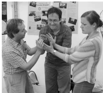
A kertész szerelme című drámajáték

Olyan növényeket természetien, amelyek a betegségekkel szemben ellenállóbbak, vagy jobban tűrik a szárazságot, természetesen jó dolog. A veszély ebben mégis az, hogy a DNS megváltoztatása előre nem tervezett „mellékhatásokat” eredményezhet. Kísérletek igazolják, hogy például a genetikailag módosított