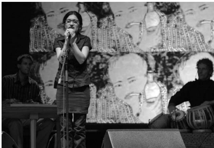
Mitsoura-varázs à la Kőszeg

Számos szempontja lehet persze annak, hogy mi alapján kerül valaki nagy-, illetve kisszínpadra, tehát nem hozható minden esetben összefüggésbe a zenei minőséggel. Idei mércével mérve a 2006-ban játszó Só és Morgenfunk vagy a Tatán fellépő Blues Rádió Budapest zenekar is