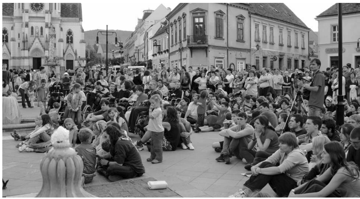
Szélrózsza – Kőszeg főterén

Általános társadalmi értékválság idején az egyházaknak segítséget kell nyújtaniuk az embereknek ahhoz, hogy különbséget tudjanak tenni: értékek vagy érzelmek mentén választják-e meg a politikai prioritásaikat – vette fel a beszélgetés fonalát Giró-Szász András. A pártpolitikai csatározás során a politikai haszonszerzés felülírja az értékeket, az egyházaknak azonban értékekre alapuló identitásukból eredően eleve felelőssé-