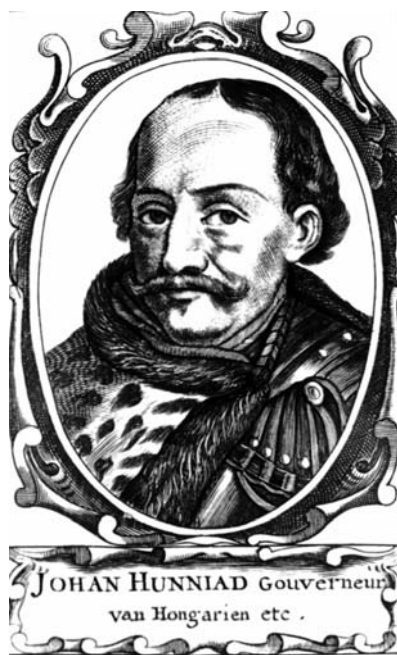
JOHAN HUNNIAD Gouverneur van Hongariën etc.

Közben zajlott az ostrom. Hunyadi csak néhány napot adott a fegyverforgatás elsajátítására, majd a sereggel Nándorfehérvár felé vette az irányt. Elsőként