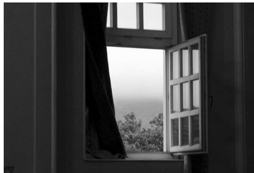
KISS TÜNDE: Kint és bent között (hangulat kategória, 1. helyezés)