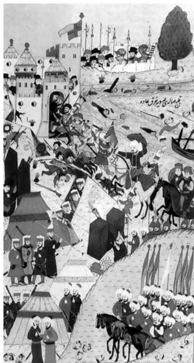
Nándorfehérvár ostroma (török miniatúra az isztambuli Topkapı Szeráj Múzeumban)

Kapisztrán Szalánkeménen ütött tábor. Hunyadi is odament, hogy a hazánk védelmére felsereglett, többnyire földművesekből álló sokaságból katonákat faragjon. Csakhogy a kereszttesek kijelentették: az ő vezérük Kapisztrán, csak tőle fogadnak el parancsot. Kompromisszumos megoldás született: a keresztteseket csoportokra osztották, amelyeket egy-egy ferences szerzetes vezetett.