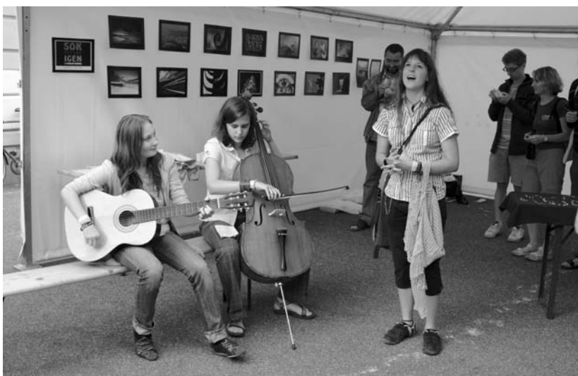
„Sok fecske igen” – az Aspartam együttes néhány tagja a myLuther myFotósulijának anyagából rögtönzött kiállítás megnyitóján