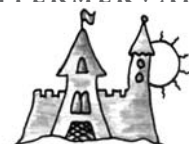
Rovatgazda: Boda Zsuzsa

4. Miután Gedeon végképp megbizonyosodott arról, hogy az Úr őt választotta ki, hogy megszabadítsa Izráel népét ellenségeitől, másnap reggel seregével elindult, hogy Gileád hegyén, a Haród forrásánál tábort verjen. Tőlük északra volt a midjániták tábora, lent a völgyben. Gedeon harcra hívó szavára harminckétezer ember gyűlt össze. Az Úr azonban ezt mondta Gedeonnak: – Túl nagy ez a sereg. Ha ennyi emberrel győznél, Izráel nem ismerné fel, hogy az én segítségemmel győzte le az ellenfelet, hanem azt gondolná, hogy a maga erejéből sikerült nyernie. Ezért hirdesd