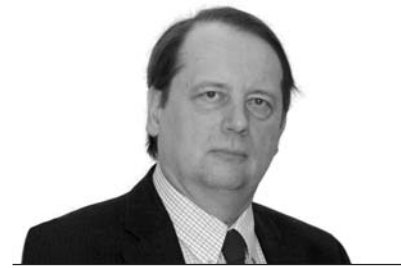
Gáncs Péter püspök Déli Egyházkerület

S a legvégén kaptuk az igazi meglepetést, azt a szípkorkázoan szellemes áldásbokrétát, amelyet lapunk legutóbbi számának címlapján olvashattunk. Ennek a tarka nyári csokornak egy hervadhatatlan sálával, mely íráson címéhez is kapcsolható, kívánok még szép nyári heteket, jó utat az árnyékvilágból a napvilágra: „Adjon Isten mindannyiunknak egy szál napraforgóvirágot, hogy élünk minden órájában keressük a világ világgosságát, Jézus Krisztust, felé forduljunk, őt szeressük, rajta tájékozódjunk, és őt kövessük.”