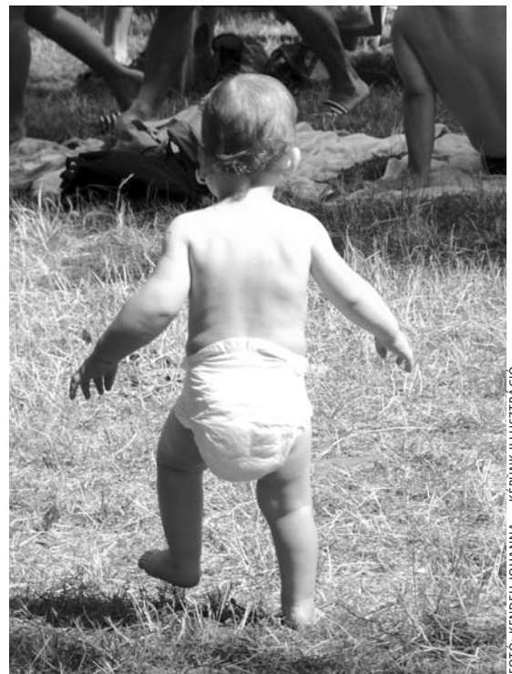
FOTÓ: KENDEH JOHANNA — KEFUNK ILLUSZTRÁCIÓ

Felölősségünk óriási: meg kell óvni gyerekeinket a szeméttől, de ha lépten-nyomon a rosszat látják, hogyan védjük őket? Tenniük kellene valamit az egyre hanyagabb, tökéletlenebb mondatok ellen.