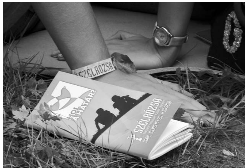
BALOGH MELINDA: Már szöveg nélkül (esemény kategória, 3. helyezés)