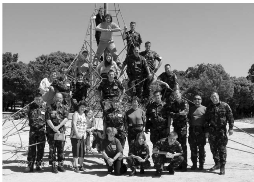
A találkozó magyar résztvevői

A tábor valódi konferenciarculatát szombaton nyerte el: délelőtt meghallgathattuk a lengyel tábori püspök színvonalas előadását, aki kifejezetten a katonai